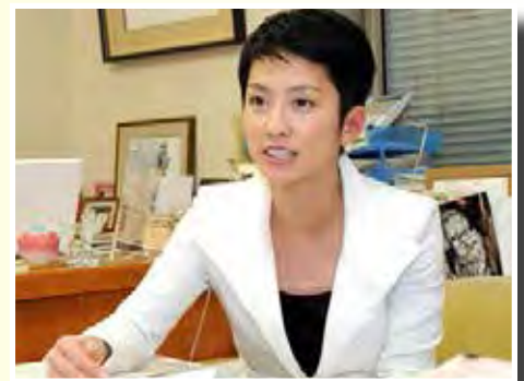
นางเรนไฮ้ มูราตะ

วันที่ ๒๗ กรกฎาคม ๒๕๖๐ นางเรนไฮ้ มูราตะ หัวหน้าพรรคประชาธิปไตยแห่งประเทศไทยพ้นตำแหน่ง ซึ่งก็เป็นฝ่ายค้าน ทั้งนี้ นางเรนไฮ้ คาดหวังจะกอบกู้ภาพลักษณ์พรรคเมื่อได้รับเลือกตั้งให้เป็นสตรีคนแรกที่ได้รับตำแหน่งหัวหน้าพรรคฝ่ายค้านญี่ปุ่นเมื่อเดือนกันยายน ๒๕๖๐ แต่ชื่อเสียงของพรรคต้องมัวหมองไปกับการทะเลาะวิวาท และการไม่สามารถทำตามสัญญาตลอดเวลาที่เป็นรัฐบาลระหว่างปี ๒๕๕๒-๒๕๕๕ อย่างไรก็ตาม คณะนินยของพรรคยังคงต่ำกว่าร้อยละ ๑๐ ทั้งที่นายกรัฐมนตรีอาเบะมีคะแนนนิยมลดลงเหลือไม่ถึงร้อยละ ๓๐ นางเรนไฮ้จึงตัดสินใจลาออกเพื่อให้พรรคมีผู้นำคนใหม่ เนื่องจากไม่สามารถทำให้พรรคเป็นทางเลือกของประชาชนแทนรัฐบาลอาเบะที่เป็นรัฐบาลที่ไม่เชื่อสัตย์ได้ และจะมีการเลือกตั้งหัวหน้าพรรคคนใหม่ในทันที