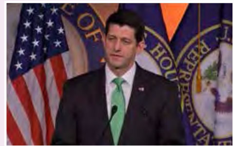
นายพอล ไรอัน

วันที่ ๒๖ กรกฎาคม ๒๕๖๐ นายพอล ไรอัน ประธานสภาผู้แทนราษฎรสหรัฐอเมริกากล่าวภายหลังการลงประชามติว่า มาตรการคว่ำบาตรใหม่จะมีเป้าหมายไปที่การจัดการกับปัญหาที่อันตรายที่สุดเพื่อความปลอดภัยของชาวอเมริกัน มาตรการดังกล่าวได้ส่งให้วุฒิสภาพิจารณาต่อไป โดยจะมีการออกเสียงสนับสนุนการคว่ำบาตร และอาจจะอภิปรายกันว่า มาตรการดังกล่าวจะรวมถึงการใช้มาตรการลงโทษเกาหลีเหนือด้วยหรือไม่ ในขณะที่มีข้อกล่าวหาว่ารัสเซียแทรกแซงการเลือกตั้งประธานาธิบดีสหรัฐอเมริกาปี ๒๕๕๙ และการคว่ำบาตรมตินแดนโครเมียะ ส่งผลให้สหรัฐอเมริกาถือว่ารัสเซียมีท่าทีคุกคาม ส่วนการคว่ำบาตรอิหร่านและกองกำลังพิทักษ์ปฏิวัติอิหร่านรอบใหม่เป็นไปตามข้อกล่าวหาว่ามี การสนับสนุนการก่อการร้าย