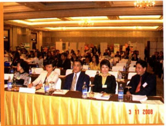
การเสวนา เรื่อง “เที่ยวไทยหัวใจเดียวกัน”