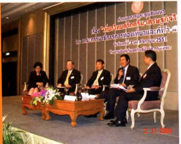
การเสวนา เรื่อง “เที่ยวไทยหัวใจเดียวกัน”