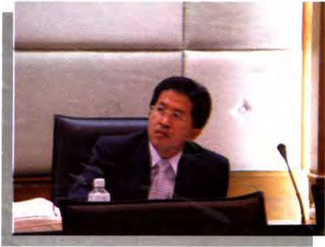
นายวิทยา แก้วภราดัย ที่ปรึกษาคณะกรรมการ