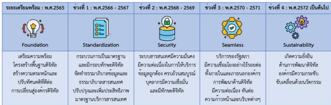
รูปภาพที่ ๔ กรอบแผนที่นำทางแผนพัฒนารัฐสภาดิจิทัล (Digital Parliament)

ส่วนราชการสังกัดรัฐสภาได้จัดทำแผนพัฒนารัฐสภาดิจิทัล (Digital Parliament) พ.ศ. ๒๕๖๖-๒๕๗๐ เพื่อกำหนดทิศทางการพัฒนาเป็นแผนที่นำทางให้บรรลุเป้าหมายตามกรอบวิสัยภาวะขององค์กรดิจิทัล โดยแบ่งระยะเป็น ๔ ช่วง ที่สอดคล้องตามสถานะและความพร้อมของรัฐสภา แสดงกรอบแผนที่นำทางแผนพัฒนารัฐสภาดิจิทัล (Digital Parliament) พ.ศ. ๒๕๖๖-๒๕๗๐ ดังรูปภาพที่ ๔