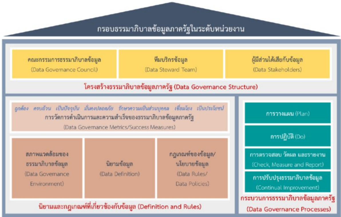
รูปภาพที่ ๑ กรอบธรรมาภิบาลข้อมูลภาครัฐ