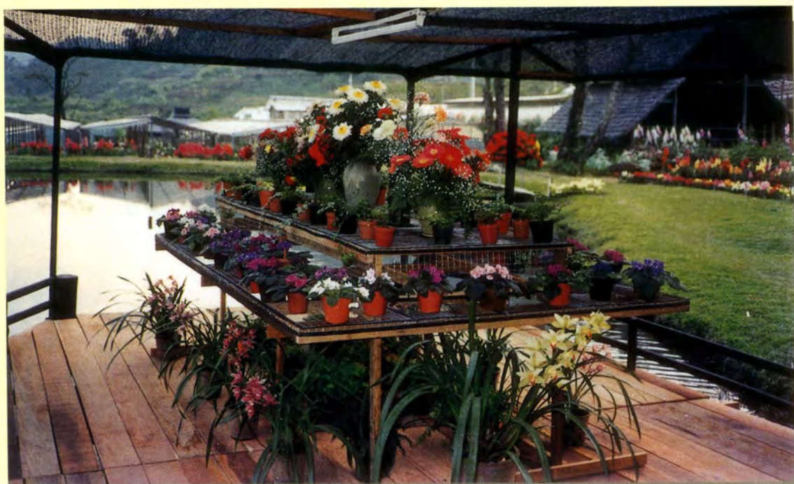
ไม้ดอกเมืองหนาวที่ปลูก