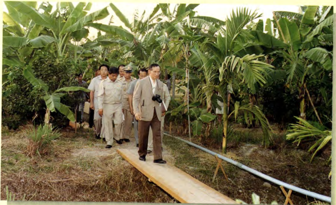
พระบาทสมเด็จพระเจ้าอยู่หัวพระราชทานพระราชดำริเรื่อง ทฤษฎีใหม่ เพื่อให้ประชาชนมีกินตามอัตภาพ คืออาจไม่รวยมาก แต่ก็พอกิน ไม่อดอยาก และสามารถพึ่งพาตนเองได้