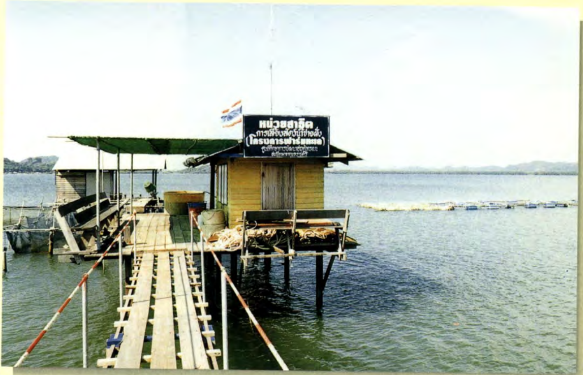
หน่วยสาธิตการเลี้ยงสัตว์น้ำชายฝั่งในศูนย์ศึกษาการพัฒนาอ่าวคุ้งกระเบน