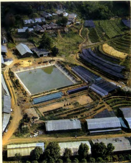
สถานีเกษตรหลวงอ่างขางในมุมสูง มองเห็นอ่างเก็บน้ำและเรือนเพาะชำ