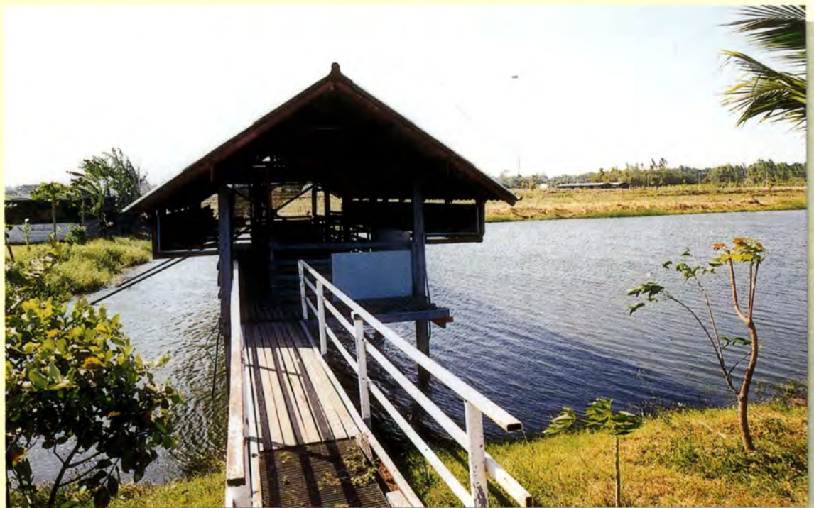
แปลงสาธิตการเกษตรแบบผสมผสาน พร้อมด้วยสระน้ำ ตามแนวพระราชดำริของพระบาทสมเด็จพระเจ้าอยู่หัวเรื่อง “ทฤษฎีใหม่”