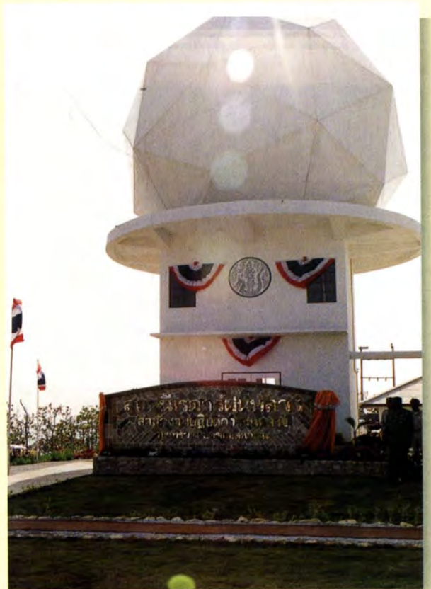
สถานีเรดาร์ฝนหลวง

พระบาทสมเด็จพระเจ้าอยู่หัวทรงอธิบาย วิธีการทำฝนหลวงพระราชทานแก่นักเรียนชั้น มัธยมศึกษาตอนต้นและตอนปลาย โรงเรียน วังไกลกังวล ในพระบรมราชูปถัมภ์ ในโอกาส เสด็จพระราชดำเนินไปทรงเยี่ยมศูนย์วิจัยปฏิบัติ การฝนหลวงเฉลิมพระเกียรติ ณ สนามบิน บ่อผ้าย อำเภอบ้านนา จังหวัดประจวบคีรีขันธ์