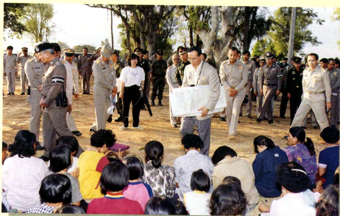
พระบาทสมเด็จพระเจ้าอยู่หัวทรงปฏิบัติพระราชกรณียกิจเพื่อประโยชน์สุขของมหาชนชาวสยาม เสมอมา นับแต่เสด็จขึ้นครองราชย์จวบจนปัจจุบัน