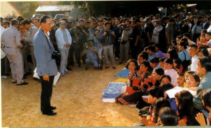
ทรงเยี่ยมราษฎรชาวไทยภูเขาที่มาเฝ้า ทูลละอองธุลีพระบาทในโอกาสเสด็จ พระราชดำเนินไปทอดพระเนตรสถานี เกษตรหลวงอ่างขาง ตำบลม่อนปิ่น อำเภอฝาง จังหวัดเชียงใหม่

ทอดพระเนตรการดำเนินงานศึกษาวิจัย การปลูกพืชผลเมืองหนาวที่มูลนิธิ โครงการหลวงได้ส่งเสริมให้ราษฎร ชาวไทยภูเขาทำการปลูกเพื่อให้มีอาชีพ และมีที่ทำกินถาวรอยู่เป็นหลักแหล่ง เลิกทำไร่เลื่อนลอย ตามแนวพระราช ดำริของพระบาทสมเด็จพระเจ้าอยู่หัว ฯ สถานีเกษตรหลวงอ่างขาง