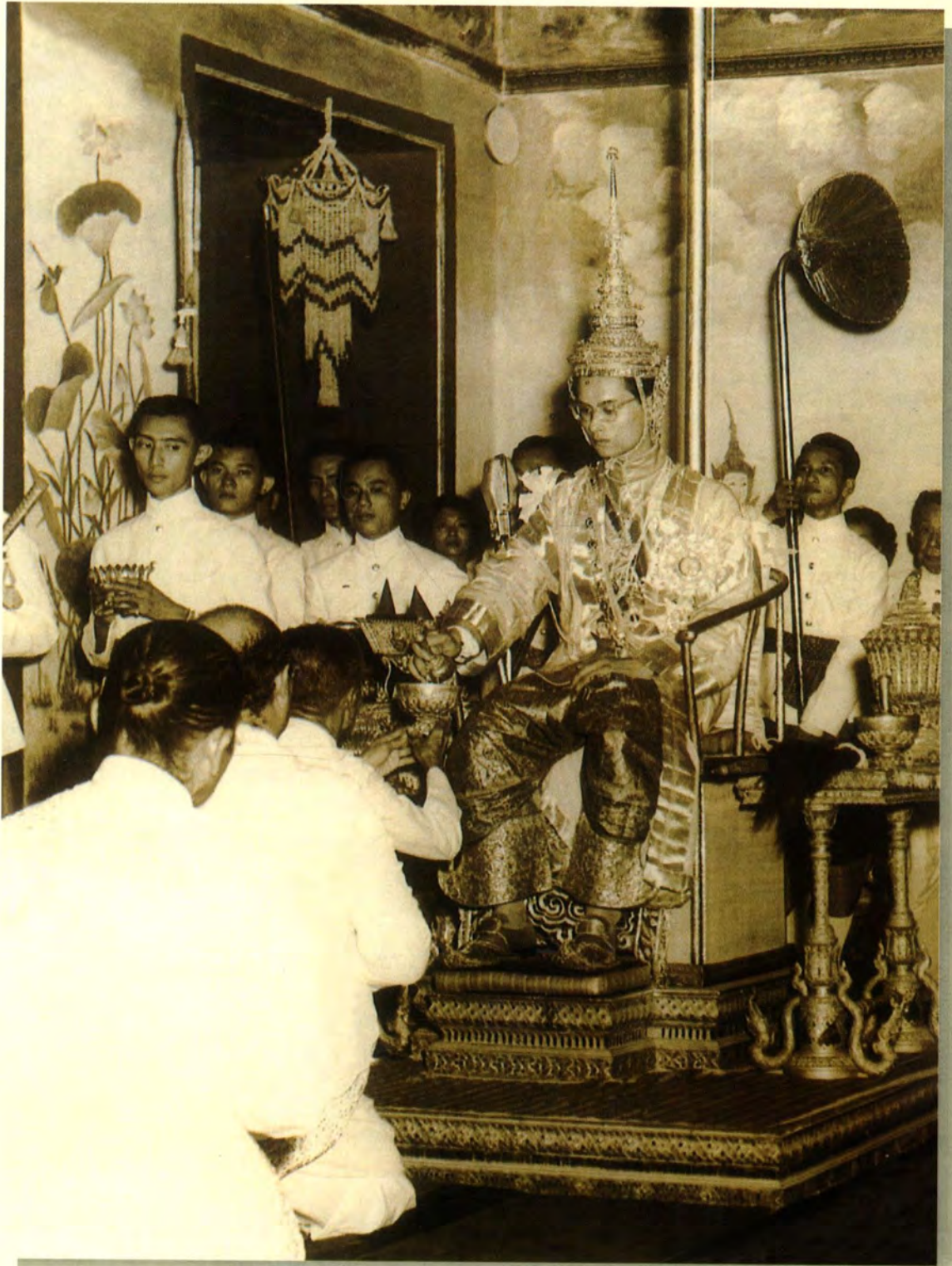
พระบาทสมเด็จพระเจ้าอยู่หัวภูมิพลอดุลยเดช ทรงยึดหลักการของทศพิธราชธรรม เป็นแนวทางในการปกครองบ้านเมืองและปกครองประชาชน