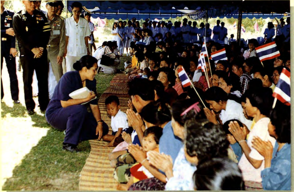
สมเด็จพระเทพรัตนราชสุดาฯ สยามบรมราชกุมารี เสด็จพระราชดำเนินเยี่ยมโรงเรียนในถิ่นทุรกันดาร