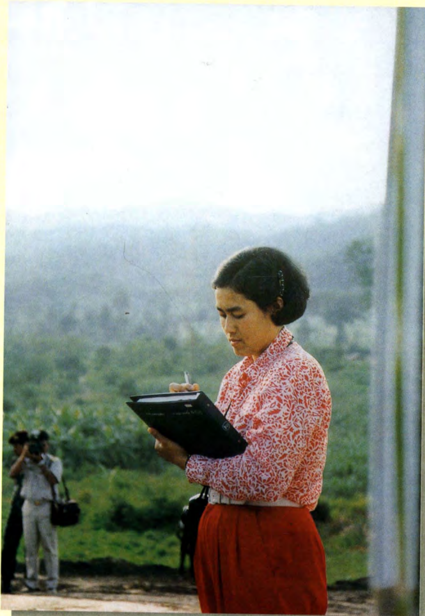
สมเด็จพระเทพรัตนราชสุดาฯ สยามบรมราชกุมารี เสด็จพระราชดำเนินเยี่ยม พื้นที่โครงการทดสอบการใช้ระบบสนเทศภูมิศาสตร์เพื่อพัฒนาการเกษตร ในอำเภอพัฒนานิคมและอำเภอย้ายบด จังหวัดลพบุรี