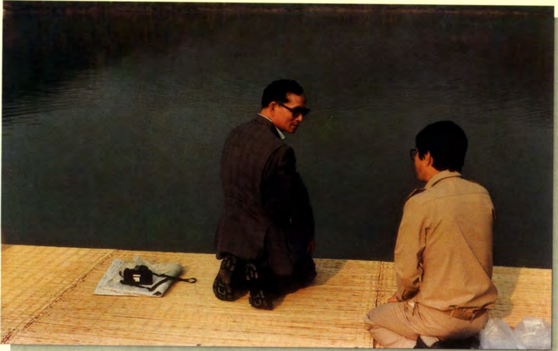
พระบาทสมเด็จพระเจ้าอยู่หัวพระราชทานพระราชดำริในการแก้ไขปัญหาเรื่องน้ำ ทั้งปัญหาน้ำขาดแคลน ปัญหาน้ำท่วม และปัญหาน้ำเสีย