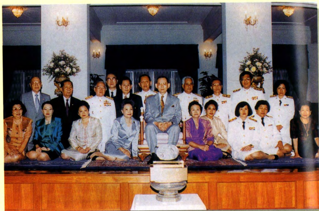
พระบาทสมเด็จพระเจ้าอยู่หัว และคณะกรรมการมูลนิธิราชประชานุเคราะห์ ในพระบรมราชูปถัมภ์