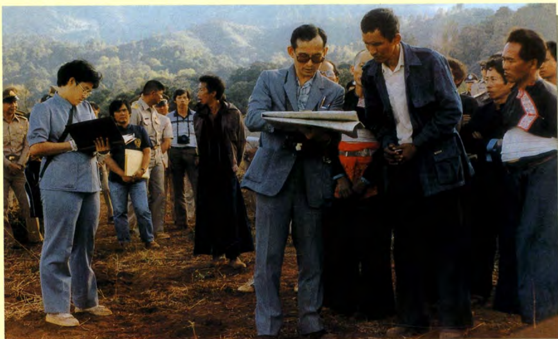
พระบาทสมเด็จพระเจ้าอยู่หัวทรงพระราชปฏิสันถารกับราษฎรชาวเขาซึ่งเป็นสมาชิกในโครงการหลวงหนองหอย ในโอกาสเสด็จพระราชดำเนินไปทอดพระเนตรโครงการหลวงหนองหอย อำเภอแม่วิม จังหวัดเชียงใหม่