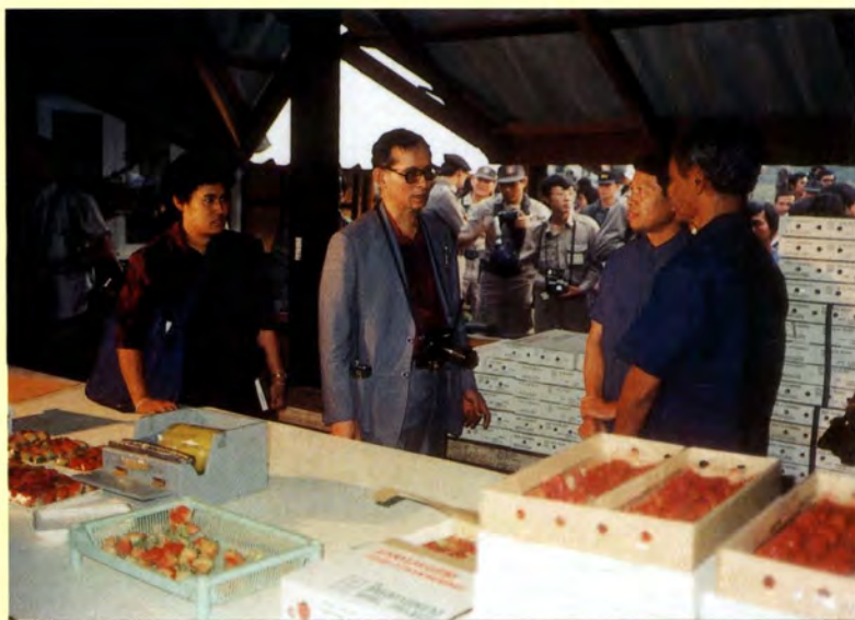
พระบาทสมเด็จพระเจ้าอยู่หัว และสมเด็จพระเทพรัตนราช- สุดาฯ สยามบรมราชกุมารี เสด็จพระราชดำเนินไปเยี่ยมชม ศูนย์พัฒนาโครงการห้วยลึก