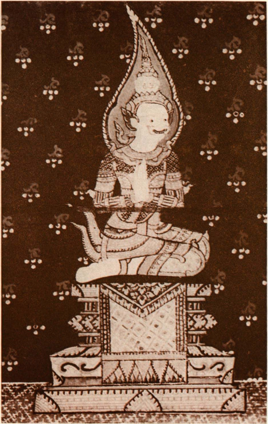
พระยามาร