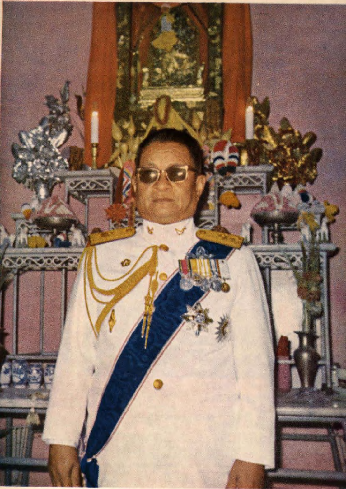
พลโท อร่าม เมนะคงคา ม.ว.ม., ป.ช., ต.จ.ว.