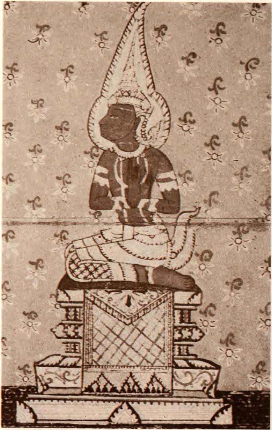
พระอินทร์