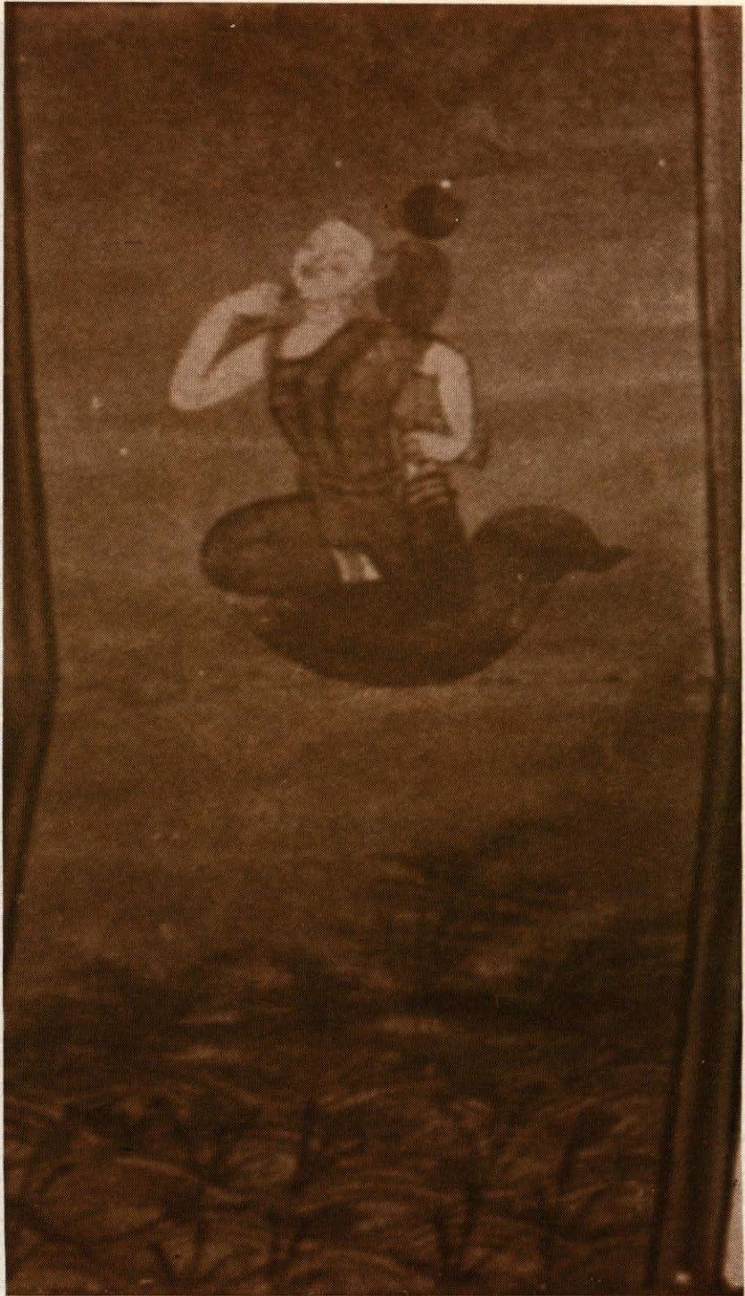
กาย วาจา ใจ บริสุทธิ์ มนุษย์เพาะได้