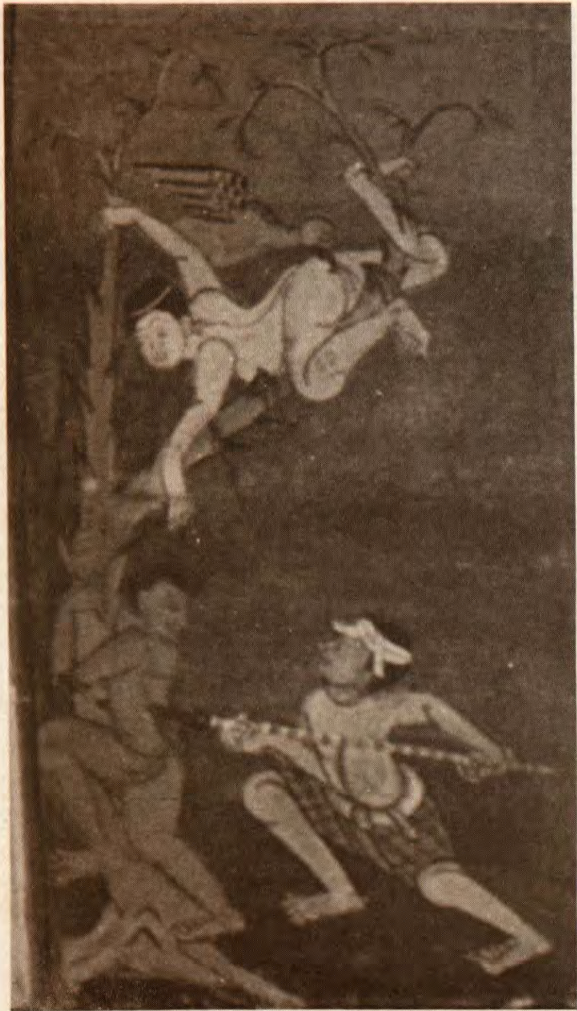
ต้นงวโนนรก