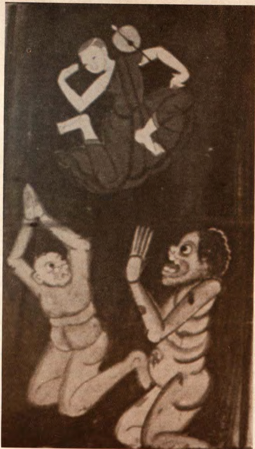
เมื่อหลวงพ่อมา ค่อยหายทุกข์น้อย