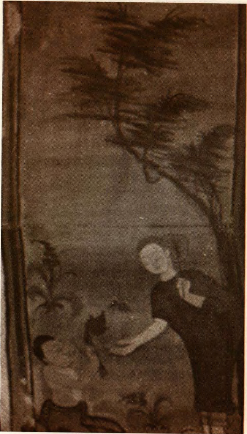
กะทาศาย เฝิมบุญ ด้วยดอกบัว