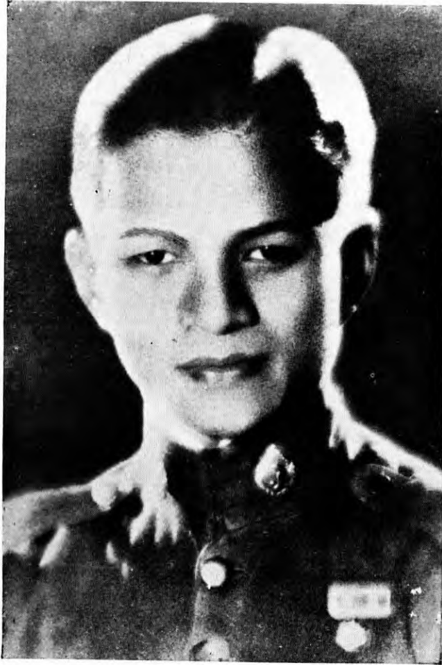
พลโท อร่าม