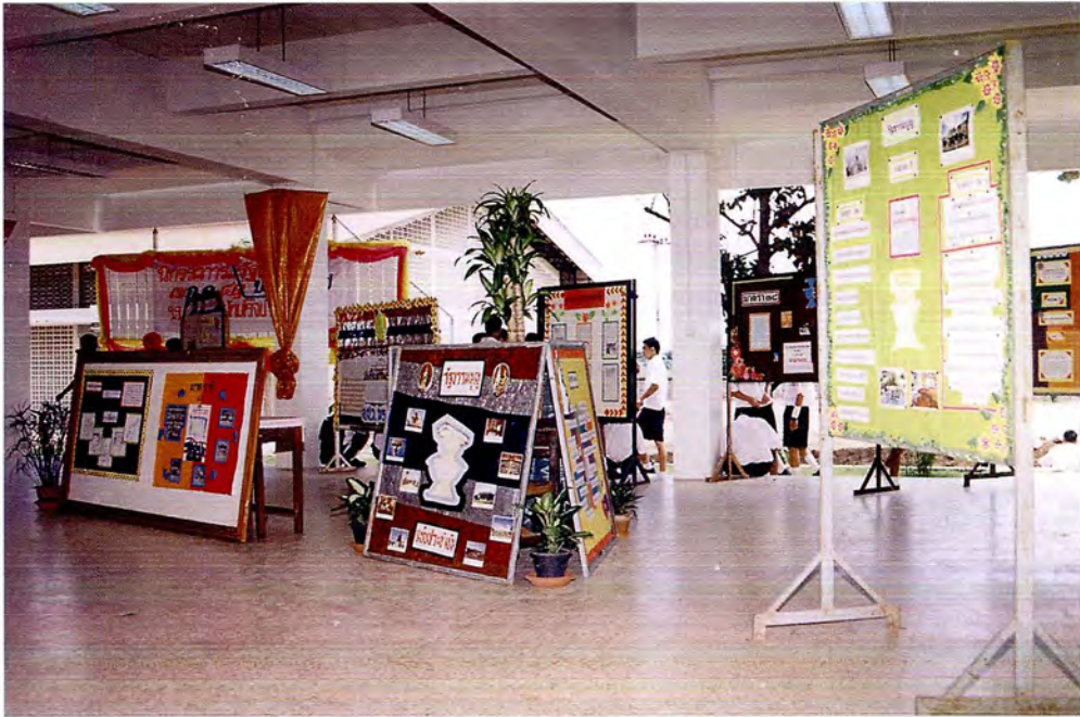
นิทรรศการ “มุมนิติสภา” ให้ความรู้เรื่องรัฐธรรมนูญและรัฐสภาไทย ณ โรงเรียนอ่างทองบัณฑิตโรจน์วิทยาตาม ในวันที่ 7 กรกฎาคม 2541