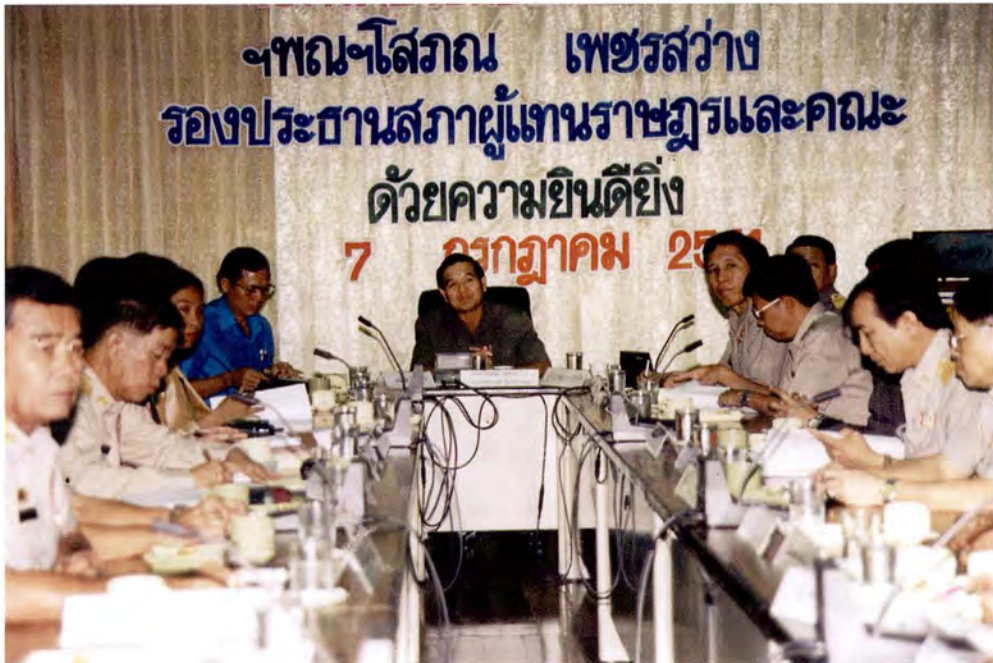
การเยี่ยมชมและรับฟังการบรรยายเกี่ยวกับสภาพทั่วไปและปัญหาของจังหวัดอ่างทอง ณ ศาลากลางจังหวัดอ่างทอง ในวันที่ 7 กรกฎาคม 2541