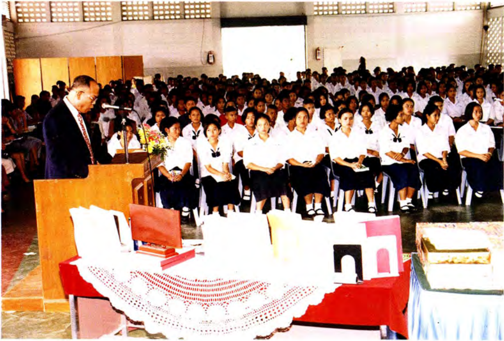
ผู้อำนวยการโรงเรียนกล่าวรายงานแก่ประธานคณะกรรมการฯ