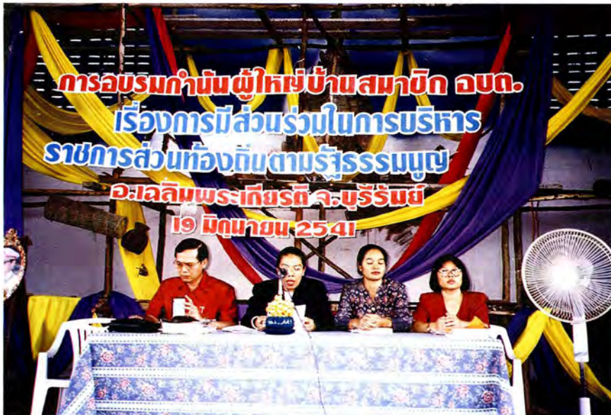
วิทยากรจากส่วนราชการต่างๆ ให้ความรู้แก่ผู้รับการอบรม