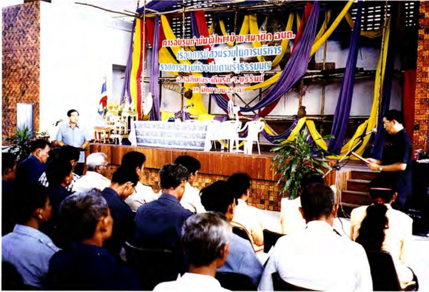
นายอำเภอเฉลิมพระเกียรติ จ.บุรีรัมย์ กล่าวรายงาน

การอบรมกำนัน ผู้ใหญ่บ้าน สมาชิก อบต. เรื่อง “การมีส่วนร่วมในการบริหารราชการส่วนท้องถิ่นตามรัฐธรรมนูญ” ที่ อ.นางรอง และ อ.เฉลิมพระเกียรติ จ.บุรีรัมย์ เป็นกิจกรรมหนึ่งในโครงการส่งเสริมภารกิจของสภาผู้แทนราษฎร