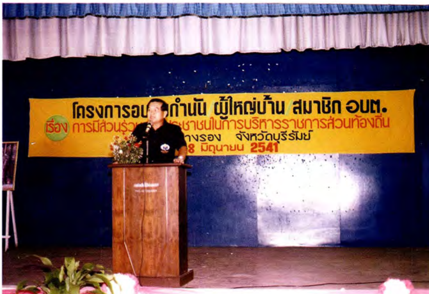
รองประธานสภาผู้แทนราษฎร คนที่ 1 ปกฐกภาพพิเศษ