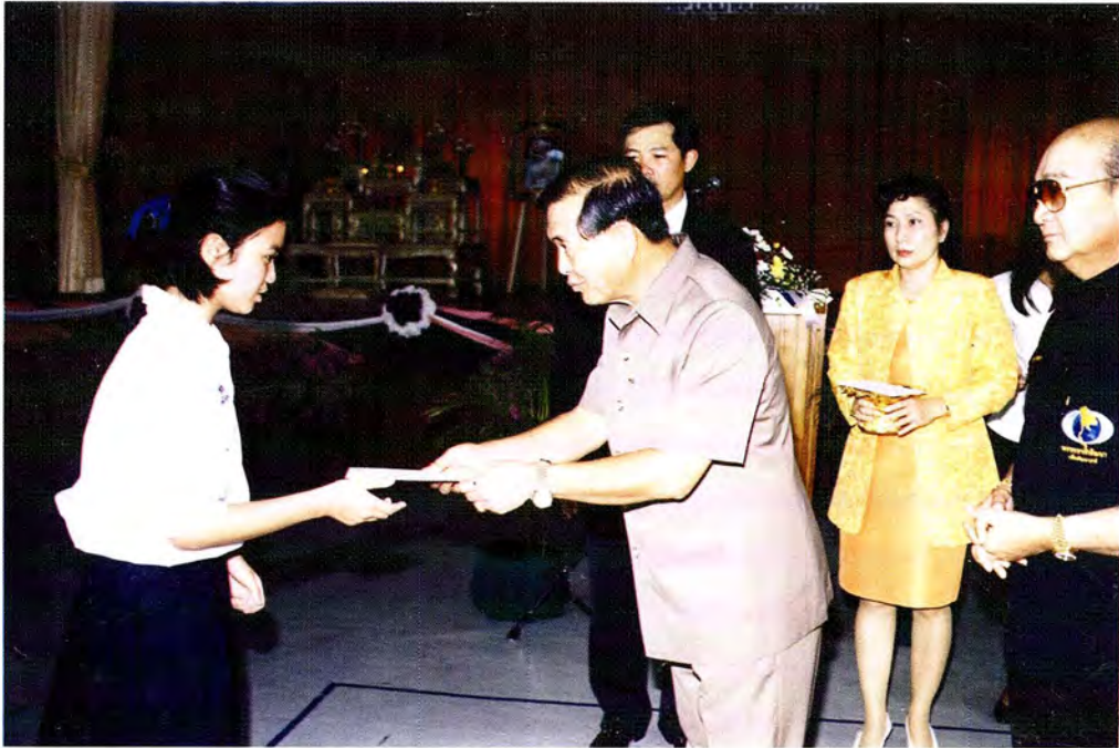
ประธานคณะกรรมการฯ มอบรางวัลแก่นักเรียนที่เข้าร่วมกิจกรรมการโต้วาที