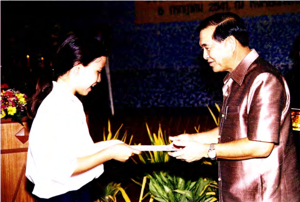
ประธานคณะกรรมการฯ มอบรางวัลและใบประกาศเกียรติคุณ แก่นักเรียนที่ชนะเลิศการประกวดการพูดเสนอบทความ