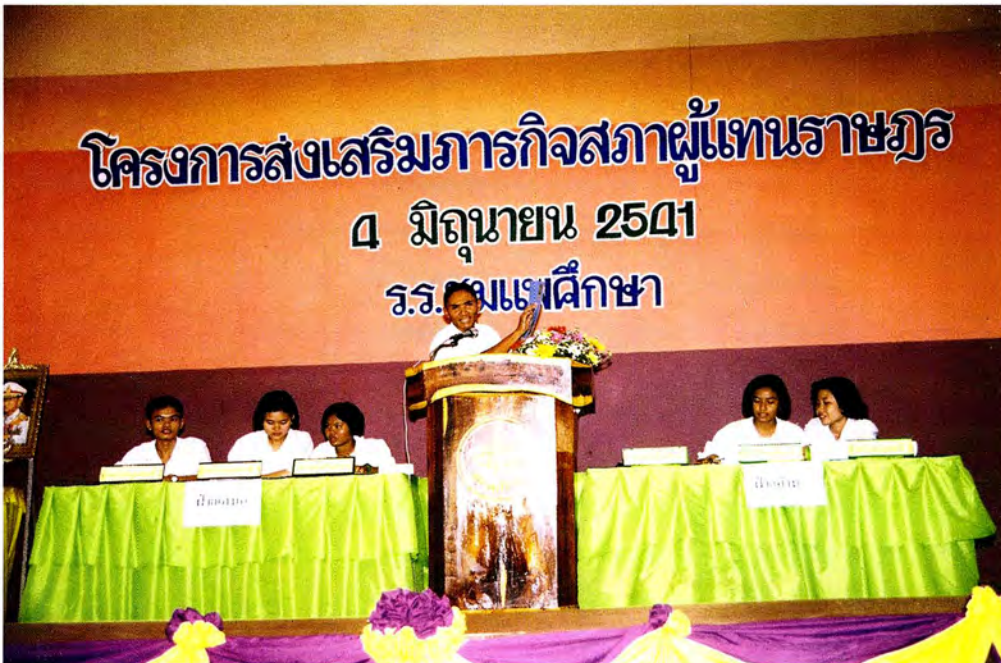
กิจกรรมของโครงการฯ การประกวดโต้วาที ซึ่งนักเรียนที่เข้าร่วมโครงการฯ ให้ความสนใจ