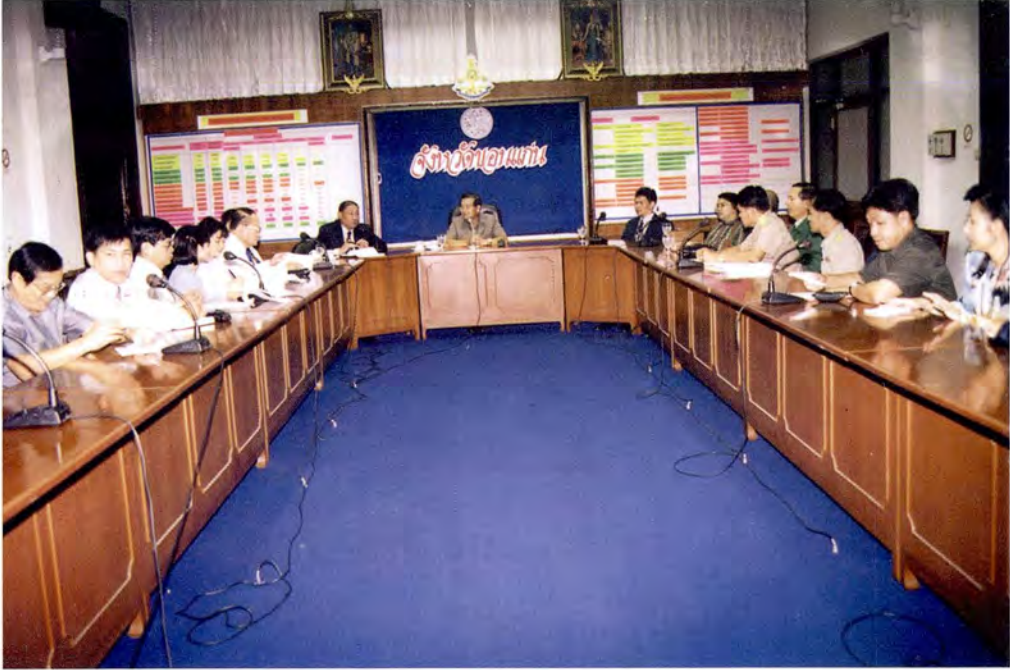
การเยี่ยมชมและรับฟังการบรรยายเกี่ยวกับสภาพทั่วไปและปัญหาของจังหวัดขอนแก่น ณ ศาลากลางจังหวัดขอนแก่น ในวันที่ 3 มิถุนายน 2541