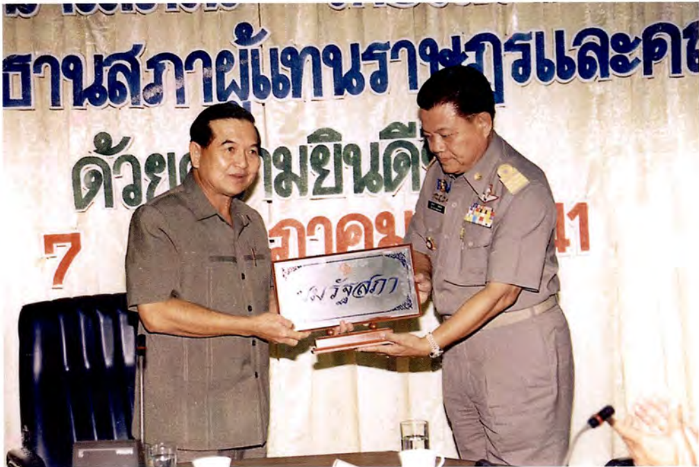
ประธานคณะกรรมการฯ มอบ “มุขรัฐสภา” ให้แก่ผู้ว่าราชการจังหวัดอ่างทอง ณ ศาลากลางจังหวัดอ่างทอง