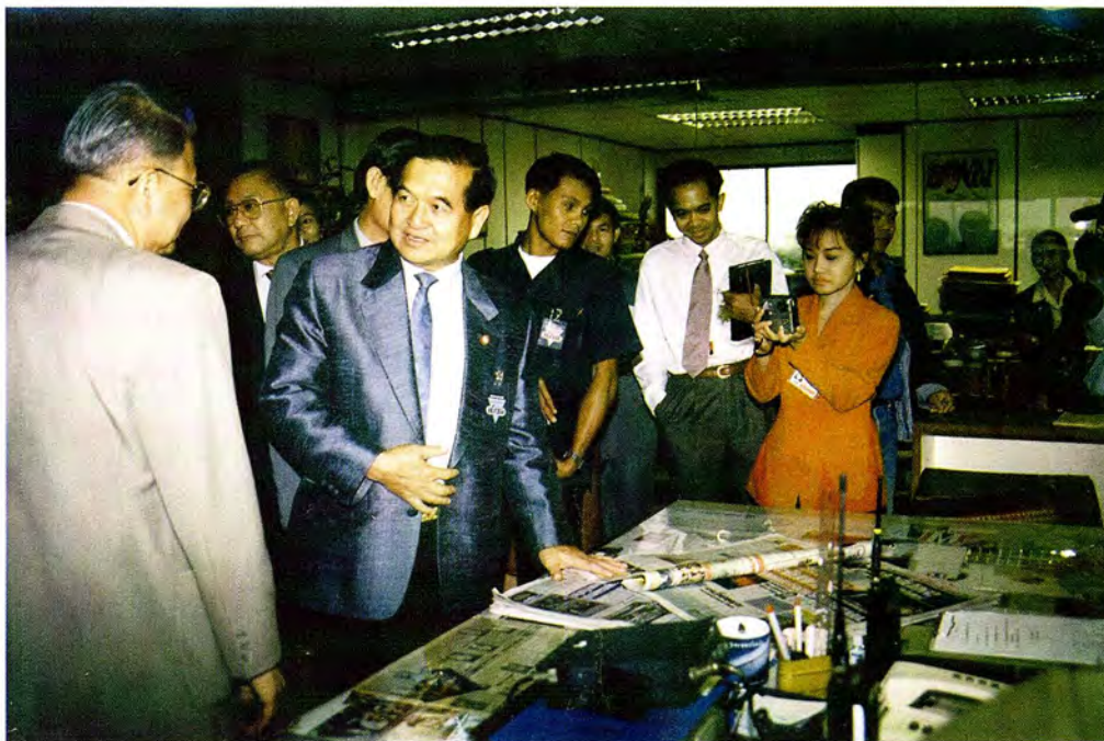
คณะกรรมการพัฒนาประชารัฐและข้าราชการสำนักงานเลขาธิการสภาผู้แทนราษฎร เยี่ยมชมหนังสือพิมพ์มติชน ในวันพุธที่ 2 กันยายน 2541