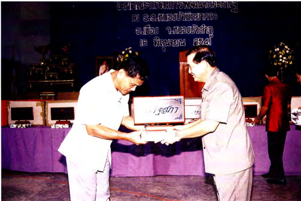
ประธานคณะกรรมการฯ มอบ “มูมรัฐสภา” ให้แก่ตัวแทนอาจารย์โรงเรียนที่นำเด็กนักเรียนมาเข้าร่วมโครงการฯ