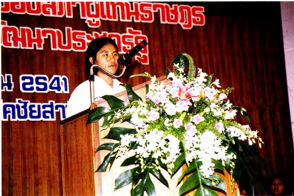
นักเรียนที่เข้าร่วมแข่งขันประกวดการพูดเสวนาสอบทความ