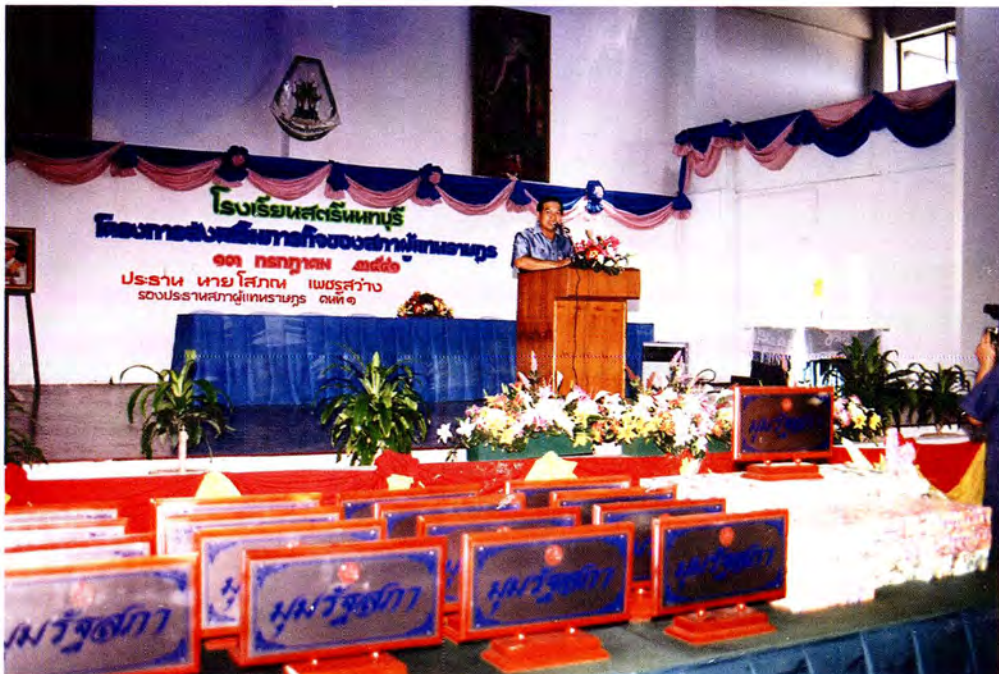
ประธานคณะกรรมการฯ กล่าวปาฐกถาพิเศษแก่นักเรียน