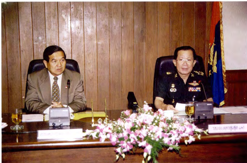
คณะกรรมการพัฒนาประชาธิปไตยและข้าราชการสำนักงานเลขาธิการสภาผู้แทนราษฎร เยี่ยมชมและรับฟังบรรยายพิเศษ ณ กองบัญชาการทหารสูงสุด ในวันพฤหัสบดีที่ 20 สิงหาคม 2541