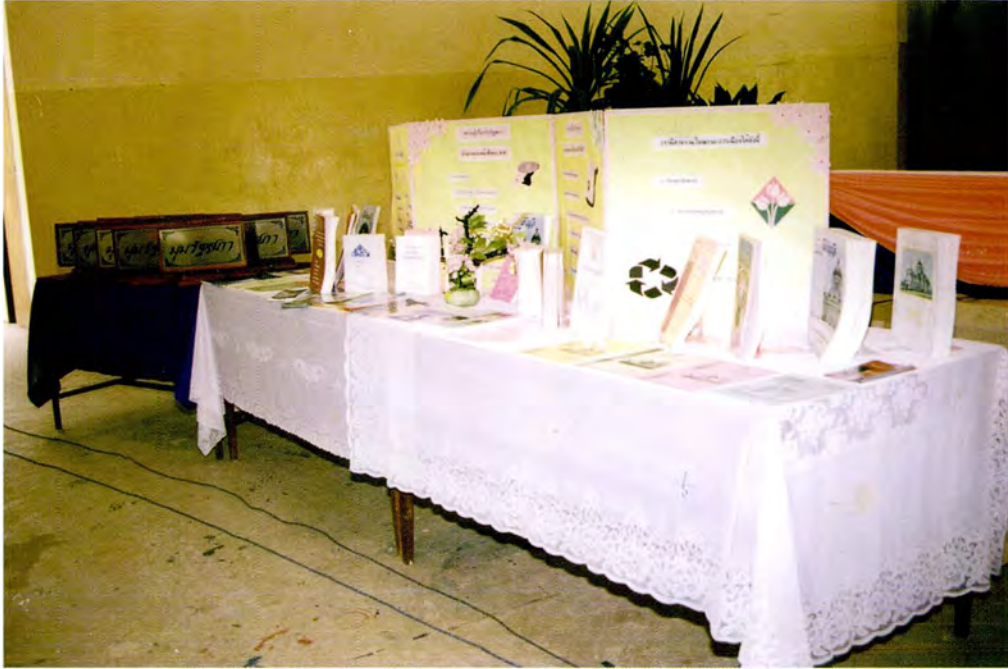
หนังสือและเอกสารที่โครงการฯ นำไปมอบให้โรงเรียนเพื่อจัดเป็น “มุมรัฐสภา”