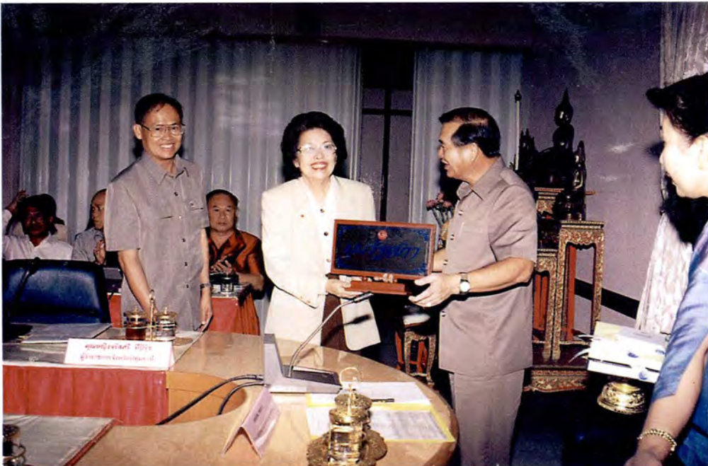
การเยี่ยมชมและรับฟังการบรรยายเกี่ยวกับสภาพทั่วไปและปัญหาของจังหวัดบึงกาฬ และมอบ “มุขรัฐสภา” ณ ศาลากลางจังหวัดบึงกาฬ ในวันที่ 14 กรกฎาคม 2541