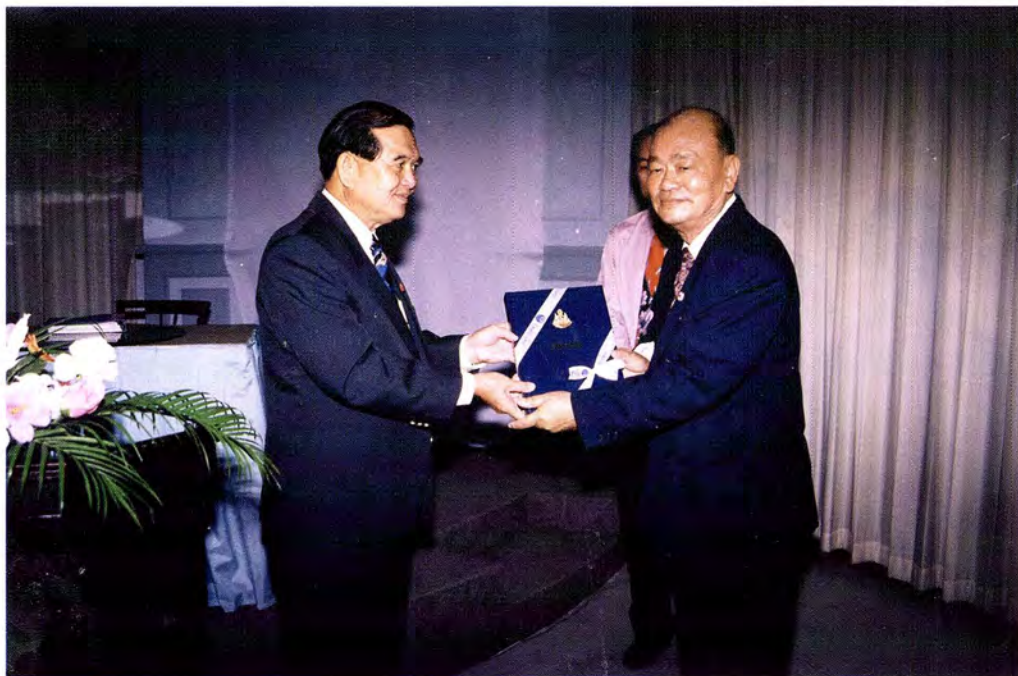
คณะกรรมการพัฒนาประชาธิปไตยและข้าราชการสำนักงานเลขาธิการสภาผู้แทนราษฎร เยี่ยมชมสถานีวิทยุโทรทัศน์ไทยทีวีสี ช่อง 3 อ.ส.ม.ท. (ทนสองแฉม) ในวันพฤหัสบดีที่ 3 กันยายน 2541