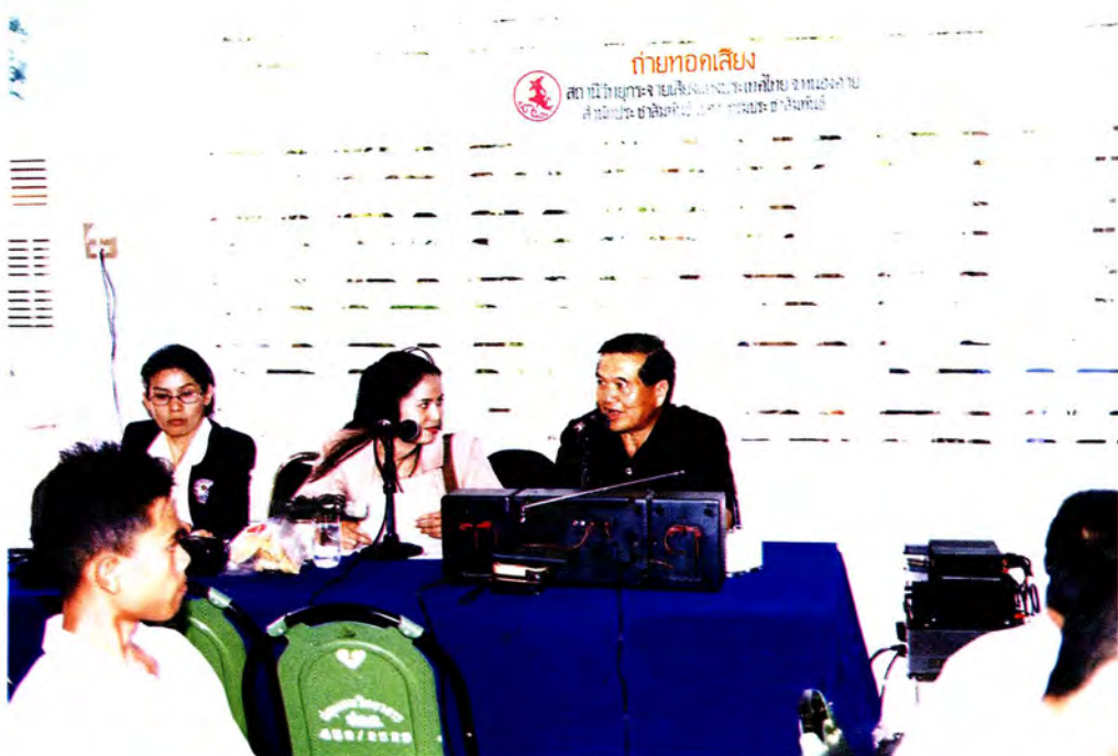
ประธานคณะกรรมการฯ ได้ให้สัมภาษณ์แก่สถานีวิทยุกระจายเสียงแห่งประเทศไทย ซึ่งให้ความร่วมมือแก่คณะกรรมการฯ ในการถ่ายทอดเสียงการปฏิบัติการกิจ ภายใต้โครงการส่งเสริมภารกิจของสภาผู้แทนราษฎรทุกครั้งที่มีการดำเนินกิจกรรม ตลอดโครงการฯ ในปี 2541