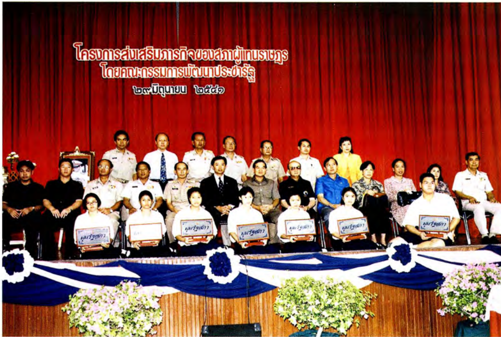
คณะกรรมการพัฒนาประชาธิปไตยรัฐถ่ายรูปร่วมกับตัวแทนโรงเรียนที่เข้าร่วมโครงการฯ