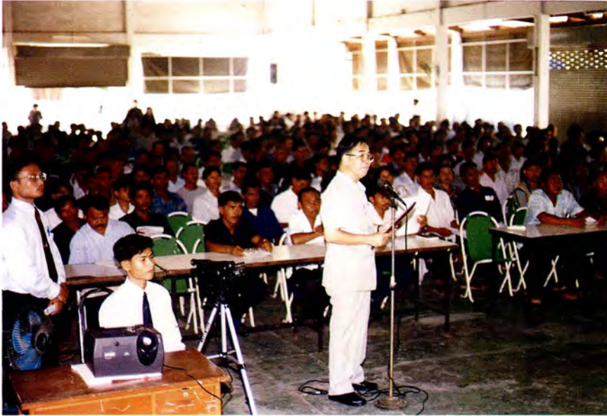
นายอำเภอหนองงอแงรายงานต่อรองประธานสภาผู้แทนราษฎร คนที่ 1