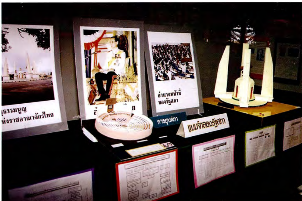
นิทรรศการ “มุมนิติสภา” ให้ความรู้เรื่องรัฐธรรมนูญและรัฐสภาไทย ณ โรงเรียนสตรีรัตนทบุรี ในวันที่ 13 กรกฎาคม 2541