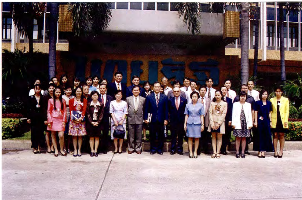
คณะกรรมการพัฒนาประชารัฐและข้าราชการสำนักงานเลขาธิการสภาผู้แทนราษฎร เยี่ยมชมหนังสือพิมพ์ไทยรัฐ และหนังสือพิมพ์เดลินิวส์ ในวันอังคารที่ 1 กันยายน 2541