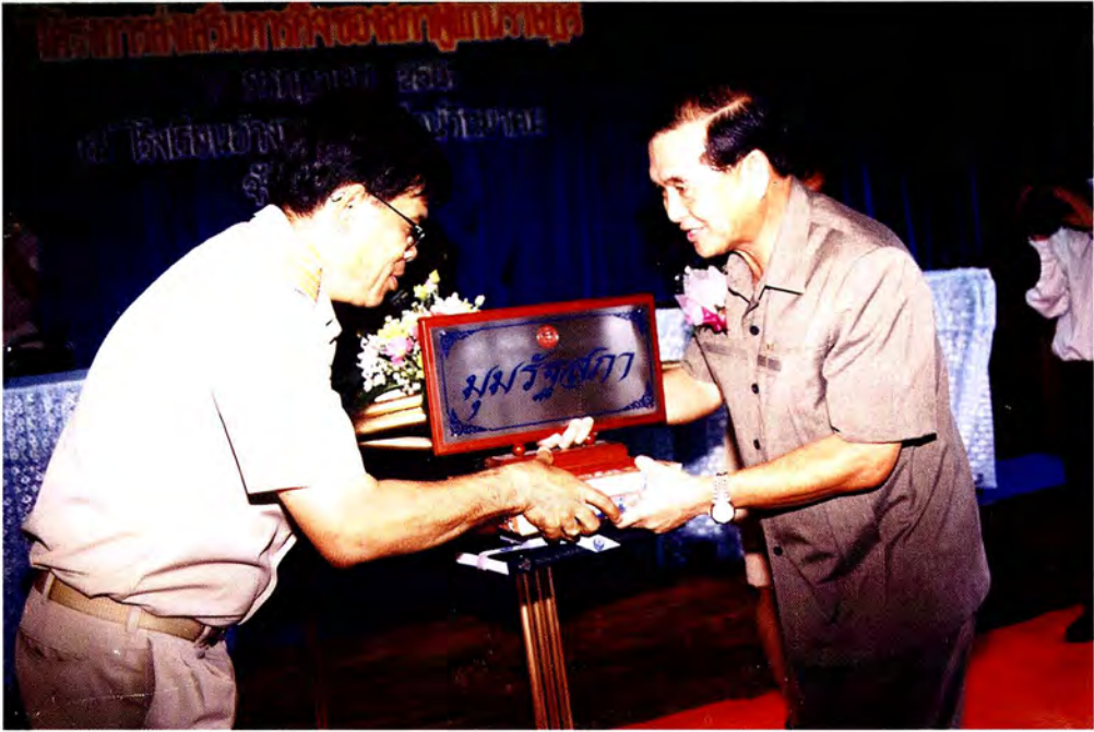
ประธานคณะกรรมการฯ มอบ “มูมรัฐสภา” ให้แก่ผู้อำนวยการโรงเรียน