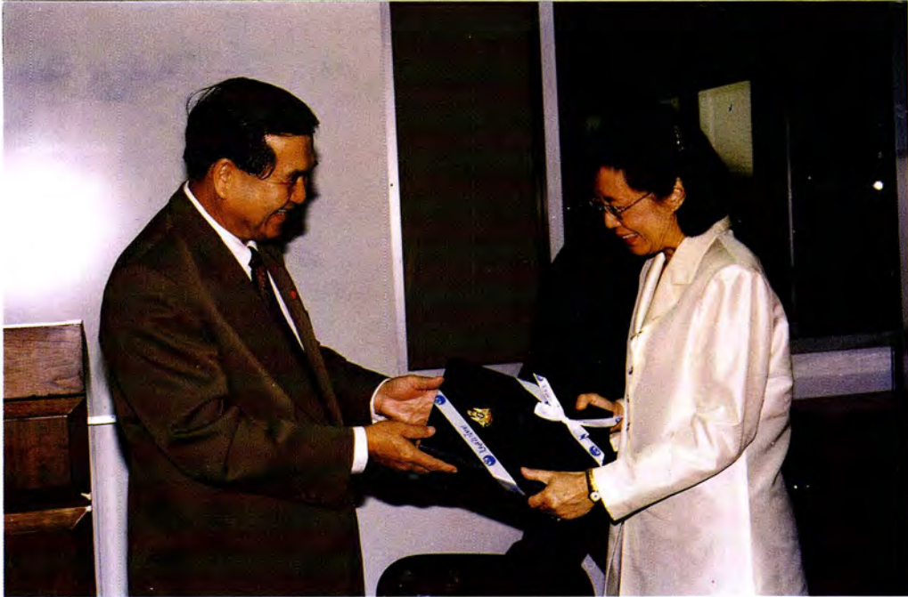
คณะกรรมการพัฒนาประชาธิปไตยและข้าราชการสำนักงานเลขาธิการสภาผู้แทนราษฎร เยี่ยมชมสถานีโทรทัศน์สีทองทัพบก ช่อง 7 ในวันอังคารที่ 15 กันยายน 2541