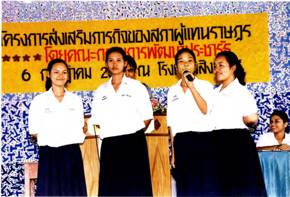
เด็กนักเรียนที่เข้าร่วมกิจกรรมการโต้วาที โรงเรียนสิงห์บุรี ในวันที่ 6 กรกฎาคม 2541