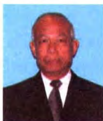
พลเอก พิชาญเมธ ม่วงมณี ที่ปรึกษาคณะกรรมการ