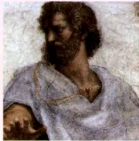
อริสโตเติล (Aristotle)