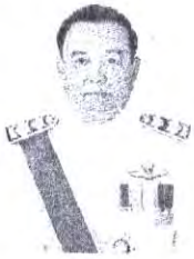
หม่อมราชวงศ์วุฒิเลิศ เทวกุล