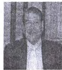
พล.ต.ต. สุรินทร์ ปาลาเร่