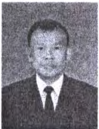
พ.ต.อ. วัชร สารดร