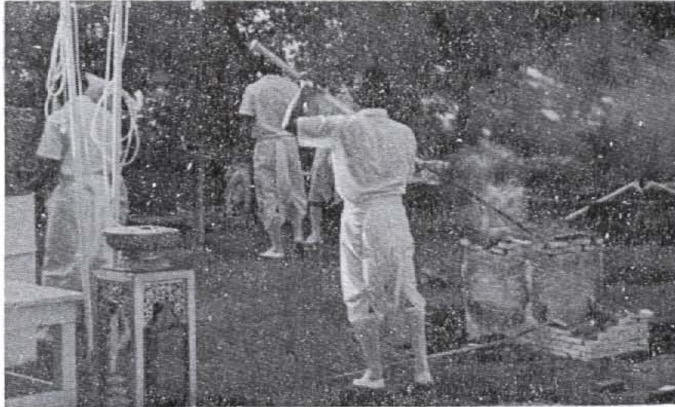
เจ้าหน้าที่กำลัง หลอมโลหะเพื่อ ใช้ในพระราช- พิธีเททอง