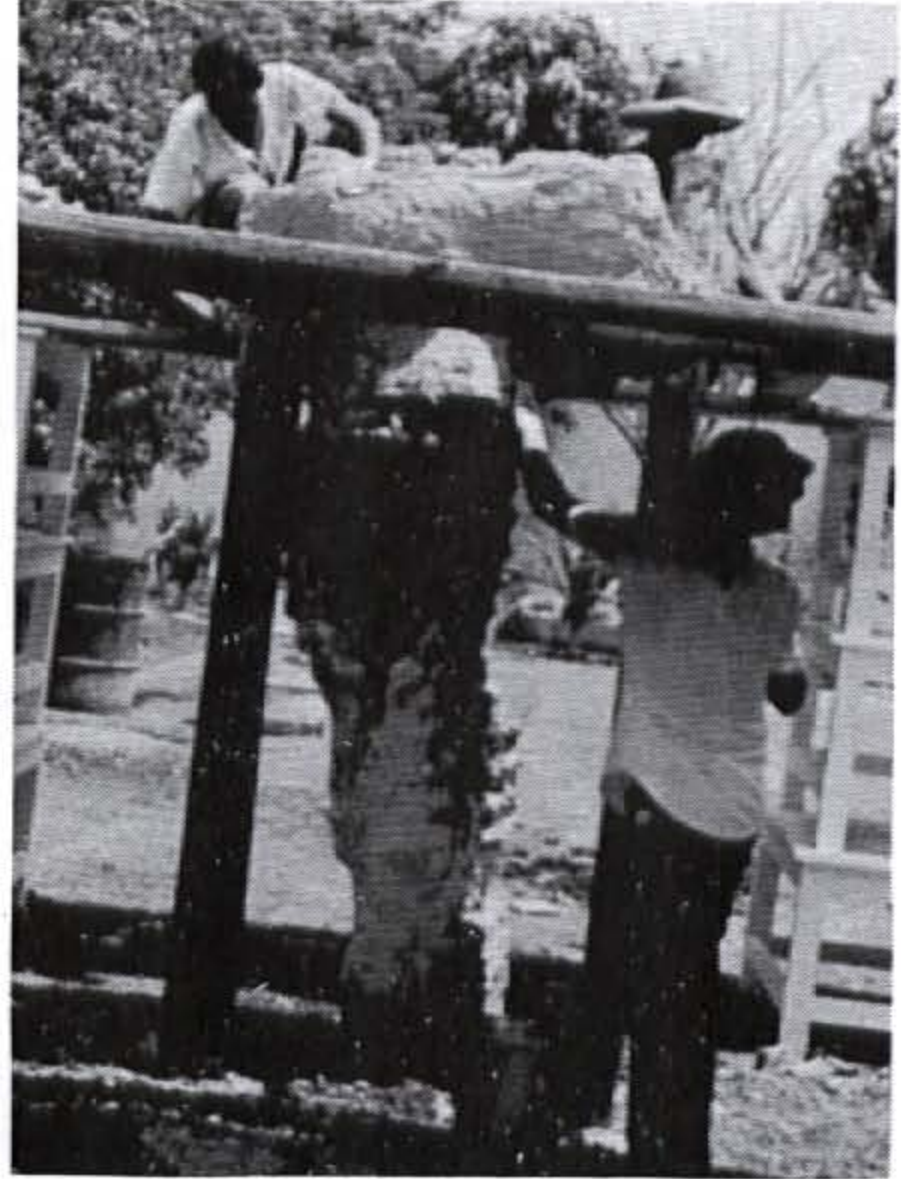
เจ้าหน้าตนาแบบพมพชนดง บนทหน้าปะรำพือ