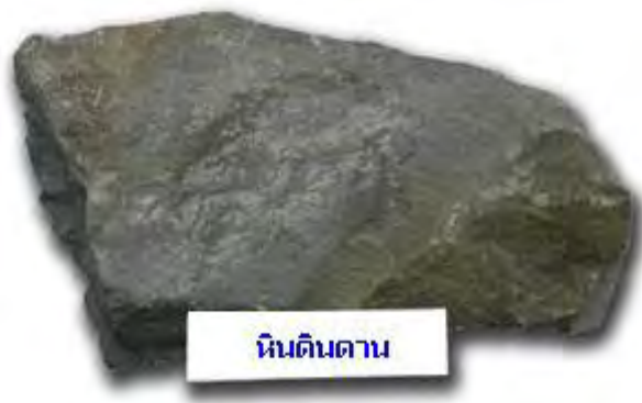
รูปที่ 2 หินดินดาน

ทั้งนี้ อาจกล่าวได้ว่า หินดินดานมีหน้าที่เป็นทั้งหินต้นกำเนิดปิโตรเลียม (Source Rocks) โดยเป็นหินตะกอนที่มีสารอินทรีย์สะสมอยู่มาก ซึ่งสามารถแปรสภาพไปเป็นปิโตรเลียม และเมื่อปิโตรเลียมเคลื่อนที่จากแหล่งกำเนิดไปยังหินกักเก็บ (Reservoir Rocks) แล้ว หินดินดานยังทำหน้าที่เป็นหินปิดกั้น (Seal) ที่ทับอยู่ด้านบนหินกักเก็บ เนื่องจากหินดินดานมีคุณลักษณะที่เป็นเนื้อละเอียด สภาพซึมได้น้อย ทำให้ปิโตรเลียมไม่สามารถไหลลัดลอดออกจากหินกักเก็บได้ (คณะกรรมการการพลังงาน สภาผู้แทนราษฎร, 2557, น. 3-4) สำหรับในส่วนของ shale oil คือ น้ำมันดิบที่พบในชั้นหินดินดาน ทั้งนี้ มีการเรียกขานโดยทั่วไปที่ใช้คำว่า shale oil กับ tight oil ในความหมายเดียวกัน แต่แท้ที่จริงแล้วมีความหมายต่างกัน โดย shale oil คือ tight oil ประเภทหนึ่งที่มีคุณสมบัติซึมซาบไหลผ่านช้า ซึ่งในวงการอุตสาหกรรมน้ำมันสหรัฐอเมริกา ใช้คำว่า tight oil เป็นหลักเพราะเป็นคำที่กินความครอบคลุมและถูกต้องมากกว่าเพราะ tight oil พบได้ในหลายแหล่งไม่เฉพาะในชั้นหินดินดานเท่านั้น (ชาญชัย คุ่มปัญญา, 2556)