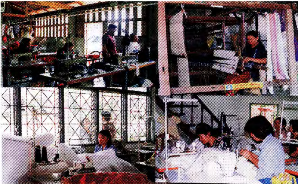
งานสงเคราะห์และจัดสวัสดิการสตรี กรมประชาสงเคราะห์ กระทรวงแรงงานและสวัสดิการสังคม