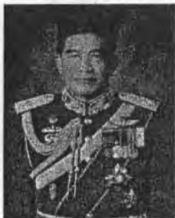
๓. พลเอก จิรเดช คชรัตน์