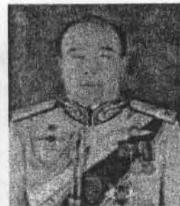
๘. พลเอก บุญยวัจน์ เครือหงส์