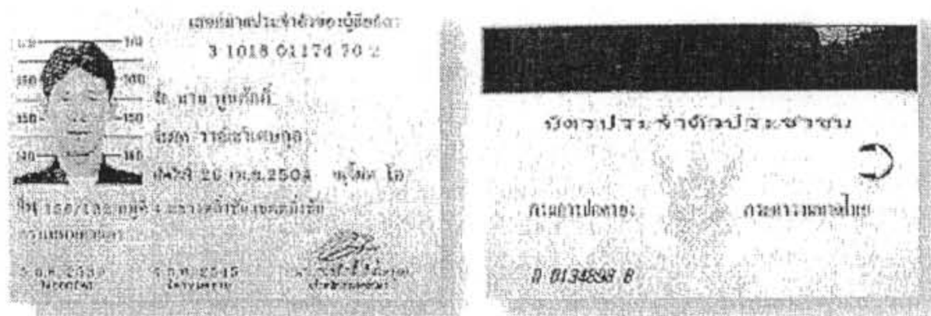
บัตรประจำตัวประชาชนรุ่นที่ 4 มีลักษณะเหมือนบัตรเคตติด

2. ด้านหน้าของบัตร มีรูปถ่ายเจ้าของบัตร พร้อมรายการเกี่ยวกับประวัติของเจ้าของบัตร ได้แก่ เลขประจำตัวประชาชน 13หลัก ชื่อตัว ชื่อสกุล วันเดือนปีเกิด ที่อยู่ตามทะเบียนบ้าน หมู่โลหิต วันที่ออกบัตร วันที่บัตรหมดอายุ และมีลายมือชื่อเจ้าพนักงานผู้ออกบัตร