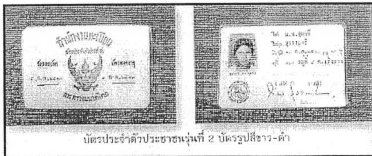
บัตรประจำตัวประชาชนรุ่นที่ 2 บัตรรูปสี่เหลี่ยมผืนผ้า

ลักษณะของบัตรรุ่นที่สองเป็นบัตรรูปสี่เหลี่ยมผืนผ้า ขนาดกว้าง 6 เซนติเมตร ยาว 9 เซนติเมตร ด้านหน้าเป็นรูปตราครุฑอยู่ตรงกลาง มีข้อความ "สำนักงานทะเบียนบัตรประจำตัวประชาชนกระทรวงมหาดไทย" วันที่ออกบัตรและวันบัตรหมดอายุด้านหลังจะเป็นรายการของผู้ถือบัตร ประกอบด้วย รูปถ่ายที่มีเส้นบอกส่วนสูงเป็นนิ้วฟุต ใต้รูปจะมีเลขและตัวอักษรแสดงถึงอำเภอที่ออกบัตรและเลขทะเบียนบัตรและตราประจำตำแหน่งเจ้าพนักงานออกบัตร ปากฎอยู่ทางด้านซ้าย ส่วนด้านขวาจะมีชื่อตัวชื่อสกุล วันเดือนปีเกิด อายุ ที่อยู่ และลายมือชื่อเจ้าพนักงานออกบัตร