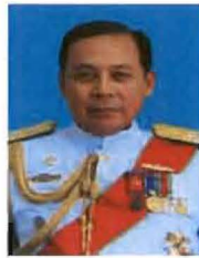
พลเรือเอก ศักดิ์สิทธิ์ เชิดบุญเมือง ที่ปรึกษาคณะกรรมาธิการ