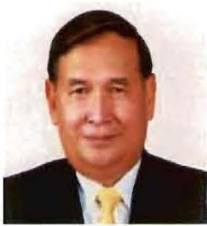
พลเอก ปฐมพงศ์ ประถมภักดิ์ ที่ปรึกษาคณะกรรมาธิการ