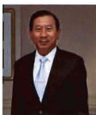
พลเอก ฉัตรชัย สาริกัลยะ ประธานคณะกรรมการ