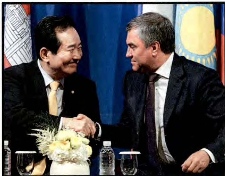
H.E. Mr. Chung Sye-kyun ประธานรัฐสภาสาธารณรัฐเกาหลี (คนซ้าย) และ H.E. Mr. Vyacheslav Viktorovich Volodin ประธานสภาดูมาสหพันธรัฐรัสเซีย (คนขวา) ขณะเข้าร่วมการประชุมประธานรัฐสภาของประเทศในภูมิภาคยูเรเชีย ครั้งที่ ๒

ที่ประชุม คือ การกล่าวสุนทรพจน์ โดยหัวหน้าคณะผู้แทนรัฐสภาที่มาเข้าร่วมการประชุม ภายใต้หัวข้อ “การส่งเสริมความร่วมมือระหว่างรัฐสภาเพื่อความเจริญรุ่งเรืองร่วมกันในภูมิภาคยูเรเชีย” ตามลำดับตำแหน่งและชื่อประเทศ ในภาษาอังกฤษของผู้กล่าว