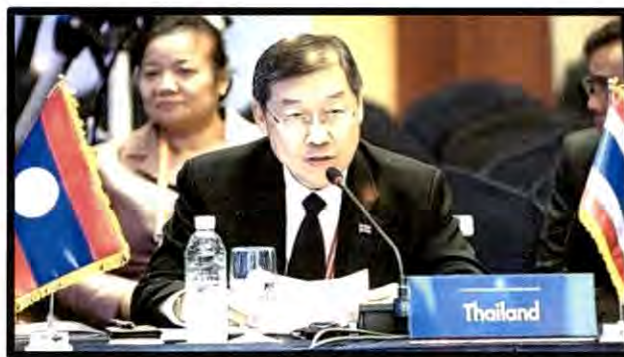
นายสุรชัย เลี้ยงบุญเลิศชัย หัวหน้าคณะผู้แทนสภานิติบัญญัติแห่งชาติ ขณะแสดงคำกล่าวต่อที่ประชุมประธานรัฐสภาของประเทศในภูมิภาคยูเรเชีย ครั้งที่ ๒

ในช่วงของการอภิปราย ที่ประชุมได้แสดงความยินดีที่รัฐสภาสาธารณรัฐเกาหลีจัดการประชุมประธานรัฐสภาของประเทศในภูมิภาคยูเรเชีย ครั้งที่ ๒ คำกล่าวของหัวหน้าคณะผู้แทนรัฐสภาที่มาเข้าร่วมประชุมครอบคลุมหลากหลายประเด็น อย่างไรก็ตาม ประเด็นที่หัวหน้าคณะผู้แทนรัฐสภาส่วนใหญ่ระบุถึงมี ๒ ประการ ประการแรก คือ เรื่องภัยคุกคามความมั่นคงนอกกรอบแบบ (Non-Traditional Security Threat) อาทิ การก่อการร้าย ลัทธิสุดโต่ง อาชญากรรมข้ามชาติ และการเปลี่ยนแปลงสภาพภูมิอากาศ หัวหน้าคณะผู้แทนรัฐสภาที่มาเข้าร่วมประชุมเห็นตรงกันว่า การทูตรัฐสภา (Parliamentary Diplomacy) ตลอดจนการสร้างความร่วมมือที่ใกล้ชิดกันมากยิ่งขึ้นระหว่างกลไกต่าง ๆ ของรัฐสภาในภูมิภาคยูเรเชียสามารถบรรเทาปัญหาลักษณะดังกล่าวได้ และอีกประการหนึ่ง คือ เรื่องการยกระดับความเชื่อมโยงภายในภูมิภาคยูเรเชีย หัวหน้าคณะผู้แทนรัฐสภาต่างเห็นตรงกันว่าความเชื่อมโยงเป็นปัจจัยสำคัญสู่ความสำเร็จร่วมกันของภูมิภาค ในการนี้ แม้คำกล่าวของหัวหน้าคณะผู้แทนรัฐสภาแต่ละคณะจะมีจุดเน้นเกี่ยวกับเรื่องดังกล่าวที่แตกต่างกัน แต่โดยทั่วไป มีการอ้างถึงความเชื่อมโยงในทุกแง่มุม กล่าวคือ ทั้งในแง่กายภาพ ในแง่สถาบัน และในแง่ระหว่างประชาชน