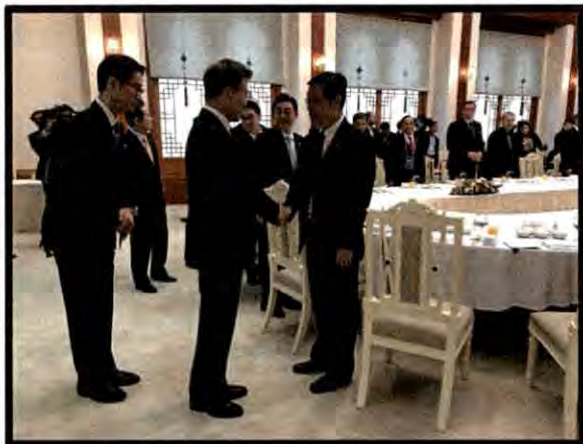
นายสุรชัย เลี้ยงบุญเลิศชัย หัวหน้าคณะผู้แทนสภานิติบัญญัติแห่งชาติ (คนที่สามจากซ้าย) ขณะกล่าวทักทาย H.E. Mr. Moon Jae-in ประธานาธิบดีสาธารณรัฐเกาหลี (คนที่สองจากซ้าย)