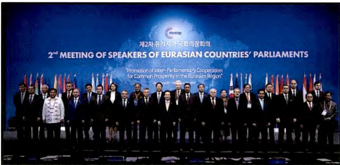
หัวหน้าคณะผู้แทนรัฐสภาที่มาเข้าร่วมการประชุมประธานรัฐสภาของประเทศในภูมิภาคยูเรเชีย ครั้งที่ ๒ ถ่ายภาพร่วมกัน