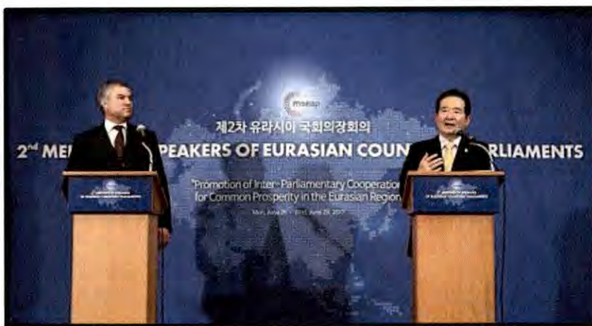
ประธานสภาผู้แทนราษฎรไทย (คนซ้าย) และประธานรัฐสภาสาธารณรัฐเกออร์เจีย (คนขวา) ในงานแถลงข่าวร่วม (Joint Press Conference) ภายหลังจากเสร็จสิ้นการประชุมประธานรัฐสภาของประเทศในภูมิภาคยูเรเชีย ครั้งที่ ๒

ในช่วงท้ายของการประชุม ที่ประชุมได้รับรองร่างสุดท้ายของแถลงการณ์โซล ๗ ตามที่เสนอโดย คณะกรรมการยกร่างแถลงการณ์ร่วม ประเด็นสำคัญที่ระบุในร่างแถลงการณ์ดังกล่าว ได้แก่ (๑) ความพยายามในการเสริมสร้างความร่วมมือและเพิ่มบทบาทของภาครัฐสภาในการเกื้อหนุนความเจริญรุ่งเรืองร่วมกันภายในภูมิภาคยูเรเชียและภูมิภาคอื่น ๆ (๒) เหตุผลที่ควรเน้นย้ำให้รัฐสภาของประเทศในภูมิภาคยูเรเชียมีการสานเสวนาระหว่างกัน รวมทั้งการอ้างถึงวาระการพัฒนาที่ยั่งยืน ค.ศ. ๒๐๓๐ และเป้าหมายการพัฒนาที่ยั่งยืน จำนวน ๑๗ ประการของสหประชาชาติ (๓) สาขาที่ควรส่งเสริมความร่วมมือเชิงนิติบัญญัติและสถาบันร่วมกัน ซึ่งรวมถึงด้านความเชื่อมโยง (๔) การตระหนักถึงความสำคัญของความร่วมมือ การรวมกลุ่ม และข้อตกลงทางเศรษฐกิจระดับภูมิภาค รวมทั้งความสอดประสานท่ามกลางความหลากหลายภายใต้เงื่อนไขดังกล่าว และ (๕) การตระหนักถึงความจำเป็นของรัฐสภาในการตอบสนองต่อความท้าทายต่าง ๆ ร่วมกัน เช่น การก่อการร้าย การค้ายาเสพติด อาชญากรรมข้ามชาติ ความเสื่อมโทรมของสิ่งแวดล้อม และความยากจน