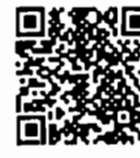
เอกสารประกอบการ พิจารณา สำนักวิชาการ