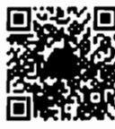
กระทู้ถามสด ด้วยวาจา