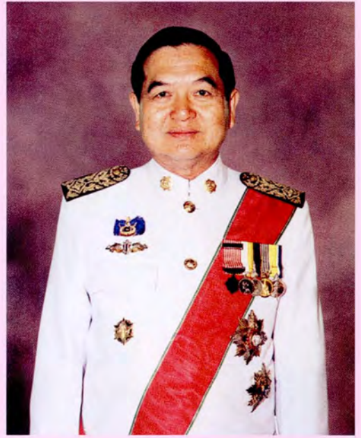
นายสกล เพชรสว่าง รองประธานสภาผู้แทนราษฎร คนที่ 1