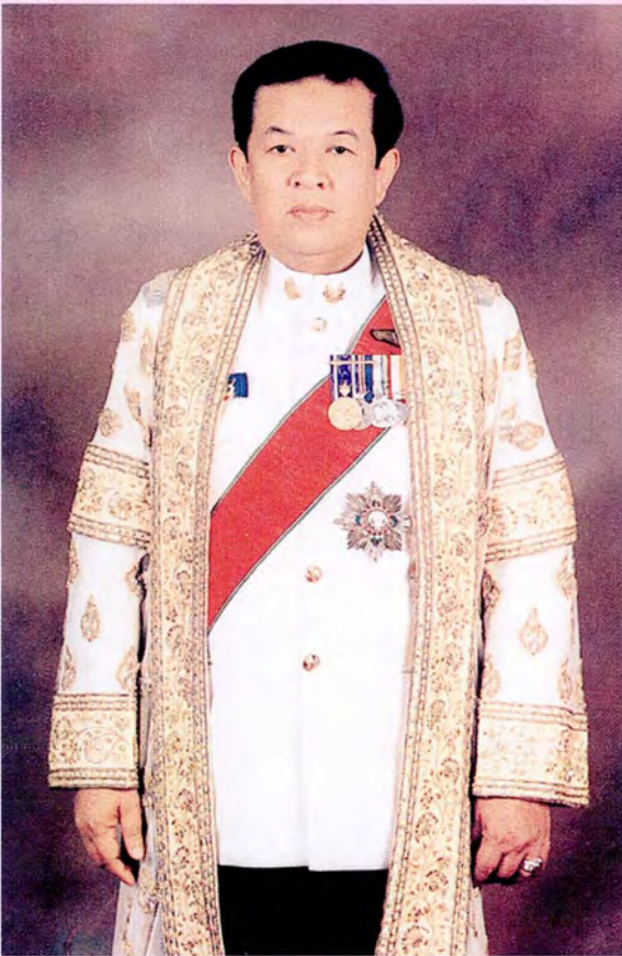
นายวันมูหะมัดนอร์ มะทา ประธานรัฐสภา ประธานสภาผู้แทนราษฎร