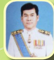
นายนิพนธ์ เปรมกมล หัวหน้าสำนักงานรัฐสภา