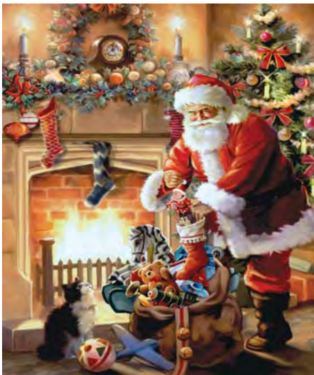
ที่มา : ซานตาคลอสจะมาใส่ของขวัญในถุงเท้าเด็กๆที่แขวนไว้หน้าเตาผิง สืบค้นวันที่ 27 พฤศจิกายน 2560 จาก https://www.puzzlewarehouse.com/Holiday-Traditions-A-Visit-from-Santa-Claus-2366-19cea.html