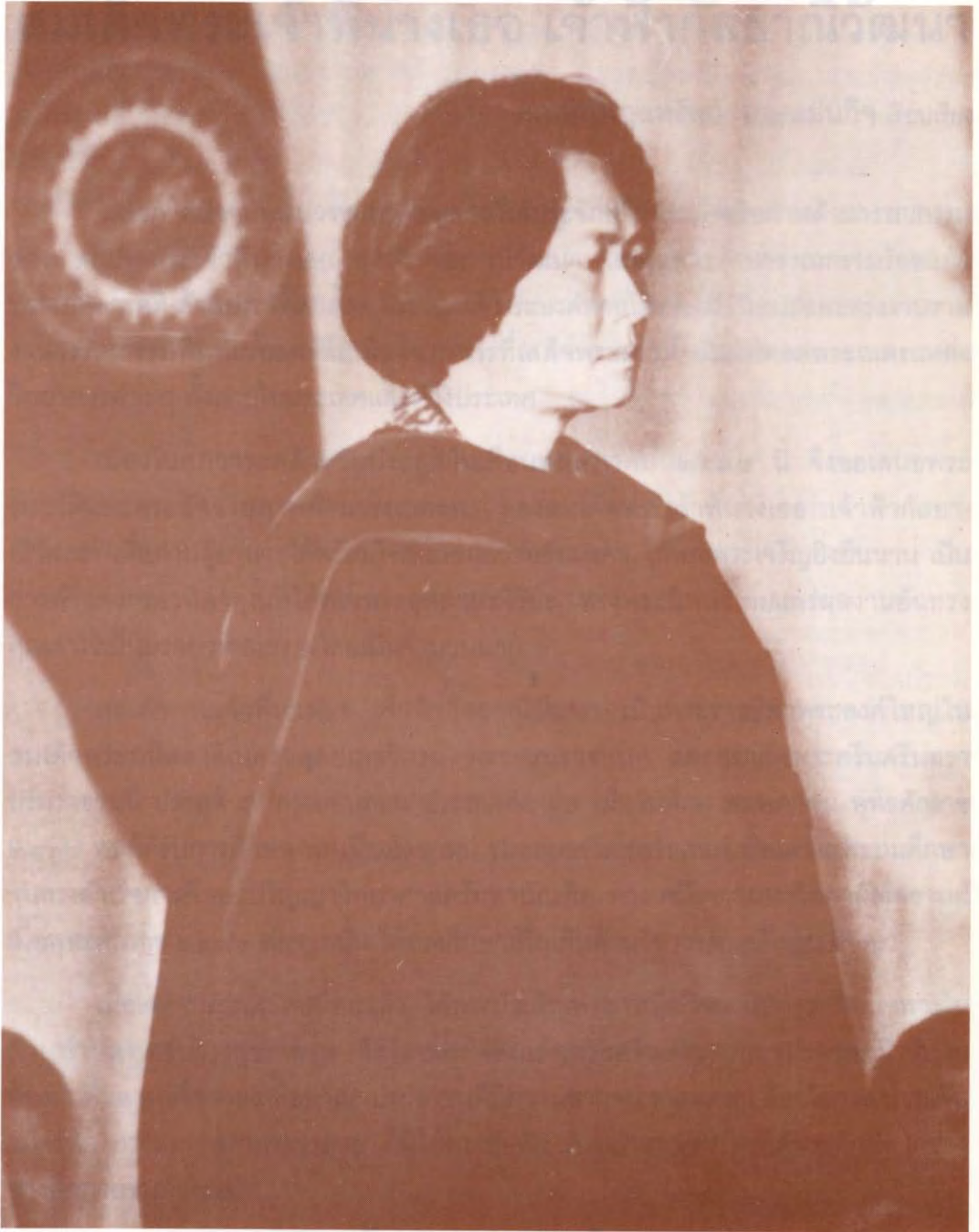
สมเด็จพระเจ้าพี่นางเธอ เจ้าฟ้ากัลยาณิวัฒนา