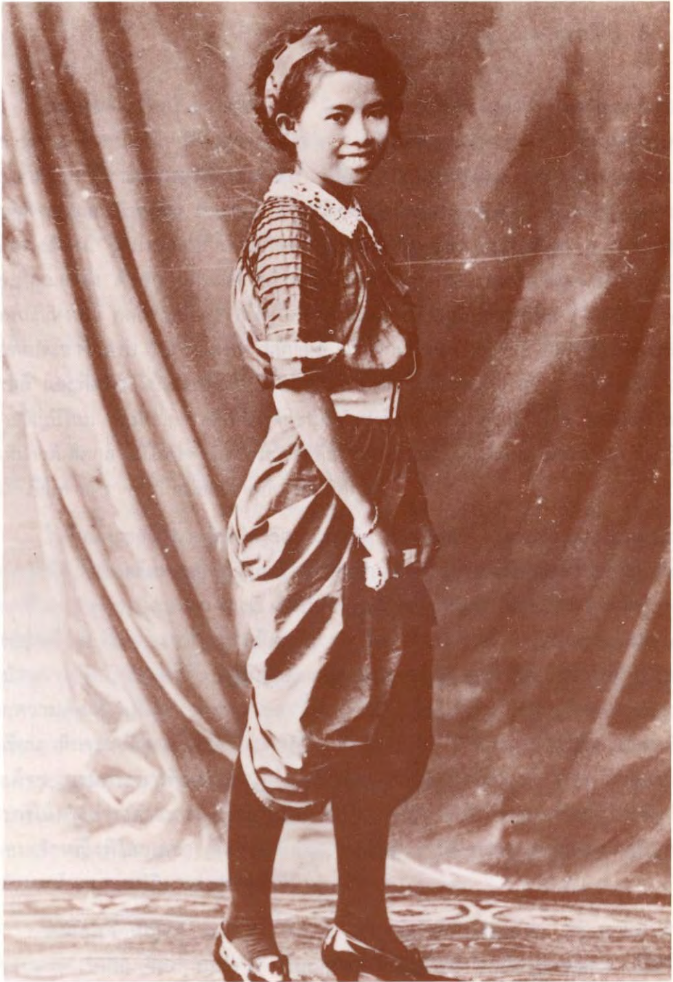
หม่อมเจ้าหญิงพิไลยเลขา ดิศกุล