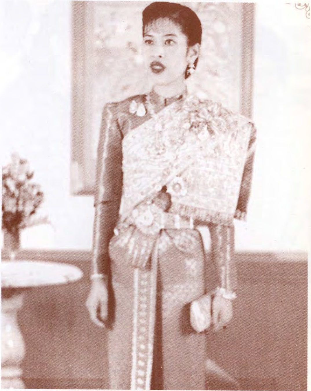
ศาสตราจารย์ ดร. สมเด็จพระเจ้าลูกเธอเจ้าฟ้าจุฬาภรณวลัยลักษณ์