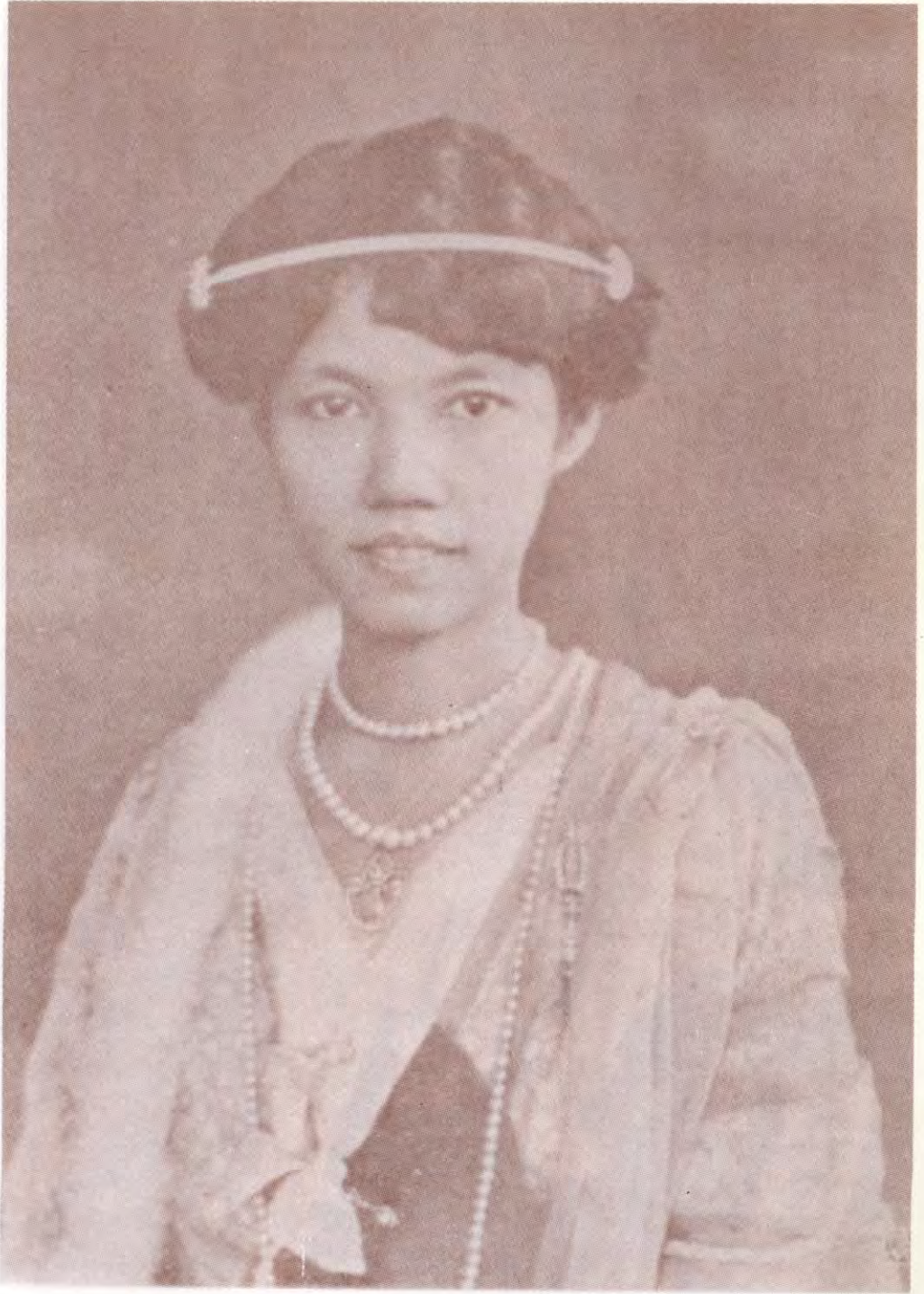
สมเด็จพระปิตุจฉาเจ้าฟ้าวิไลยอลงกรณ์ กรมหลวงเพชรบุรีราชสิรินธร