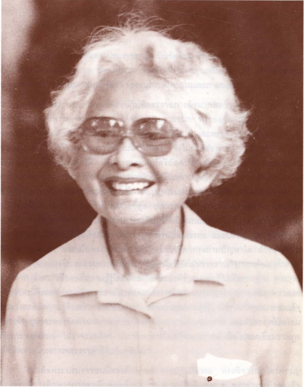
พระบาทสมเด็จพระบรมชนกาธิเบศร มหาภูมิพลอดุลยเดชมหาราช บรมนาถบพิตร ทรงเสด็จพระราชดำเนินไปทอดพระเนตรที่โรงเรียนสตรีศรีนครินทร์ กรุงเทพมหานคร เมื่อวันที่ ๑๕ ตุลาคม ๒๕๐๑ สมเด็จพระศรีนครินทราบรมราชชนนี กับประชาธิปไตย