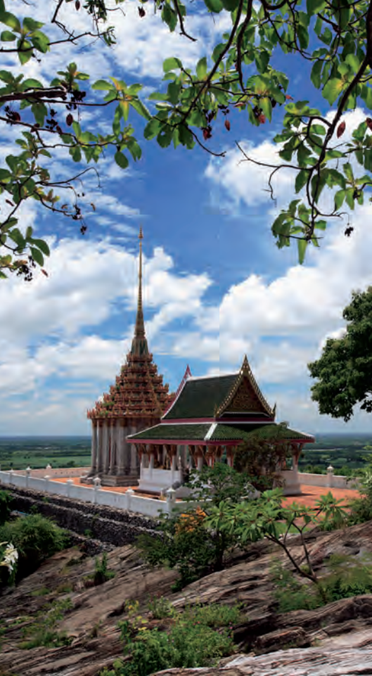
วัดเขาดีสลัก

พระราชดำเนนทรงทำพิธีเปิดเมื่อปี พ.ศ.๒๕๔๒ สิ่งที่น่าสนใจภายในวัด ได้แก่ รอยพระพุทธบาทจำลองสลักบนแผ่นหินทรายสีแดงรูปสี่เหลี่ยมผืนผ้า สลักเป็นรูปปูนดำลายกลีบบัวโดยรอบพระบาทปลายนิ้วพระบาทยาวไม่เสมอกัน ขอนี้วพระบาทมี ๒ ข้อ โดยข้อนิ้วพระบาทข้อแรกทำลายขมวดเป็นรูปก้นหอยตามคัมภีร์มหาบุรุษลักษณะ หรือมหาบุรุษลักษณะ ดังที่พรรณนาไว้ในปฐมสมโพธิกถาฉบับภาษาบาลี รวมทั้งในคัมภีร์ลิลิตวิสูตรฉบับภาษาไทย สันสกฤต ขอนี้วที่ ๒ เป็นลายก้นชด หรือไปไม้มัน