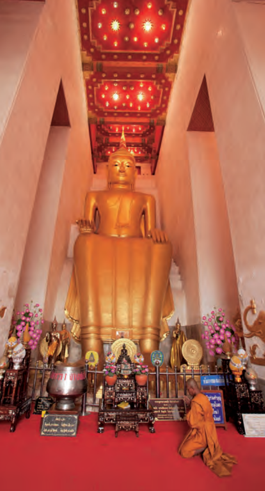
วัดป่าเลไลยก์วิหาร

เทศกาลสมโภชและนมัสการหลวงพ่อดโตวัดป่าเลไลยก์ ปีละ ๒ ครั้ง คือในวันขึ้น ๗-๙ ค่ำ เดือน ๕ และเดือน ๑๒