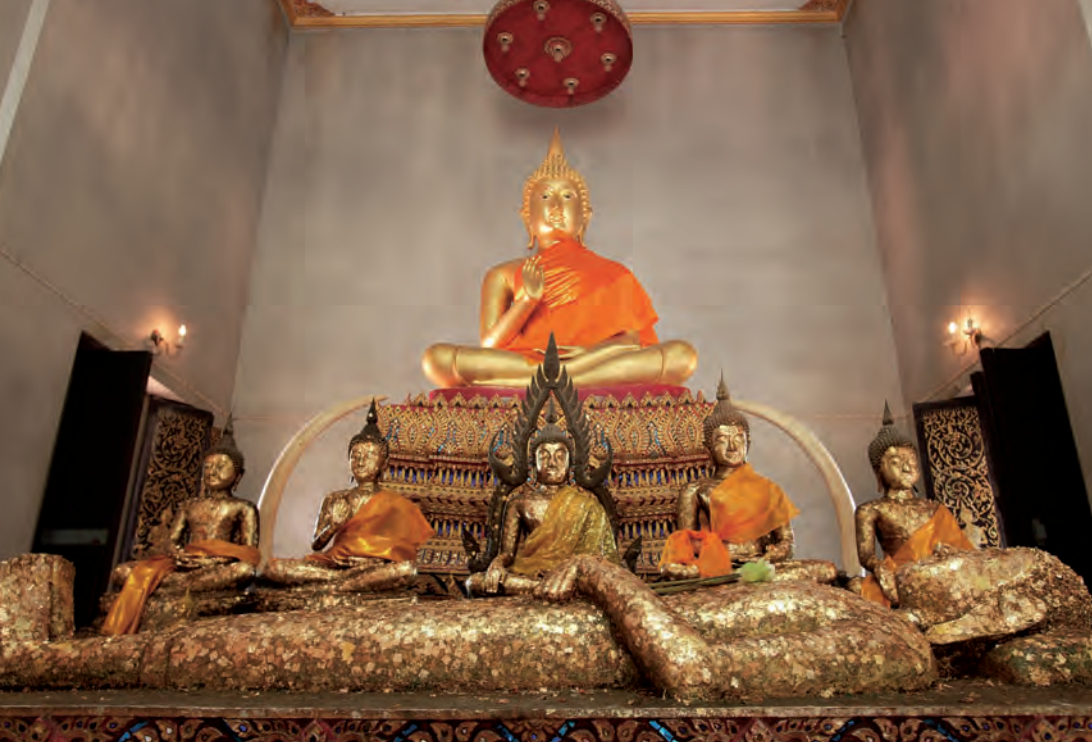
วัดพระนอน

ที่ขึ้นชื่อแห่งหนึ่งของจังหวัด มีวิหารประดิษฐานพระพุทธรูปปางไสยาสน์ สลักจากหิน มีลักษณะแปลกกว่าที่อื่น คือเป็นพระพุทธรูปอยู่ในลักษณะนอนหงาย ขนาดเท่าคนโบราณ ความยาวประมาณ ๒ เมตร เป็นแหล่งท่องเที่ยวหนึ่งใน Unseen Thailand