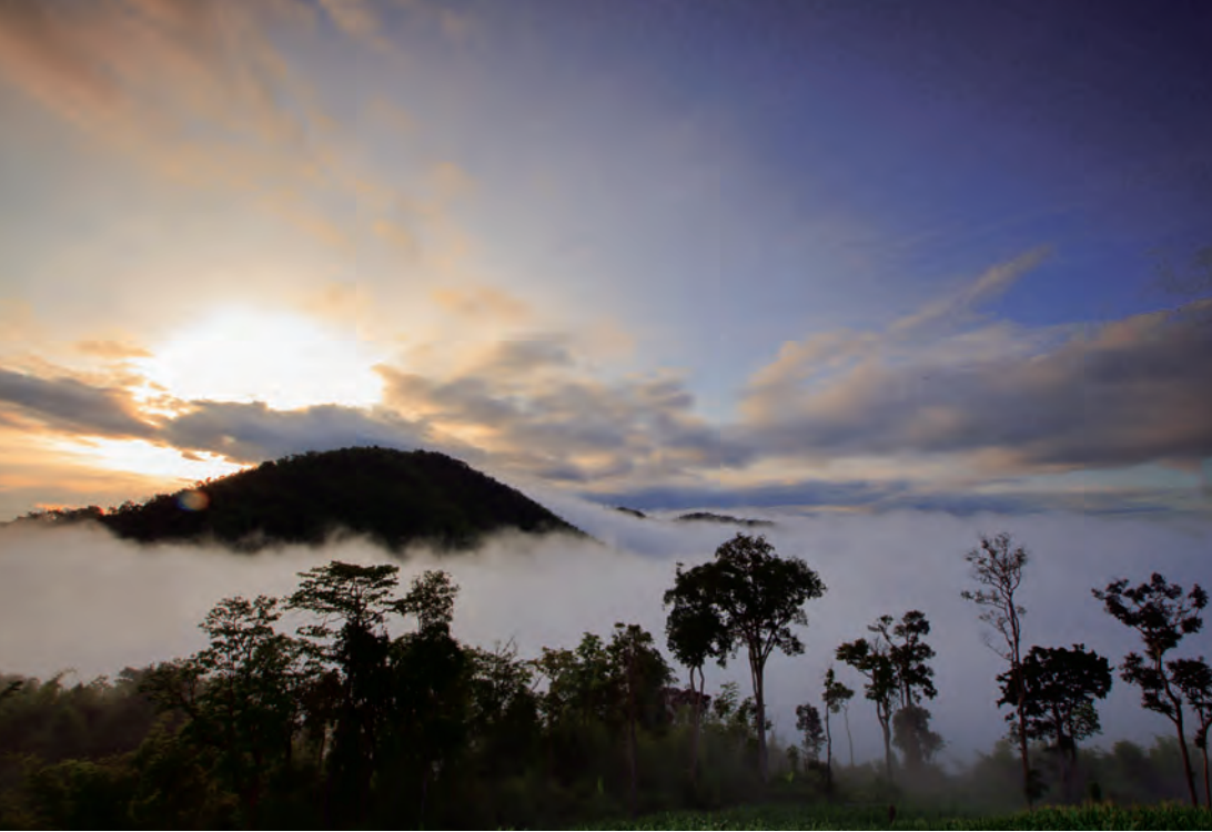
พระอาทิตย์ขึ้นที่ยอดเขาเทวดา

บ้านห้วยหินดำ อยู่ตำบลวังยาว จากที่ทำการอุทยาน ๖ กิโลเมตร เลี้ยวขวาไปประมาณ ๓ กิโลเมตร เป็นหมู่บ้านกลุ่มชาวกะเหรี่ยง ซึ่งมีอัตลักษณ์โดดเด่นเรื่องผ้าฝ้ายทอมือย้อมสีธรรมชาติจากพรรณไม้ ของ กลุ่มแม่บ้านห้วยหินดำ ผ้าฝ้ายลวดลายสวยงาม เช่น ลายจก ลายยก ลายพื้น สีสันทวลตาเป็นธรรมชาติ นอกจากนี้ มีการปลูกพืชเกษตรอินทรีย์ โดยใช้สมุนไพรป้องกันศัตรูพืช นักท่องเที่ยวสามารถชื่นชมวิถีชีวิต วัฒนธรรม ประเพณี ของชุมชนชาวกะเหรี่ยงผ่านการบอกเล่าและจากบทเพลงของชุมชนแห่งนี้ สอบถามข้อมูลได้ที่ องค์การบริหารส่วนตำบลวังยาว โทร. ๐ ๓๕๔๔ ๖๒๖๓, ๐๘ ๑๑๙๔ ๔๘๔๗