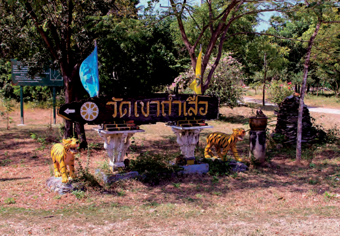
วัดเขาค้อเสือ

คอกช้างดินสมัยทวารวดี อยู่ห่างจากที่ทำการวนอุทยาน อายุราว ๑,๕๐๐ ปี จำนวน ๓ คอก มีเนื้อที่ประมาณ ๑๐ ไร่