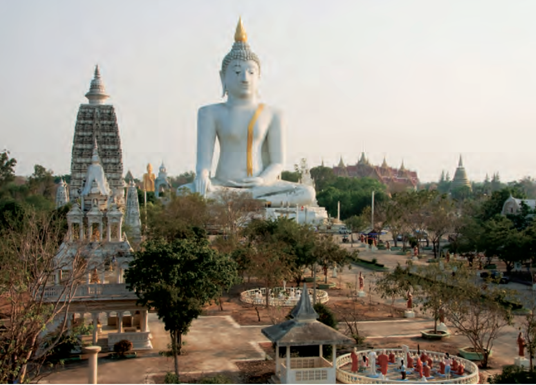
วัดโพนโรงว็ว

ท่องเที่ยวทางน้ำแม่น้ำท่าจีน ส่วนคำว่า “สองฤดู” ชาวสองพี่น้องหมายถึงหน้าแล้ง และหน้าน้ำ ซึ่งเป็นวิถีชีวิตดั้งเดิมในอดีต ในปีหนึ่งมีน้ำท่วมประมาณ ๕-๖ เดือน ในหน้าน้ำท่วม ร้านค้าในตลาดต้องย้ายขึ้นไปค้าขายบนชั้น ๒ สำหรับปัจจุบันพื้นที่แห่งนี้เทศบาลเมืองสองพี่น้องได้มีการถมให้สูงขึ้นจากพื้นดินเดิม ประมาณ ๒ เมตร จึงทำให้น้ำไม่ท่วม และในช่วงเดือนกุมภาพันธ์มีการจัดงานเทศกาลอาหารเป็นประจำทุกปี ซึ่งได้รับความนิยมจากนักท่องเที่ยวอย่างมาก สอบถามข้อมูลได้ที่ สำนักงานเทศบาลเมืองสองพี่น้อง โทร. ๐ ๓๕๕๓ ๑๐๑๒ ต่อ ๑๑๓