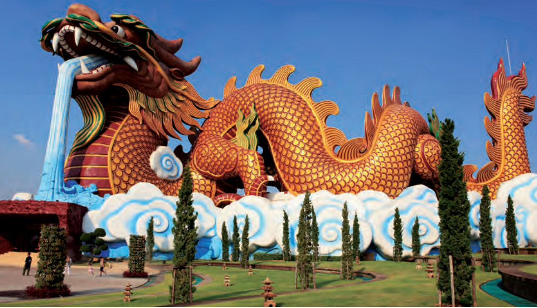
อุทยานมังกรสวรรค์

เจ้าพ่อหลักเมือง กำแพงทางด้านทิศตะวันตกของเมืองทำแข็งแรงเป็นพิเศษสองชั้น มีคูน้ำกั้นอยู่ชั้นนอกมีเนินดิน และกำแพงอยู่ชั้นในยาวถึง ๓,๕๐๐ เมตร ส่วนด้านกว้างกำแพงยาว ๑,๐๐๐ เมตร จดแม่น้ำด้านตะวันออกไม่พบตัวกำแพง เพราะถูกรื้อในสมัยสมเด็จพระมหาจักรพรรดิ สมัยพระบาทสมเด็จพระจุลจอมเกล้าเจ้าอยู่หัว รัชกาลที่ ๕ ในพระราชหัตถเลขาเรื่อง “เสด็จประพาสลำน้ำมะขามเต่า” บรรยายสภาพกำแพงเมืองสุพรรณบุรีว่า “เมืองสุพรรณบุรีมีกำแพงเป็นสองฟากเหมือนเมืองพิษณุโลก ยื่นขึ้นไปจากฝั่งแม่น้ำราว ๒๕ เส้น ดูกว้างประมาณ ๖ วา นอกเชิงเทิน” ส่วนประตูเมืองตั้งอยู่ริมถนนมาลัยแมนบนแนวกำแพงเมืองเก่า ประตูเมืองที่เห็นในปัจจุบันสร้างขึ้นใหม่ตามแบบกรมศิลปากร บริเวณสถานที่ซึ่งสันนิษฐานว่าเป็นที่ตั้งของประตูเมืองเดิม