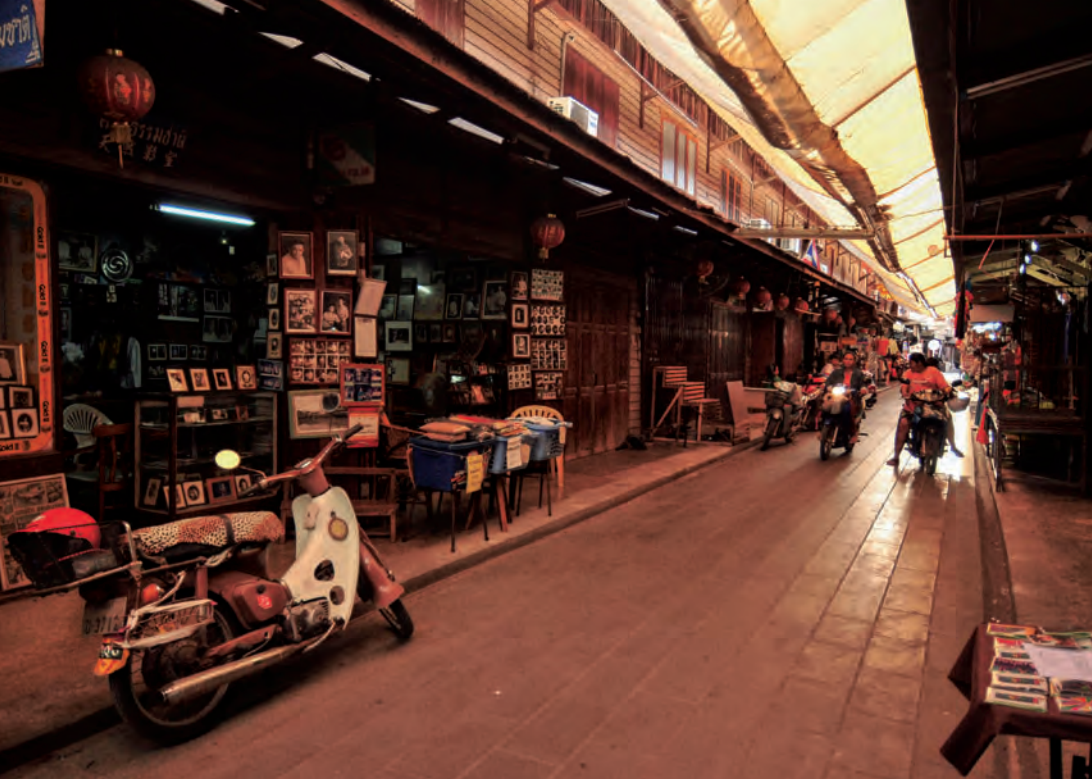
ตลาดร้อยปีสามชุก

เจ้าพ่อหลักเมืองสามชุก พิพิธภัณฑสถานจันทน์รักษ์ ร้านกาแพทำเรือสง “บุญช่วยหัตถกิจ” ร้านนาฬิกาโบราณ ซอย ๑ “ร้านรัชพร” ขายนานาฬิกาโบราณ ร้านศรีพุทธทอง โรงแรมอุดมโชค ร้านถ่ายภาพศิลปะธรรมชาติ ร้านนายไผ่ (คู่แข่งฮวด) ร้านโชคชัย บ้านลิ้มเด็กเซ็ง ร้านขายทองมีชัย ร้านทำเคียวตรา ร้านขายยาสวัสดิโฮสธ ร้านขายของชำบ้านา ร้านขายยาฮกอันโฮสธ ร้านไพศาลสมบัติ ของใช้และของสะสมสมัยคุณพ่อ ฮกจวันตั้ง และ ร้านโชคนิมิต ฯลฯ นอกจากนี้ ตลาดร้อยปีสามชุก ได้รับรางวัลดีเด่นโครงการอนุรักษ์มรดกทางวัฒนธรรม ในภูมิภาคเอเชียและแปซิฟิก ประจำปี ๒๕๕๒ จาก องค์การศึกษาศาสตร์และวัฒนธรรมแห่งสหประชาชาติ (ยูเนสโก) โดยได้ยกย่องการอนุรักษ์ชุมชนย่านตลาดเก่าสามชุกว่า “โครงการอนุรักษ์ชุมชนย่านตลาดเก่า