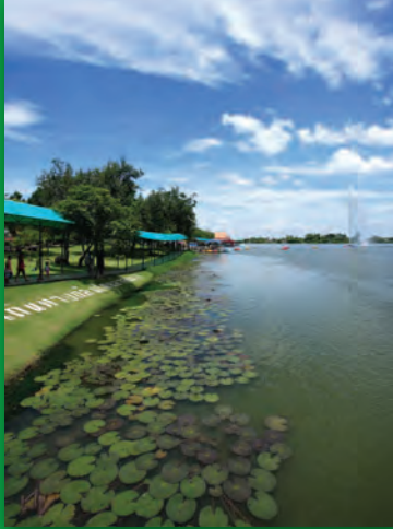
บึงฉวากเฉลิมพระเกียรติ