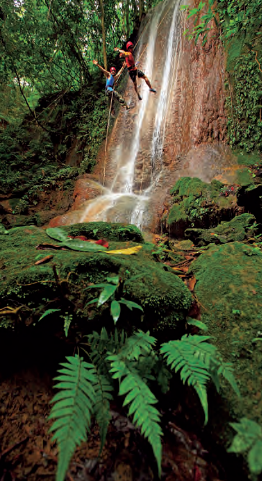
น้ำตกตะเพินคี่น้อย

หมู่บ้านกะเหรี่ยงตะเพินคี่เป็นกะเหรี่ยงด้ายเหลือง นับถือศาสนาพุทธ ในวันขึ้น ๑๕ ค่ำ เดือน ๕ ของทุกปี ตลอด ๓ วัน ๓ คืน จะมีงานพิธีไหว้จุฬามณี ซึ่งจำลองเจดีย์จุฬามณีบนสวรรค์ โดยนำไม้ไผ่เหลาแหลมสานเป็นชั้น ๓ ชั้น ลักษณะคล้ายฉัตร เรียกว่า “สะเตอร์” พร้อมดอกไม้ประดับ นำมาปักไว้ที่ลานหมู่บ้าน ยามค่ำจะนำน้ำมัน น้ำดอกไม้เทียน เหน่รอบเจดีย์จุฬามณี ขณะทำพิธีนำด้ายสีเหลืองใส่ในเจดีย์จุฬามณี เมื่อถึงเวลาเช้าจะแจกด้ายนี้แก่ลูกหลานและญาติ