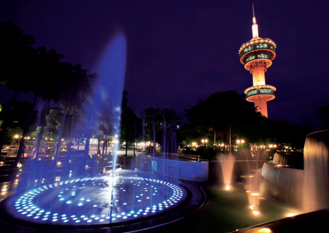
พิพิธภัณฑ์วัดหนึ่งใหญ่ วัดสว่างอารมณ์

บริษัทขนส่งสุพรรณบุรี โทร. ๐ ๓๕๕๒ ๒๓๗๓ รถออกจากกรุงเทพฯ เทียวแรก ๐๖.๐๐ น. เทียวสุดท้าย ๑๗.๐๐ น. ออกจากสุพรรณบุรี เทียวแรก ๐๔.๕๐ น. เทียวสุดท้าย ๑๗.๐๐ น. หรือ www.transport.co.th