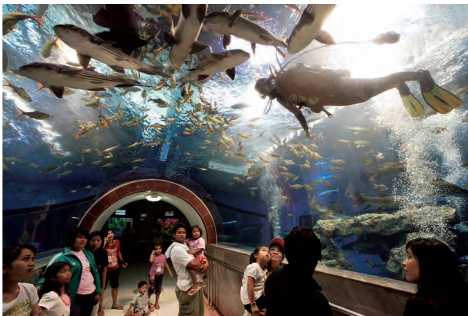
สถานแสดงพันธุ์สัตว์น้ำปึงฉวาก

ตู้แนวปะการัง (Coral reef) ฝูงปลาขนาดใหญ่ชนิดต่าง ๆ เช่น ปลาปักเป้า ปลาผีเสื้อลายตรง ปลาผีเสื้อเหลือง ปลาบลูแท็งก์ ฯลฯ ตกแต่งด้วยปะการังเทียม