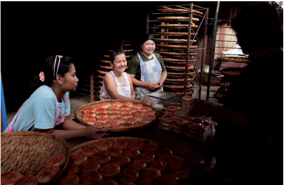
ตลาดเก้าห้อง

ตลาดเก้าห้อง อยู่หมู่ที่ ๒ เทศบาลตำบลบางปลาม้า เป็นตลาดเก่าแก่ซึ่งเป็นย่านการค้าที่รุ่งเรืองริมแม่น้ำสุพรรณบุรี หรือแม่น้ำท่าจีนเมื่อเกือบหนึ่งร้อยปีมาแล้ว ตลาดเก้าห้องเป็นตลาดริมน้ำไทย-จีนแบบดั้งเดิม สามารถสัมผัสบรรยากาศสภาพบ้านเรือนไม้เก่า วิถีชีวิตแบบเรียบง่าย การค้าขายสินค้าท้องถิ่น โรงงานขนมเปี๊ยะ ขนมจันอับ กะหรี่ปั๊ป ขนมกล้วยฟู ข้าวเกรียบว่าว โรงพิมพ์ ร้านขายของเก่าโบราณ และ หอดูดาว เป็นหอก่ออิฐถือปูนกว้าง ๓ x ๓ เมตร สูงราวตึก ๔ ชั้น สร้างเมื่อปี พ.ศ. ๒๔๗๗ เพื่อใช้เป็นที่เฝ้ายามระวังโจรที่จะเข้ามาปล้นตลาด โดยแต่ละชั้นฝาผนังเจาะรูโดยขนาดเส้นผ่าศูนย์กลาง ๓ นิ้ว ชั้นบน