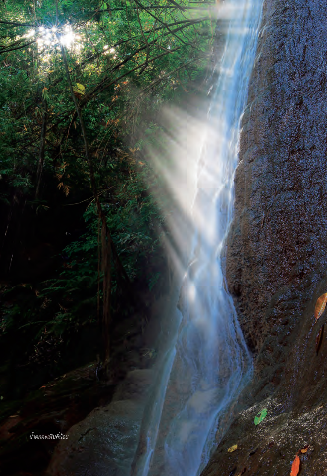
น้ำตกตะเพินคี่น้อย