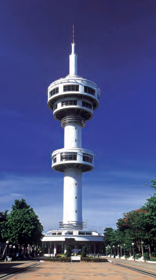
ภายในหอคอยบรรหาร-แจ่มใส

และออกกำลังกายในสวนตอนเย็น ๆ เวลาากลางคืน หอคอยเปิดไฟเป็นจุดเด่นของเมืองสุพรรณบุรี