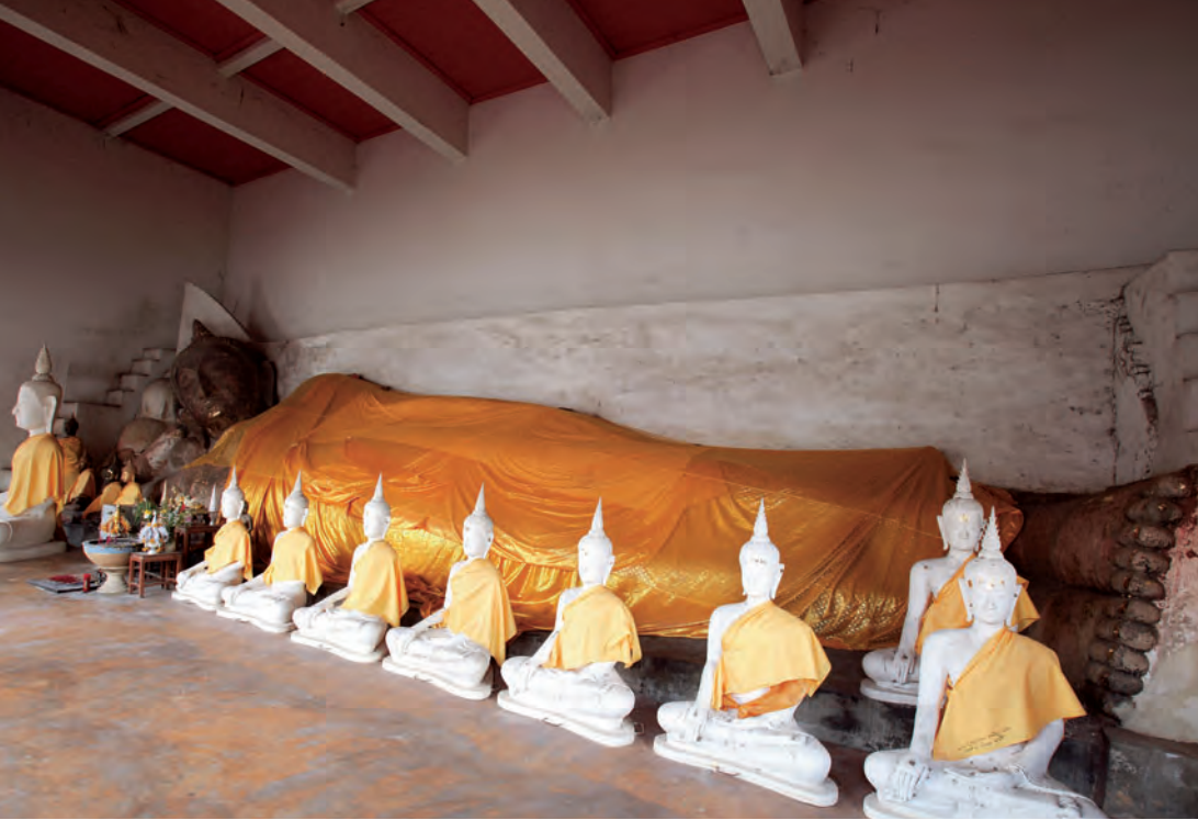
วัดพระรูป

นี้ไว้เกือบกึ่งกลางเมืองเพื่อให้เป็นศูนย์กลางของเมือง พร้อมกับการปรับสร้างแผนผังเมืองใหม่ วัดแห่งนี้จึงมีฐานะเป็นมหาธาตุกลางเมือง หรือมหาธาตุประจำเมืองสุพรรณบุรี อันถือเป็นศูนย์กลางของเมืองโบราณสุพรรณบุรีในอดีต โดยปรารภองค์ประธานประดิษฐานพระบรมสารีริกธาตุ องค์ปรารภเป็นศิลปะการก่อสร้างสมัยอุทงสุพรรณภูมิ เพราะจากหลักฐานการก่อสร้างเป็นการก่ออิฐไม่ถือปูน ซึ่งเป็นวิธีการเก่าแก่ก่อนสมัยอยุธยา