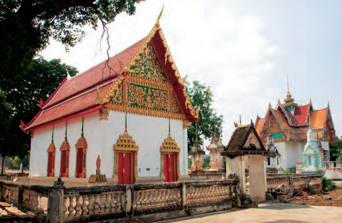
วัดหัวเขา

สถานแสดงพันธุ์สัตว์น้ำ บึงฉวากเฉลิมพระเกียรติ ก่อสร้างขึ้นภายใต้โครงการพัฒนาบึงฉวากเฉลิมพระเกียรติ เพื่อเกิดพระเกียรติพระบาทสมเด็จพระเจ้าอยู่หัวภูมิพลอดุลยเดช รัชกาลที่ ๙ เนื่องในโอกาสทรงครองราชย์เป็นปีที่ ๕๐ ดำเนินการก่อสร้างเมื่อวันที่ ๑๙ กรกฎาคม ๒๕๓๙ และเปิดให้ประชาชนเข้าชมเมื่อเดือนกุมภาพันธ์ ๒๕๔๑