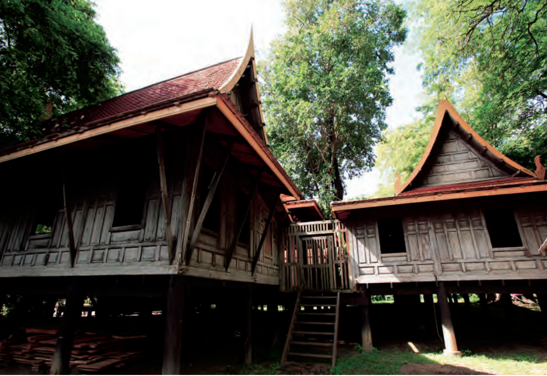
คุ้มขุนแผน วัดแค

พระบาทสมเด็จพระจุลจอมเกล้าเจ้าอยู่หัวทรงถวาย เมื่อปี พ.ศ. ๒๔๑๒