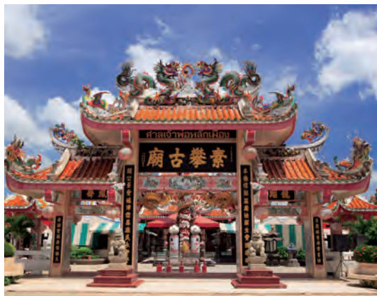
ศาลเจ้าพ่อหลักเมือง

ศาลเจ้าพ่อหลักเมือง และอุทยานมังกรสวรรค์ อยู่ฝั่งตะวันตกของแม่น้ำสุพรรณบุรี (แม่น้ำท่าจีน) ห่างจากฝั่งแม่น้ำไปตามถนนมาลัยแมน เดิมเป็นศาลไม้ทรงไทย มีเทวรูปพระอิศวร และพระนารายณ์สวมหมวกเด็ก (หมวกทรงกระบอก) สลักด้วยหินสีเขียว ปัจจุบันได้สร้างศาลเป็นรูปวิหารและเก๋งจีน เจ้าพ่อหลักเมืองนี้เป็นประติมากรรมสลักบนแผ่นหินแบบนูนต่ำในพุทธศาสนาลัทธิมหายาน แบบศิลปะเขมร อายุราวปี พ.ศ. ๑๘๘๕-๑๒๕๐ หรือประมาณ