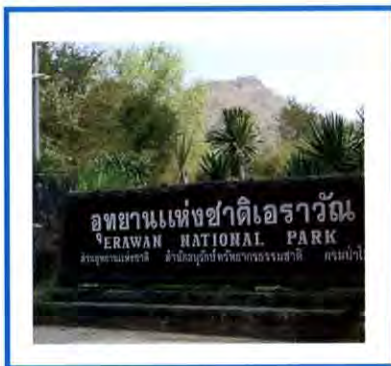
การเรียนรู้นอกสถานที่

แนวคิด และปรัชญาการศึกษาสมัยใหม่เน้นผู้เรียนเป็นศูนย์กลางการเรียนรู้ และต้องการให้เด็กเป็นคนดี คนเก่ง และมีความสุข นั่นคือ การพัฒนาร่างกาย จิตใจ สติปัญญา อารมณ์ และสังคมอย่างสมดุลกัน เพราะฉะนั้นความจำเป็นที่ต้องใช้กิจกรรมอย่างมากมายและครอบคลุมความต้องการทุกด้านจึงเป็นสิ่งจำเป็นอย่างยิ่ง การเรียนรู้ในห้องเรียนจึงไม่เพียงพอและมีแนวโน้มจะลดความสำคัญลงไป การเรียนรู้นอกสถานที่ที่จะเพิ่มความสำคัญมากขึ้น ศูนย์การเรียนรู้อาจอยู่ที่พิพิธภัณฑ์ ศูนย์การค้า โรงงานอุตสาหกรรม หรืออุทยานแห่งชาติ ฯลฯ การจัดกิจกรรมจึงเป็นหัวใจของการจัดสภาพแวดล้อมเพื่อให้เกิดการเรียนรู้พระราชบัญญัติการศึกษาแห่งชาติ พ.ศ. 2542 ที่จะก่อให้เกิดการปฏิรูปการเรียนรู้อย่างขนานใหญ่ มีหลายมาตราที่สนับสนุนแนวความคิดนี้ คือ