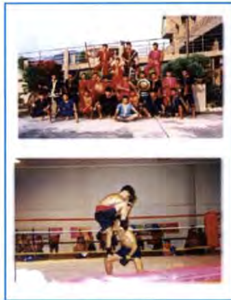
ภาพประกอบกิจกรรม

3. กิจกรรมที่ควรต้องสนุกสนาน การเลือกกิจกรรมเชิงวิเคราะห์ เป็นสิ่งจำเป็นสำหรับผู้จัดกิจกรรมทุกคน โดยเฉพาะในด้านความสนุกสนาน กิจกรรมที่สนุกสนานสนองตอบความต้องการพื้นฐานในการเล่นของเด็ก เด็กเล่นเพราะสนุก สนุกทำให้เกิดความเพลิดเพลิน ความเพลิดเพลินกระตุ้นให้อยากเล่นต่อไป การรวมเอาเป้าหมายในการเรียนรู้ของเด็กเข้ากับการเล่นจึงมักได้ผลสูงสุดเสมอทั้งในด้านคุณภาพการเรียนรู้และระยะเวลาในการเรียนรู้ การเลือกกิจกรรมสนุกสนานไม่ควรทำเพียงผิวเผินแต่ต้องรู้จักถึงขนาดว่า กิจกรรมใดมีความสนุกสูงสุด อยู่ที่ใด เช่น กิจกรรม " ลิงชิงบอล " จุดสนุกที่สุดสำหรับผู้เล่นที่อยู่นอกวงคือ การหลบหลีกส่งลูกบอลให้ผู้อื่น โดยคนเป็น "ลิง" ไม่สามารถแย่งลูกบอลได้ แต่สำหรับคนที่เป็น "ลิง" จุดสนุกที่สุดคือ สามารถแย่งลูกบอลได้ ทั้งนี้ เพื่อจะได้เลือกกิจกรรมที่สนองตอบความสนุกสนานสำหรับเด็กทุกคน