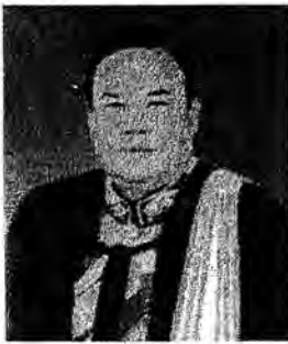
พลตำรวจเอก ดร.คุณ โสติพิพันธุ์