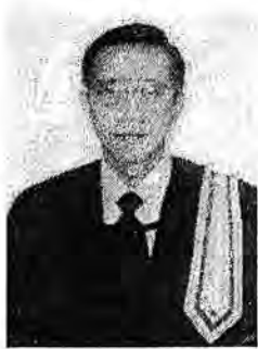
พลตำรวจโท วันชัย ศรีนวนนัต