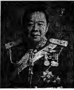
พลเอก ประวิตร วงษ์สุวรรณ