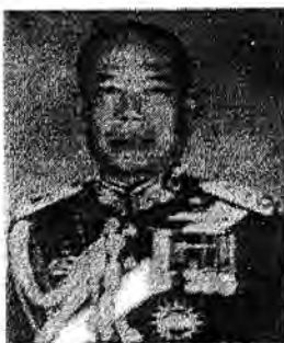
พลเอก พิชาญเมธ ม่วงมณี