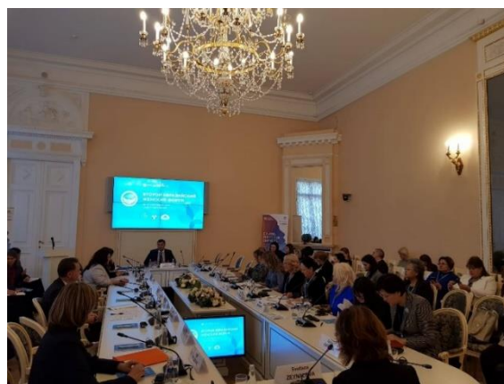
ภาพบรรยากาศการประชุมกลุ่มย่อยเรื่อง "สตรีกับความก้าวหน้าทางสังคม" เมื่อวันที่ ๒๐ กันยายน ๒๕๖๑