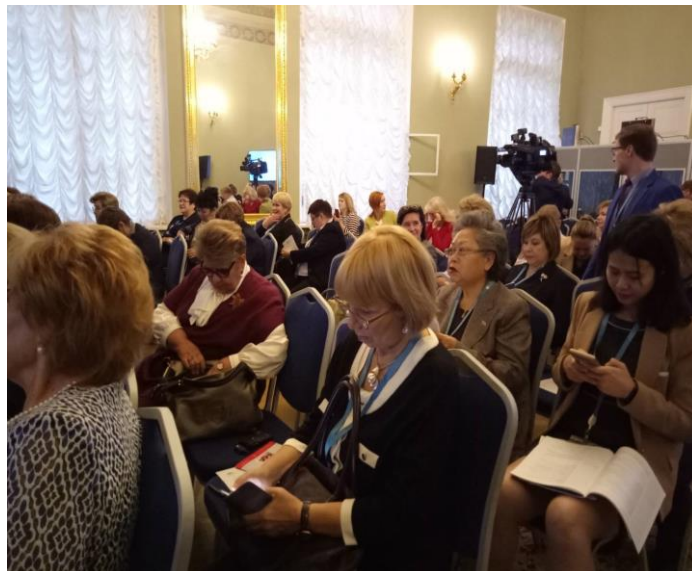
บรรยากาศการประชุมกลุ่มย่อย เรื่อง “การมีอายุยืนยาวอย่างมีคุณภาพ – ความล้ำหน้าของเทคโนโลยีและความริเริ่มของสตรี”

นอกจากนี้ ที่ประชุมยังมีการอภิปรายอย่างกว้างขวางเกี่ยวกับการใช้เทคโนโลยีทางการแพทย์สมัยใหม่เพื่อช่วยผู้สูงอายุให้ใช้ชีวิตอย่างมีคุณภาพ รวมถึงการทำงานอดิเรก เล่นกีฬา ท่องเที่ยวและใช้ชีวิตในชนบทของผู้สูงอายุ การจ้างงานผู้สูงอายุ การดูแลโดยภาครัฐที่เกี่ยวข้องไปกับการจัดงบประมาณที่เหมาะสมและการใช้เทคโนโลยีสมัยใหม่เพื่อลดช่องว่างระหว่างวัย ซึ่งล้วนช่วยให้ผู้สูงอายุมีชีวิตอยู่อย่างมีความสุขและไม่กังวลว่าจะเป็นภาระของสังคม