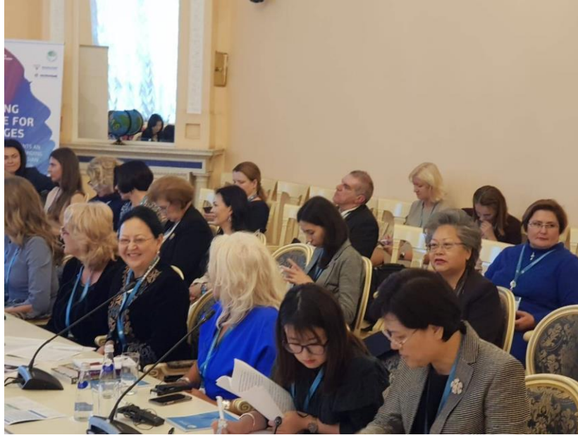
นางพิไลพรรณ สมบัติศิริ หัวหน้าคณะผู้แทนสถานิติบัญญัติแห่งชาติ เข้าร่วมการประชุมกลุ่มย่อยเรื่อง "สตรีกับความก้าวหน้าทางสังคม" เมื่อวันที่ ๒๐ กันยายน ๒๕๖๑