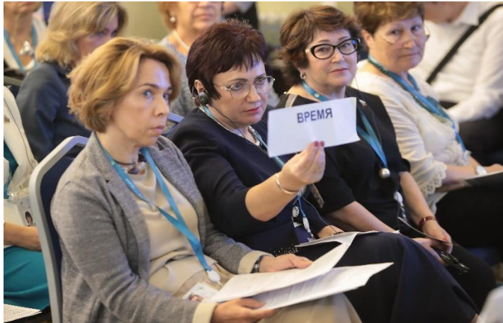
บรรยากาศการอภิปรายของผู้เข้าร่วมประชุมในการประชุมกลุ่มย่อย เรื่อง “การมีอายุยืนยาวอย่างมีคุณภาพ – ความล้ำหน้าของเทคโนโลยีและความริเริ่มของสตรี”