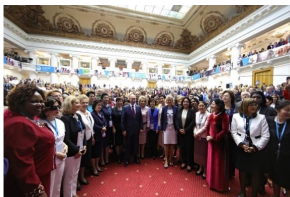
นาย Vladimir Putin ประธานาธิบดีรัสเซีย ถ่ายภาพร่วมกับนาง Valentina Matvienko ประธานสภาสหพันธ์ แห่งสหพันธรัฐรัสเซีย และผู้เข้าร่วมการประชุมในพิธีเปิดการประชุม Eurasian Women's Forum ครั้งที่ ๒ เมื่อวันที่ ๒๐ กันยายน ๒๕๖๑