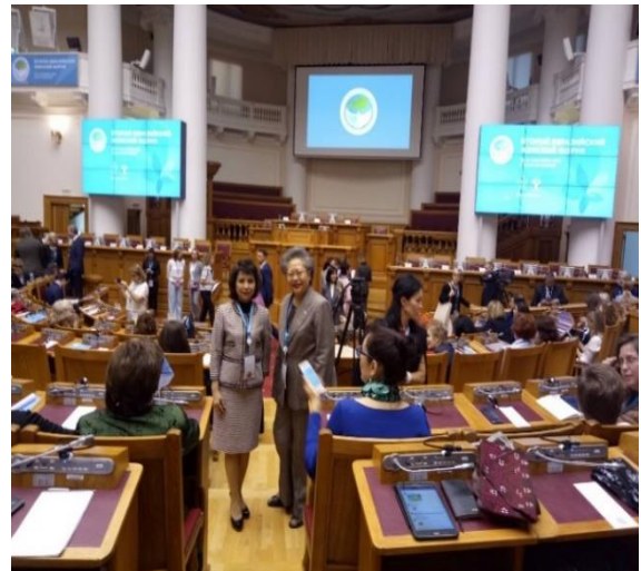
คณะผู้แทนสภานิติบัญญัติแห่งชาติ เข้าร่วมพิธีเปิดการประชุม Eurasian Women's Forum ครั้งที่ ๒