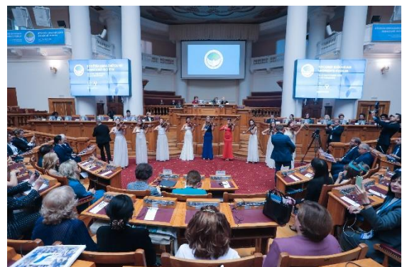
ภาพบรรยากาศพิธีปิดการประชุม Eurasian Women's Forum ครั้งที่ ๒

จัดทำโดยกลุ่มงานกิจการพิเศษ สำนักองค์การรัฐสภาระหว่างประเทศ สำนักงานเลขาธิการสภาผู้แทนราษฎร