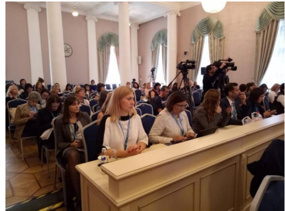
ภาพบรรยากาศการเข้าร่วมประชุมกลุ่มย่อยเรื่อง "สตรีกับการเติบโตทางเศรษฐกิจอย่างสมดุล" เมื่อวันที่ ๒๐ กันยายน ๒๕๖๑