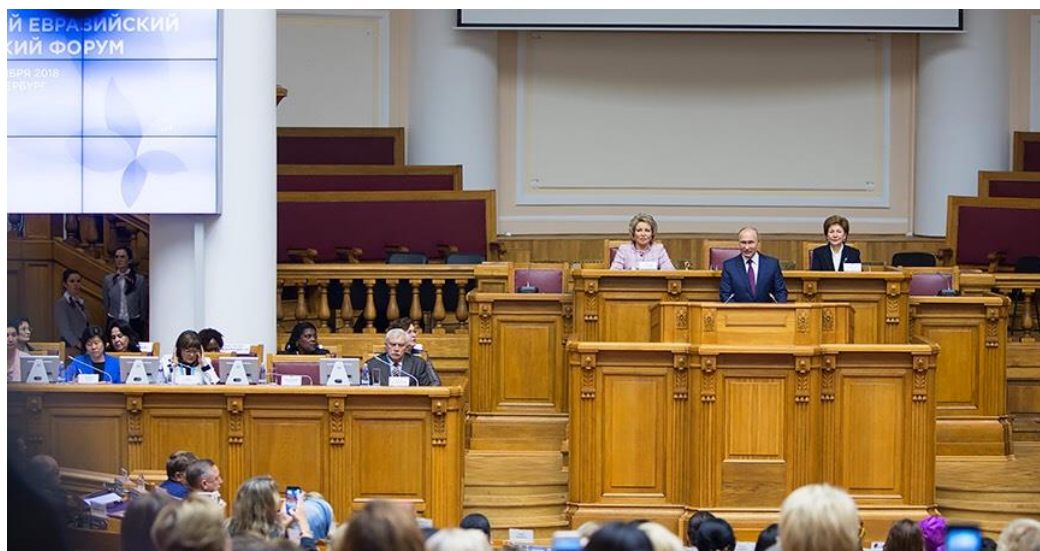
นาย Vladimir Putin ประธานาธิบดีรัสเซีย กล่าวสุนทรพจน์ในพิธีเปิดการประชุม Eurasian Women's Forum ครั้งที่ ๒ เมื่อวันที่ ๒๐ กันยายน ๒๕๖๑