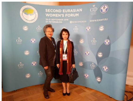
คณะผู้แทนสถานิติบัญญัติแห่งชาติเข้าร่วมการประชุม Eurasian Women's Forum ครั้งที่ ๒ ณ พระราชวัง Tavrisheskiy นครเซนต์ปีเตอ์สเบิร์ก