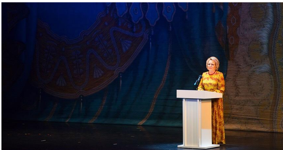
นาง Valentina Matvienko ประธานสภาสหพันธ์แห่งสหพันธรัฐรัสเซีย กล่าวเปิดงานคอนเสิร์ตกาลา สำหรับผู้เข้าร่วมการประชุม Eurasian Women's Forum ครั้งที่ ๒ เมื่อวันที่ ๑๙ กันยายน ๒๕๖๑