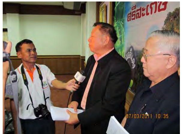
เดินทางไปประชุมศึกษาดูงาน เรื่อง “การติดตามผลการดำเนินโครงการประกันรายได้เกษตรกร” ระหว่างวันที่ ๒๙ - ๓๐ มีนาคม ๒๕๕๔ ณ อำเภอเมือง จังหวัดศรีสะเกษ