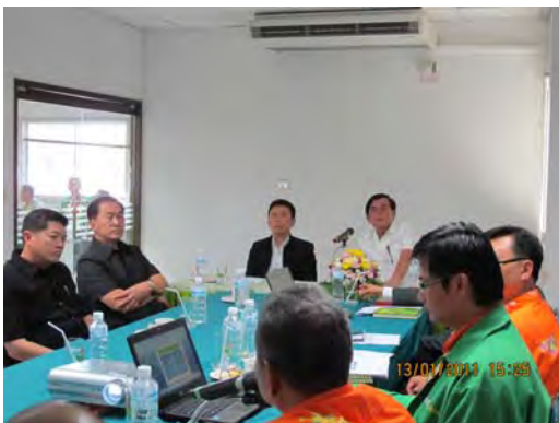
เดินทางไปประชุมและศึกษาดูงาน เพื่อติดตามผลการดำเนินโครงการประกันรายได้เกษตรกร วันที่ ๑๓ มกราคม ๒๕๕๔ ณ จังหวัดศรีสะเกษ