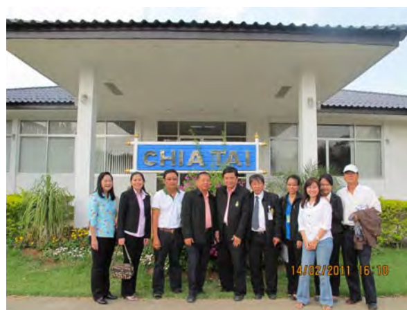
เดินทางไปประชุมและศึกษาดูงาน เรื่อง “การส่งเสริมการผลิตเมล็ดพันธุ์พืช” ระหว่างวันที่ ๑๔ - ๑๕ กุมภาพันธ์ ๒๕๕๔ ณ จังหวัดกาญจนบุรี