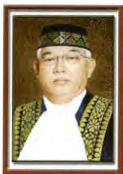
ยัง เบอร์ฮอร์มัด ตัน ซรี ดาโต๊ะ เซรี ดอกเตอร์ อับดุล ฮามิด ปาวันเตย์ (YB Tan Sri Dato' Seri Dr. Abdul Hamid Pawanteh) ตั้งแต่ ๗ กรกฎาคม พ.ศ. ๒๕๔๖ – ๖ กรกฎาคม พ.ศ. ๒๕๔๙