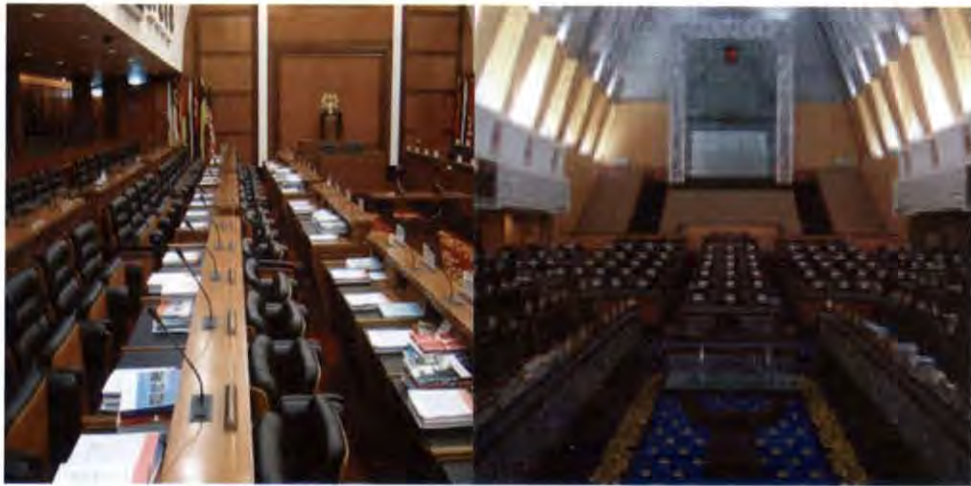
ที่ประชุมรัฐสภามาเลเซีย