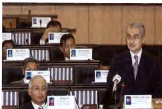
บรรยากาศการประชุมสภาผู้แทนราษฎร มาเลเซีย