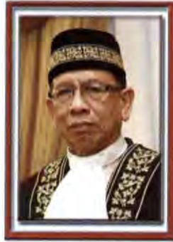
ประธานวุฒิสภาคนปัจจุบัน ยัง เบอร์ฮอร์มัด ตันซรี อาบู ซาฮาร์ บิน ดาโต๊ะ นิกา อุจัง (YB Tan Sri Abu Zahar bin Dato' Nika Ujang) ดำรงตำแหน่งตั้งแต่ ๒๖ เมษายน พ.ศ. ๒๕๕๓ – ปัจจุบัน