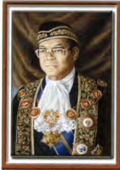
ตุน ดาตุก ฮาจิ โอมาร์ โยเคะ ลิน ออง (Y. A. Bhg. Tun Datuk Haji Omar Yoke Lin Ong) ตั้งแต่ ๒๓ กุมภาพันธ์ พ.ศ. ๒๕๑๖-๓๑ ธันวาคม พ.ศ. ๒๕๒๓