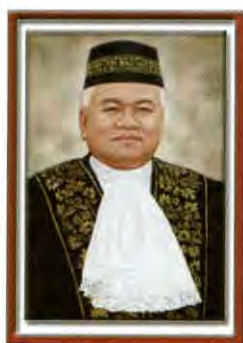
ยัง เบอร์ฮอร์มัด (สมาชิกวุฒิสภา) ดาโต๊ะ ไออาร์ วอง ฟุน เมง (YB Senator Dato' Ir. Wong Foon Meng) ตั้งแต่ ๗ กรกฎาคม พ.ศ. ๒๕๕๒ – ๑๒ เมษายน พ.ศ. ๒๕๕๓