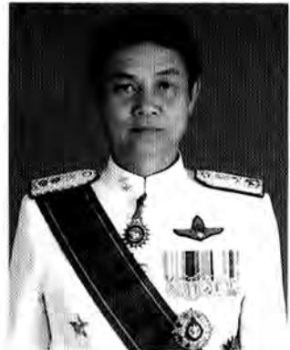
พลตำรวจตรี มงคล กมลบุตร