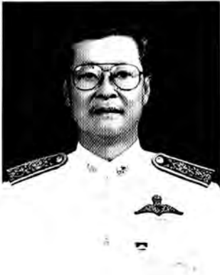
นายพลาวุธ เขาวนโยธิน รองผู้ว่าการการไฟฟ้าส่วนภูมิภาค