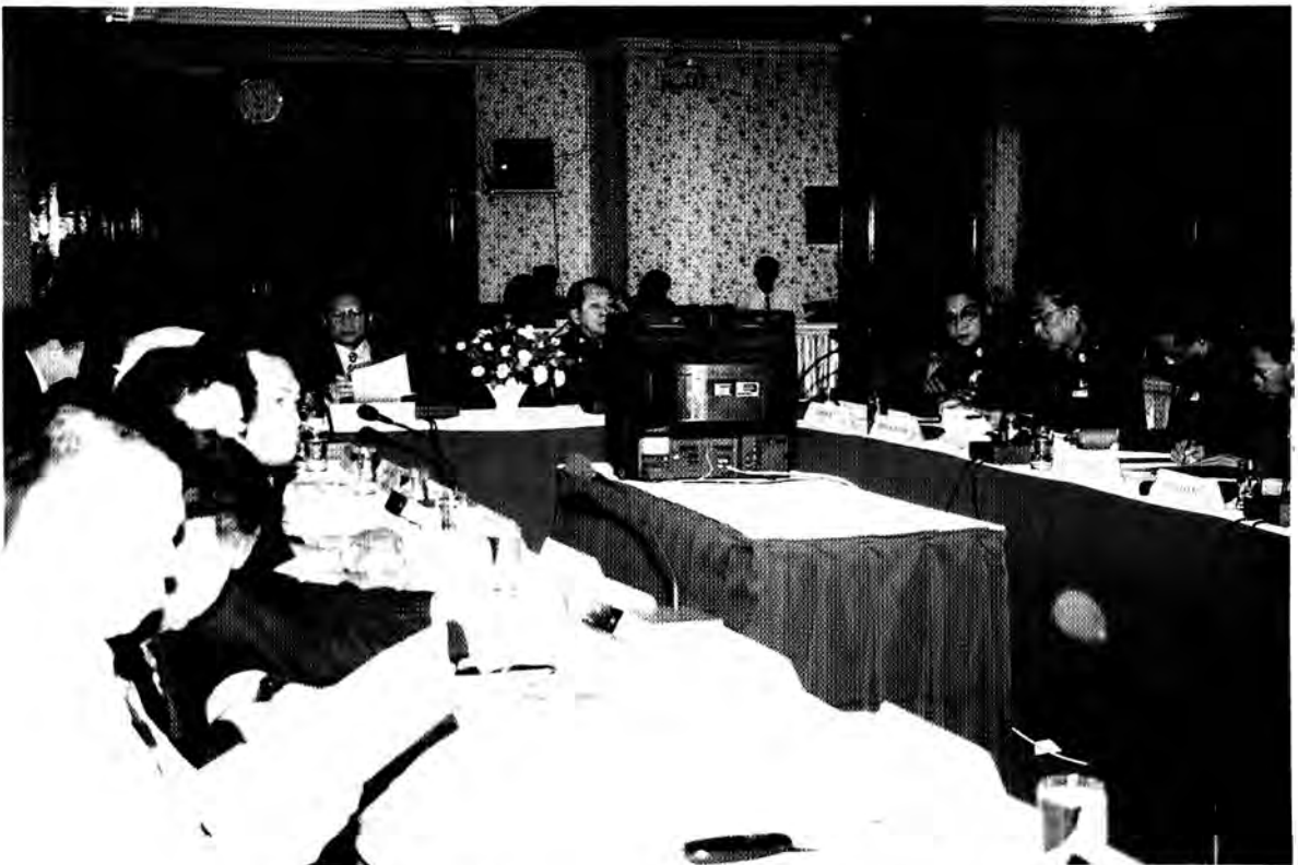
นายแก้ว บัวสุวรรณ ประธานคณะกรรมการการปกครอง และคณะ ตรวจสอบและติดตามการดำเนินการแก้ไขปัญหาการแพร่ระบาดของยาเสพติด (ยาบ้า) ในเขตพื้นที่ตำรวจภูธร ภาค 7