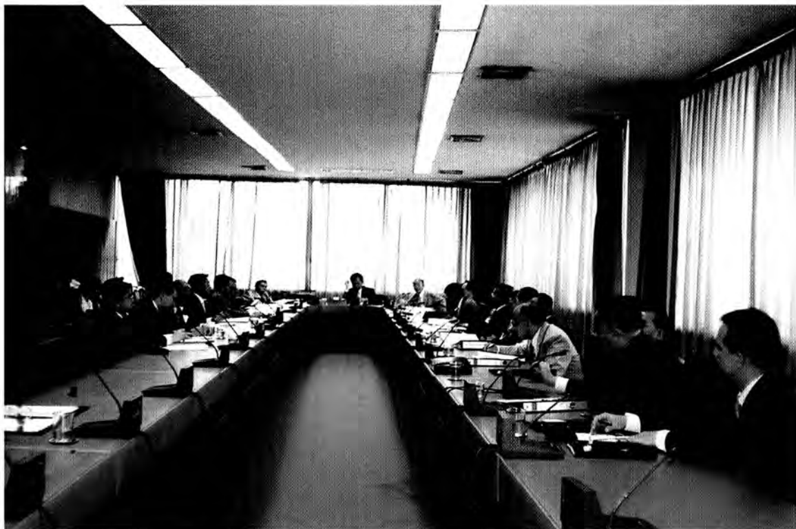
การประชุมคณะกรรมการการปกครอง สถาผู้แทนราษฎร เพื่อพิจารณาศึกษาสอบสวนในเรื่องต่าง ๆ ที่อยู่ในอำนาจหน้าที่ และตามที่ได้รับมอบหมายจากสภาฯ