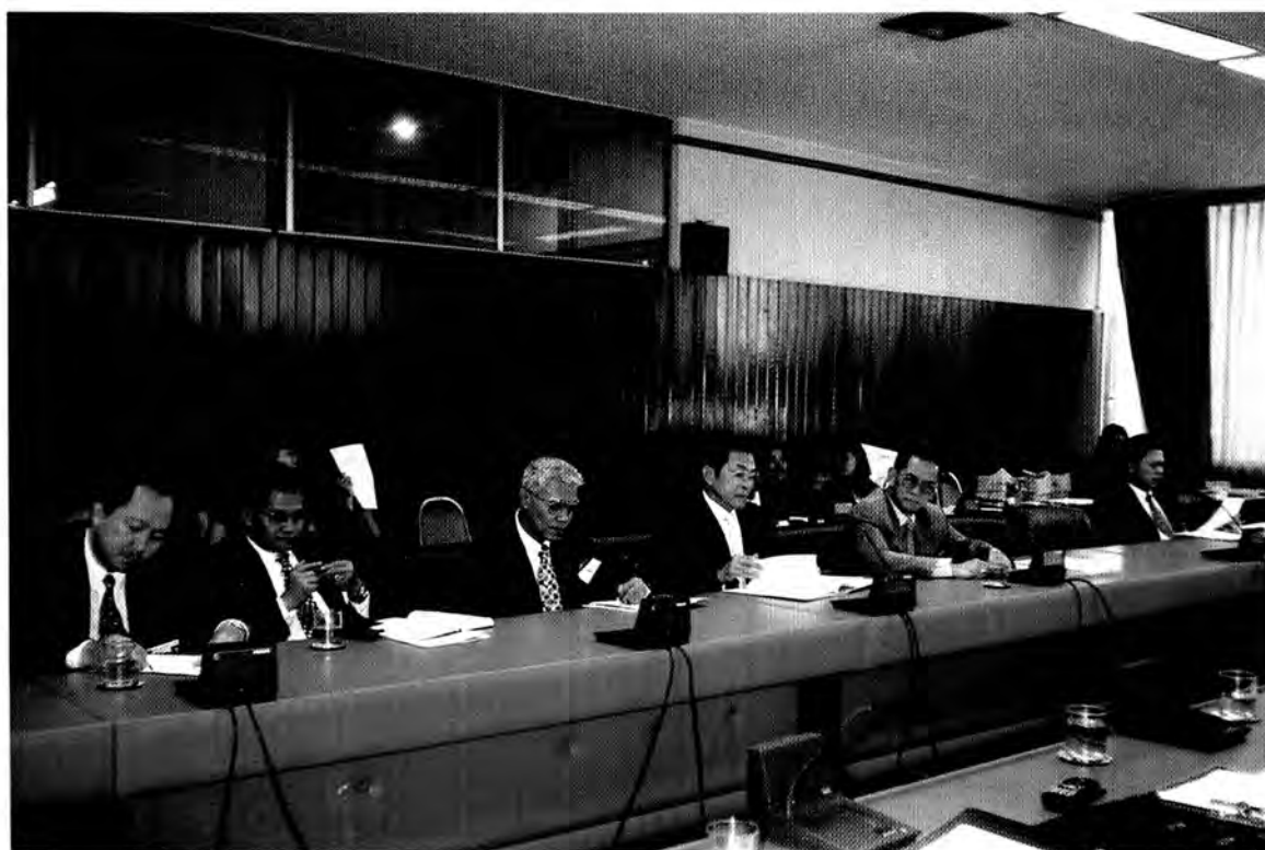
รัฐมนตรีว่าการกระทรวงเกษตรและสหกรณ์ (นายปองพล อดิเรกสาร) ร่วมประชุมกับคณะกรรมการการปกครอง เพื่อร่วมหารือกรณีอุบัติเหตุเรื่อง ขอให้หยุดเลิกองค์การอุตสาหกรรมป่าไม้ (ออป.)