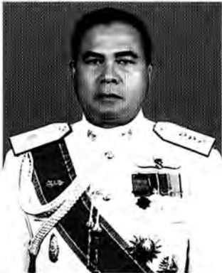
พลตำรวจโท เหมราช ชาติไทย