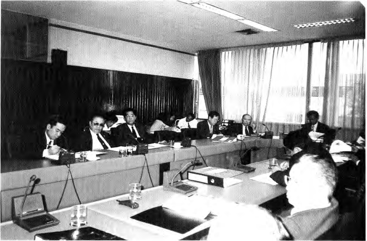
รัฐมนตรีช่วยว่าการกระทรวงมหาดไทย (นายธานี ศักดิ์เทระขุ) ร่วมประชุมกับคณะกรรมการการปกครองเพื่อชี้แจงข้อเท็จจริงกรณีเรื่อง การจับกุมยาบ้าคนใกล้ชิดรัฐมนตรีช่วยว่าการกระทรวงมหาดไทย