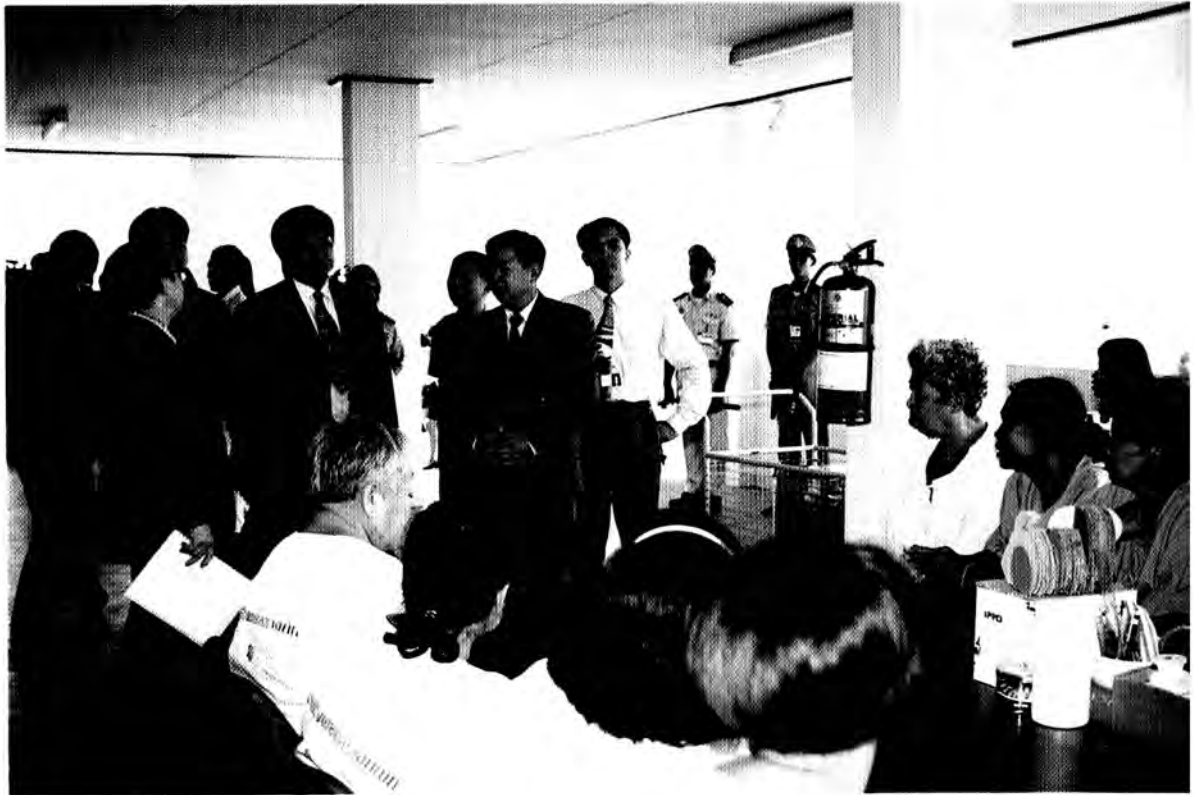
นายแก้ว บัวสุวรรณ ประธานคณะกรรมการการปกครอง และคณะ ตรวจเยี่ยมสภาพความเป็นอยู่ของนักโทษในเรือนจำ ณ ทัณฑสถานหญิงคลองเปรม