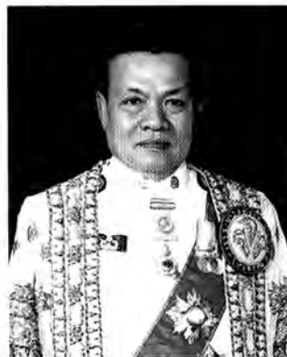
พลตำรวจโท วิโรจน์ เปาอินทร์