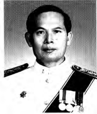
นายลิขิต เพชรสว่าง รองอธิบดีอัยการคดีเยาวชนและครอบครัว