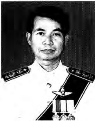
นายดิ้น ไต่กาเรม อัยการพิเศษฝ่ายคดีภาษีอากร