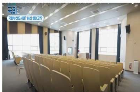
ภาพห้องเก็บข้อมูลกฎหมายและเอกสารวิชาการรัฐสภาชั้น ๒