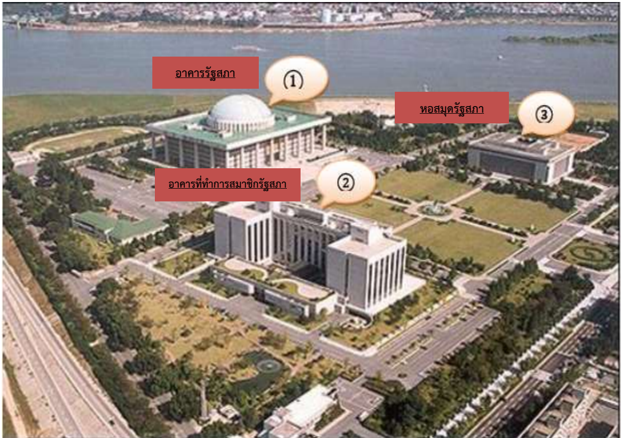
ภาพแผนที่ อาคารรัฐสภา อาคารที่ทำการสมาชิกรัฐสภา และหอสมุดรัฐสภา

อาคารรัฐสภาของเกาหลี (หมายเลข ๑) ตั้งอยู่ในกรุงโซล เป็นอาคารขนาดใหญ่ที่ตั้งอยู่ระหว่างอาคารที่ทำการของสมาชิกรัฐสภา (หมายเลข ๒) และอาคารหอสมุดรัฐสภา (หมายเลข ๓) ภายในอาคารรัฐสภามีห้องประชุมขนาดใหญ่จำนวน ๒ ห้องประชุม ประกอบด้วย ห้องประชุมรัฐสภา และห้องประชุมคณะกรรมการวิสามัญพิจารณางบประมาณรายจ่ายประจำปี