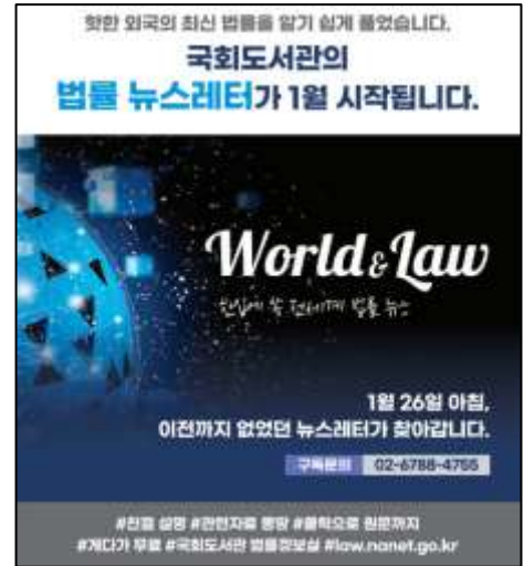
ภาพตัวอย่าง “จดหมายข่าวข้อมูลกฎหมาย” (World & Law) เผยแพร่แบบออนไลน์ทางเว็บไซต์หอสมุดรัฐสภา

ในปี ๒๕๖๕ สำนักงานข้อมูลกฎหมายประจำหอสมุดรัฐสภา ได้เริ่มจัดทำ “จดหมายข่าวข้อมูลกฎหมาย” เผยแพร่ทุก ๒ สัปดาห์ เพื่อให้บริการข้อมูลจดหมายข่าว (World&Law) ซึ่งเป็นข้อมูลสาระสำคัญในประเด็นเกี่ยวกับกฎหมายที่น่าสนใจ ทั้งในและต่างประเทศที่ทันสมัยและเป็นประโยชน์ต่อการปฏิบัติงานทั้งสมาชิกรัฐสภา ผู้ช่วยสมาชิกรัฐสภา และบุคลากรของรัฐสภา ตลอดจนบุคคลภายนอกที่เกี่ยวข้อง นอกจากนี้หอสมุดรัฐสภา ยังมีการจัดทำวารสารรายเดือนอีกด้วย