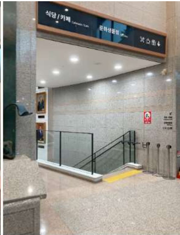
ภาพโรงอาหารภายในอาคารพิพิธภัณฑ์ของรัฐสภา