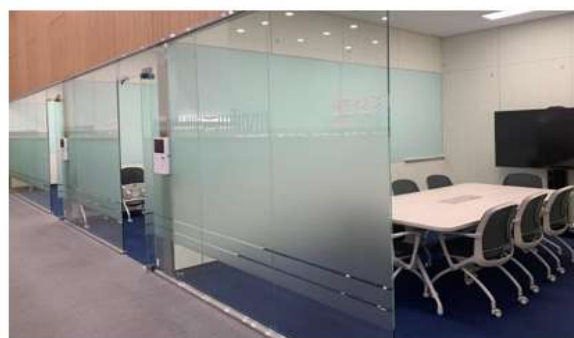
ภาพห้องประชุมขนาดเล็กให้บริการครั้งละ ๓ ชั่วโมง

หอสมุดรัฐสภาประจำเมืองปูซานเปิดให้ประชาชนทั่วไปทำบัตรสมาชิกหอสมุดได้ ให้บริการยืมหนังสือ และสามารถจองห้องสัมมนาได้ โดยเปิดให้บริการประชาชน ทั้งในวันธรรมดา ตั้งแต่เวลา ๐๙.๐๐ – ๒๑.๐๐ นาฬิกา และวันเสาร์ – อาทิตย์ ตั้งแต่เวลา ๐๙.๐๐ – ๑๗.๐๐ นาฬิกา