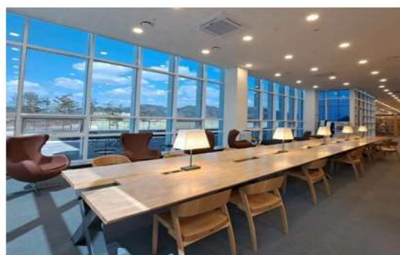
ภาพพื้นที่ใช้สอยบริเวณ ชั้น ๑ สามารถมองเห็นวิวทิวทัศน์ภายนอกได้