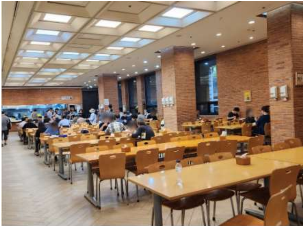
ภาพโรงอาหารภายในอาคารหอสมุดรัฐสภา