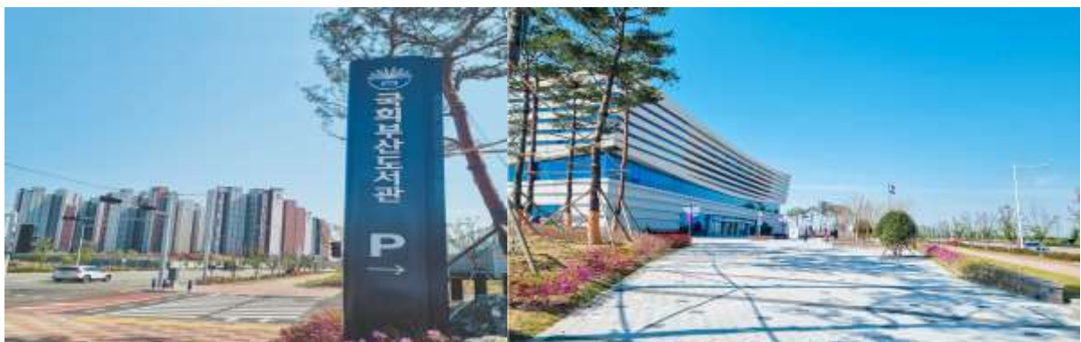
ภาพบริเวณทางเข้าอาคารหอสมุดรัฐสภา เมืองปูซาน