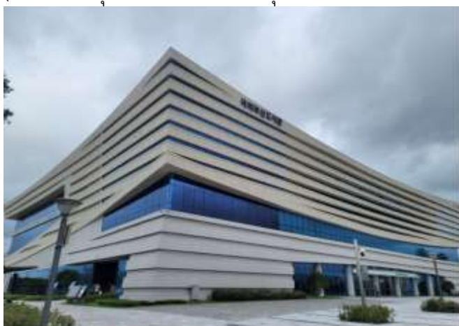
ภาพอาคารหอสมุดรัฐสภา เมืองปูซาน