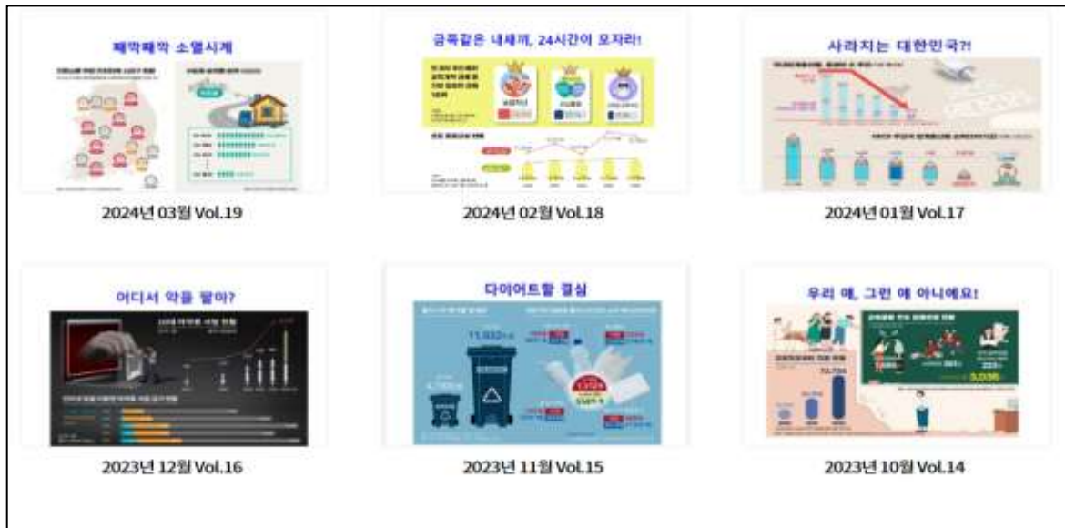
ภาพตัวอย่างเอกสาร “จดหมายข่าวสภาท้องถิ่น” ที่จัดทำขึ้นโดยหอสมุดรัฐสภาเมืองปูซาน เผยแพร่แบบออนไลน์

ในปี ๒๕๖๕ สำนักงานข้อมูลกฎหมายประจำหอสมุดรัฐสภา ได้เริ่มจัดทำ “จดหมายข่าวข้อมูลกฎหมาย” เผยแพร่ทุก ๒ สัปดาห์ เพื่อให้บริการข้อมูลจดหมายข่าว (World&Law) ซึ่งเป็นข้อมูลสาระสำคัญในประเด็นเกี่ยวกับกฎหมายที่น่าสนใจ ทั้งในและต่างประเทศที่ทันสมัยและเป็นประโยชน์ต่อการปฏิบัติงานทั้งสมาชิกรัฐสภา ผู้ช่วยสมาชิกรัฐสภา และบุคลากรของรัฐสภา ตลอดจนบุคคลภายนอกที่เกี่ยวข้อง นอกจากนี้หอสมุดรัฐสภา ยังมีการจัดทำวารสารรายเดือนอีกด้วย