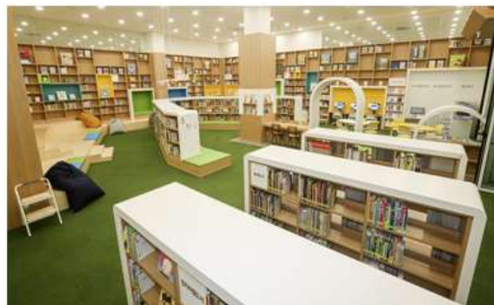
ภาพห้องอ่านหนังสือสำหรับเด็ก

หอสมุดแห่งนี้มีหนังสือที่ขนย้ายมาจากหอสมุดรัฐสภากรุงโซล จำนวน ๑.๗๕ ล้านเล่ม (หอสมุดรัฐสภากรุงโซล มีหนังสือ ๗.๓ ล้านเล่ม) และคาดว่าจะมีหนังสือใหม่เพิ่มขึ้นต่อปีจำนวน ๒.๗ หมื่นเล่ม โดยประชาชนสามารถยืมหนังสือได้ ๕ รายการ มีกำหนด ๑๕ วัน