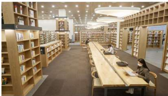
ภาพห้องอ่านหนังสือทั่วไป