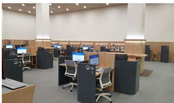
ภาพห้องมัลติมีเดีย หนังสือเสียง (Audiobook)