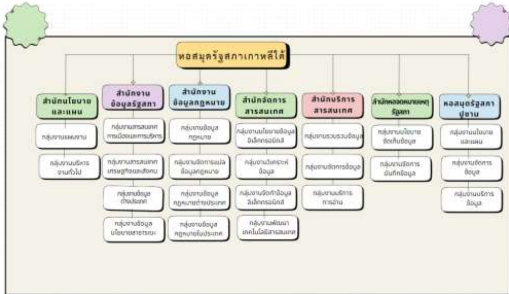
ภาพโครงสร้างหอสมุดรัฐสภาเกาหลีใต้