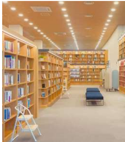
พื้นที่บริเวณภายในหอสมุดรัฐสภา เมืองปูซาน