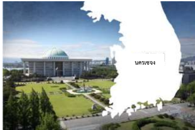
ภาพอาคารรัฐสภาปัจจุบันที่ตั้งอยู่ในกรุงโซลและแผนที่ก่อสร้างอาคารรัฐสภาแห่งใหม่ ณ เมืองเซจง