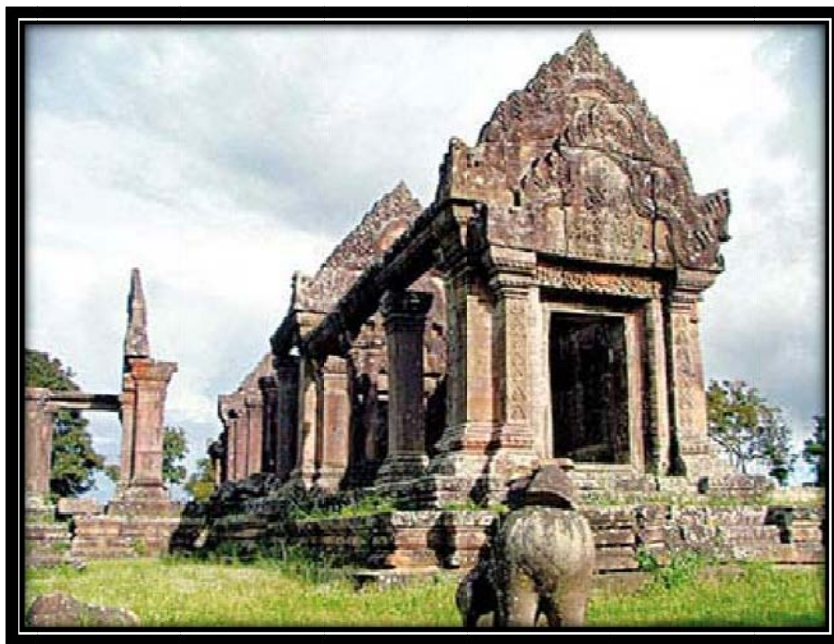
ประตูमुखของโคปุระชั้นที่ 2 ส่วนหนึ่งของปราสาทพระวิหาร

แล้ว บางคนอาจนึกถึงประเด็นข้อพิพาทเรื่องเขาพระวิหารไทย - กัมพูชา หรือนึกถึงลวดลายการแกะสลักและสถาปัตยกรรมอันงดงามของปราสาทพระวิหารจนได้รับการยกย่องว่าเป็นมรดกโลก ในบทความนี้ ขอนำเสนอประเด็นอีกแง่มุมหนึ่ง เกี่ยวกับประวัติศาสตร์ความเป็นมา และจุดประสงค์แรกเริ่มในการสร้างปราสาทพระวิหารว่า “สร้างมาเพื่ออะไร”