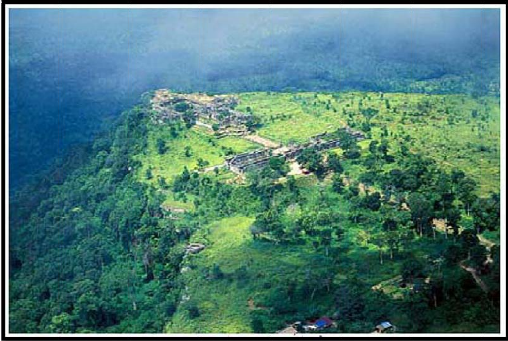
ภาพเขาพระวิหารมุงสูงเมื่อมองจากฝั่งไทย

กลุ่มแรก คือ กลุ่มชนที่อยู่เขต “ที่ราบเขมรต่ำ” นั่นคือ บริเวณที่ราบต่ำของขอม ในประเทศกัมพูชาปัจจุบัน อีกกลุ่มหนึ่ง คือ กลุ่มชนในเขต “ที่ราบสูงโคราช” นั่นคือ เขตเหนือขึ้นไป ในบริเวณเชิงเขาพนมดงรักทางฝั่งใต้ของแม่น้ำมูล ซึ่งปัจจุบันอยู่ในประเทศไทย โดยสมัย พระเจ้าชัยวรมันที่ 2 กษัตริย์ขอมในสมัยนั้นได้เป็นผู้ริเริ่มการสร้างสมานฉันท์ทางวัฒนธรรมความเชื่อในหมู่คนสองบริเวณนี้ รวมทั้งได้แผ่อำนาจทางการเมืองมายังกลุ่มชนในแถบเชิงเขาพนมดงรัก หรือเขตที่ราบสูงโคราชด้วยการเผยแพร่ “ลัทธิเทวราชา” (ลัทธิที่เกี่ยวกับการสร้างพระราชอำนาจ และสถานภาพของกษัตริย์ให้ทัดเทียมกับเทพเจ้า) ในขณะที่กลุ่มชนในเขตเขาพนมดงรักนั้น มีความเชื่อดั้งเดิมเกี่ยวกับลัทธิภูเขาศาและการนับถือบรรพบุรุษ และเรียกสถานที่แห่งนี้ว่า “ภวาลัย”