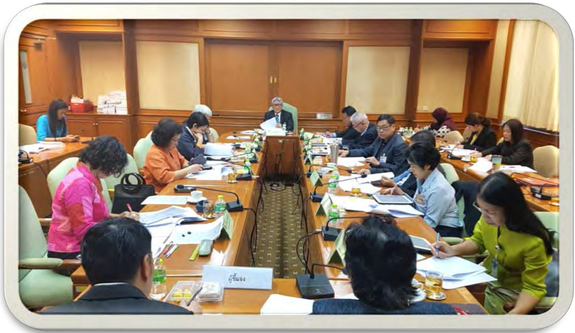
การประชุมคณะกรรมการการวิจัยและพัฒนา