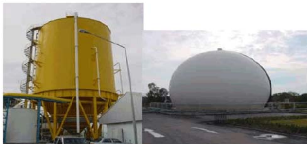
ถังย่อยสลายแบบไม่ใช้ออกซิเจน และถังเก็บก๊าซชีวภาพ

โครงการผลิตปุ๋ยอินทรีย์และพลังงาน เทศบาลนครระยอง จังหวัดระยอง