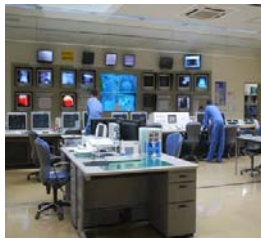
ห้องควบคุมการทำงาน ภายในศูนย์บำบัดฯ