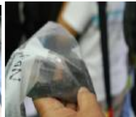
ตัวอย่างกากตะกอนแข็ง