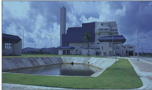
โรงไฟฟ้าขยะเทศบาลนครภูเก็ต