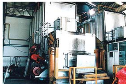
เตาเผาขยะเทศบาลนครภูเก็ต