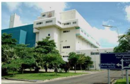
โรงไฟฟ้าขยะเทศบาลนครภูเก็ต