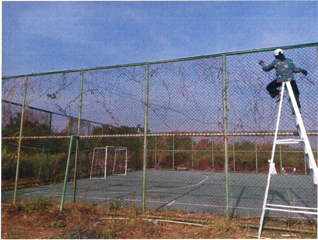
พื้นที่ส่วนกลางในโครงการบ้านเอื้ออาทรบางขุนเทียน ๓