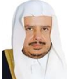
ซาอูดิอาระเบีย