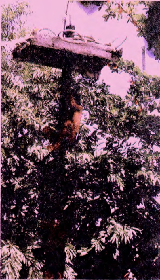
ร้านเปรตบางแห่งยกพื้นสูงมีเสาเดียว ที่เสาทาน้ำมันให้ลื่นจัด เพื่อเป็นที่สุม ทั้งผู้ป็นขึ้นชิงเปรตและผู้ร่วมกิจกรรม