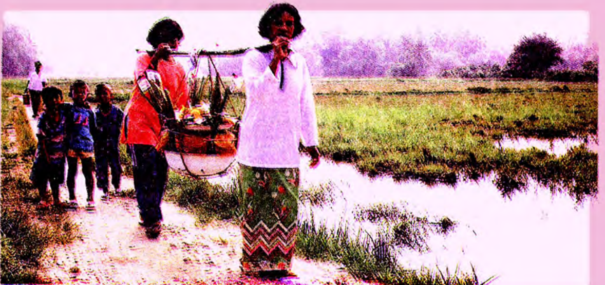
ชาวบ้านในชนบทกำลังยกห่มรับไปทำบุญที่วัด โดยการหามเดินไปตามดินนา