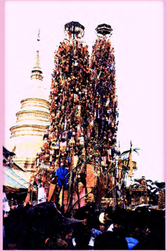
ต้นสลากที่ย้อม ในงานทานสลากภัตต์ วัดพระธาตุศรีบุญชัย จ.ลำพูน

ทานสลาก หรือ กินถวายสลาก คือ การทำบุญสลากภัตต์ อันเป็นประเพณีในการทำบุญของชนชาวล้านนาที่อาจคลาดเคลื่อนกันเล็กน้อยในรายละเอียดของแต่ละท้องถิ่น แต่มีความหมายและความมุ่งหมายเดียวกัน เป็นประเพณีเก่าแก่ที่มีมาตั้งแต่ครั้งพุทธกาลปรากฏในธรรมบทพุทธทศกนิยาย พระพุทธองค์ทรงสรรเสริญพระอรหันตสาวกของพระองค์ คือ พระโกณฑธานเถระซึ่งเป็นผู้โชคดีในการจับสลากได้ที่ ๑ ทุกครั้ง ซึ่งแม้พระพุทธเจ้าก็สู้ท่านไม่ได้ พระสาวกทั้งหลายมีความสงสัยว่าทำไมท่านจึงโชคดีเช่นนั้น พระพุทธเจ้าตรัสบอกแก่ภิกษุพระสงฆ์ทั้งหมดว่า โกณฑธานปรารถนาว่าถ้าเลือกอะไรแข่งขันอะไร ขอให้ได้ที่หนึ่งเสมอ ดังนั้นชาตินี้โกณฑธานจึงเป็นผู้โชคดี