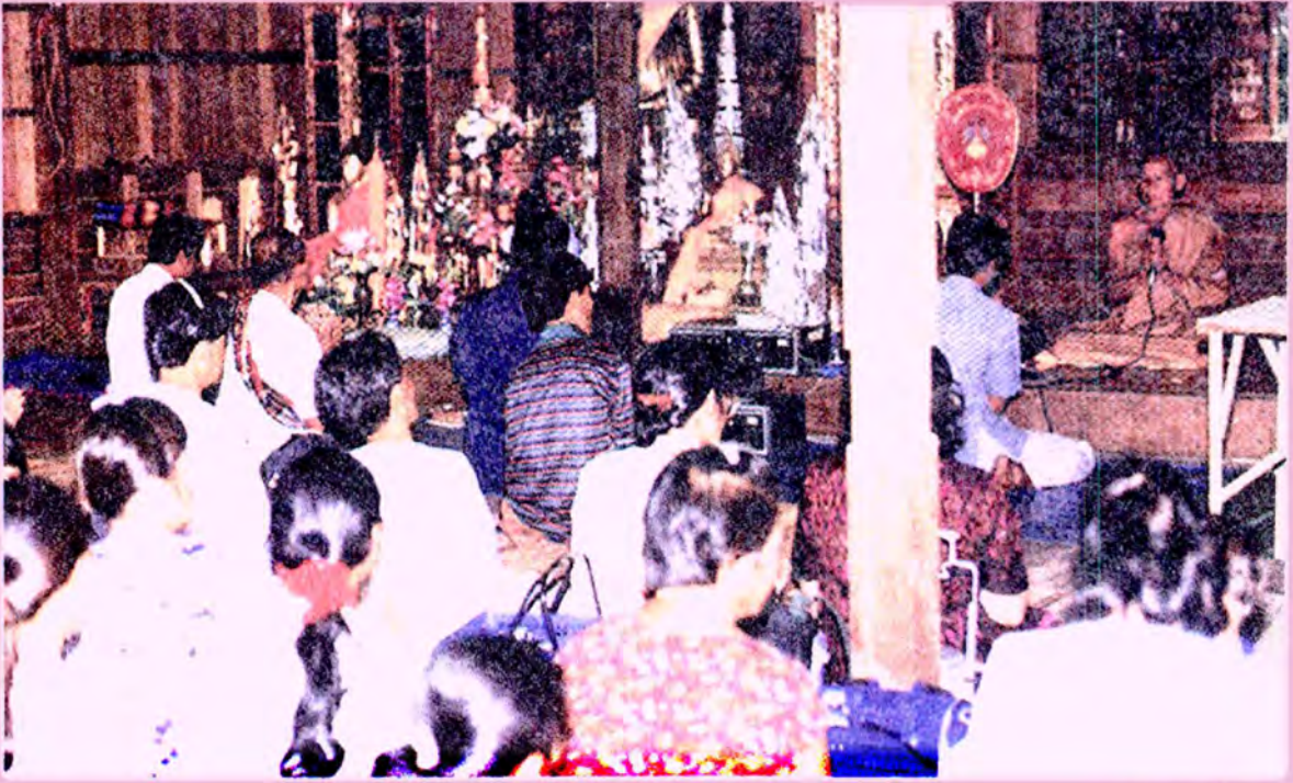
ถวายกฐิน

และกฐินหลวง ได้แก่ กฐินที่ทางราชการจัดขึ้น แม้จะเป็นกฐินที่ข้าราชการในระดับจังหวัด หรือระดับอำเภอร่วมกันจัดขึ้น ชาวบ้านก็มักเรียกว่า กฐินหลวง เช่นกัน นอกจากนี้มี จุลกฐิน ซึ่งชาวอีสานเรียกว่า กฐินแล่น