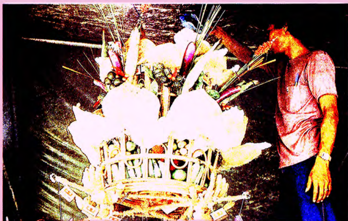
จัดหุ่มรับ