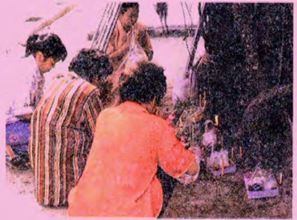
การทำบุญอุทิศส่วนกุศลนอกบริเวณวัด ด้วยความเชื่อที่ว่าเปรตบางจำพวกเข้าไม่ได้