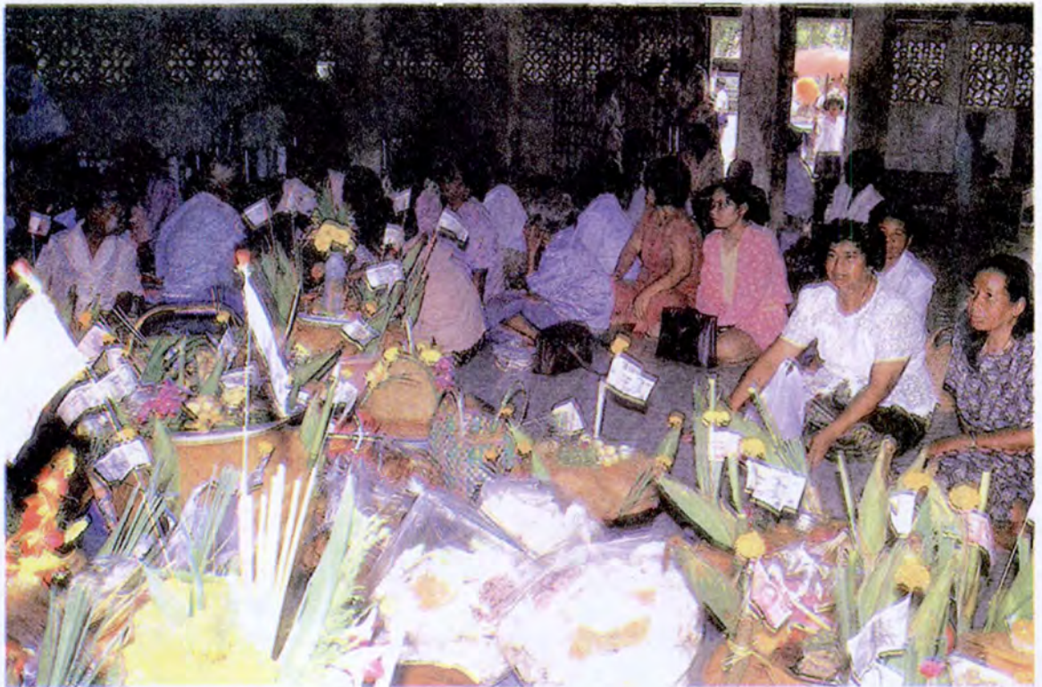
หุ้มรับประเภทต่าง ๆ ภายในวัด