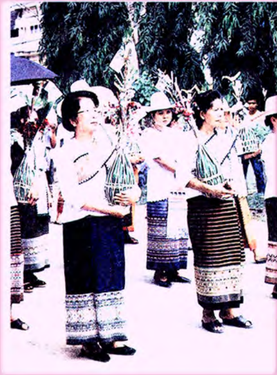
นำถวายสลากไปทานรวมกันที่วัด (ในภาพเป็นสลากของ)