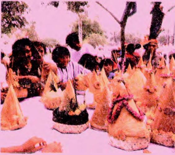
การตั้งเปรตในเขตวัด