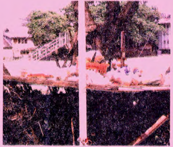
การตั้งเปรตนอกเขตวัด (อาจเป็นในเขตป่าช้า)