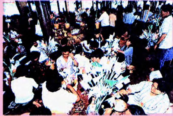
บรรยากาศในงานกฐิน