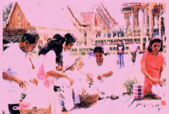
ร้านเปรตทั่ว ๆ ไป นิยมยกพื้นเพียงเล็กน้อย พอวางของและชิงกันได้สะดวกทั้งเด็กและผู้ใหญ่