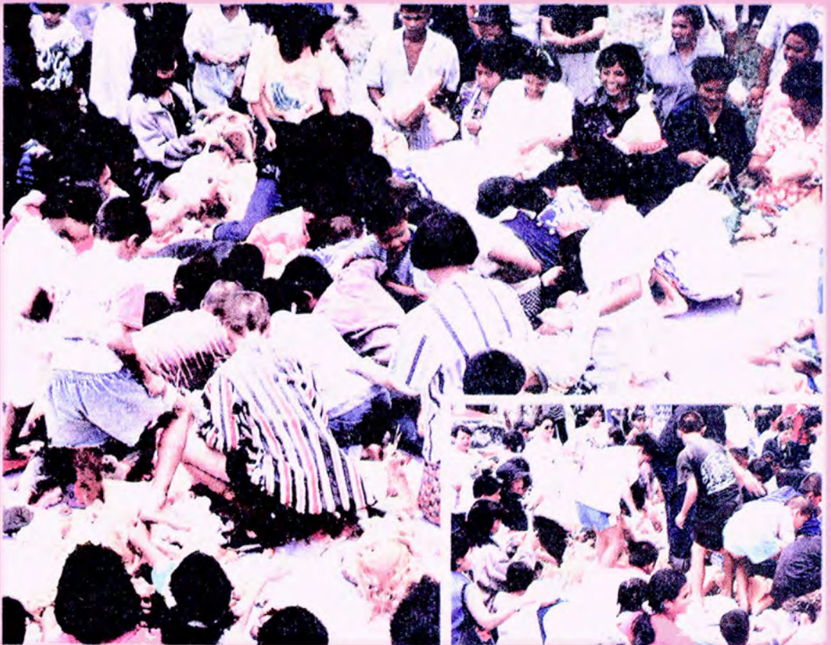
ทั้งเด็กและผู้ใหญ่ต่างตั้งใจร่วมกันชิงเปรต เชื่อกันว่าเปรตตนใด ลูกหลานไม่ร่วมชิงก็จะ ต้องอดอยากไปตลอดปี