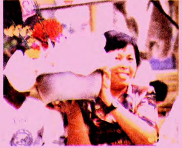
ร่วมพิธีตั้งเปรตและชิงเปรต