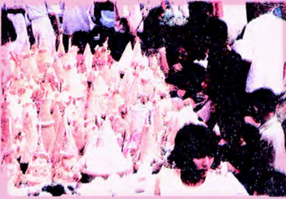
ชาวบ้านทยอยกันนำขนมและหมักรับต่าง ๆ