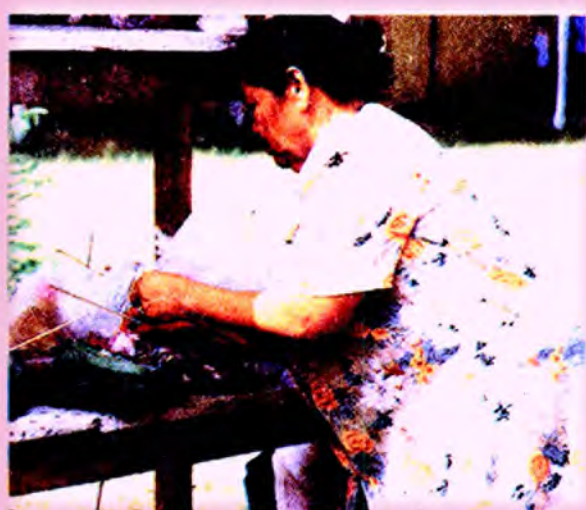
ชาวบ้านที่มาร่วมทำบุญ จะนำอาหารและขนมต่าง ๆ มาวางไว้ที่ร้านปรต