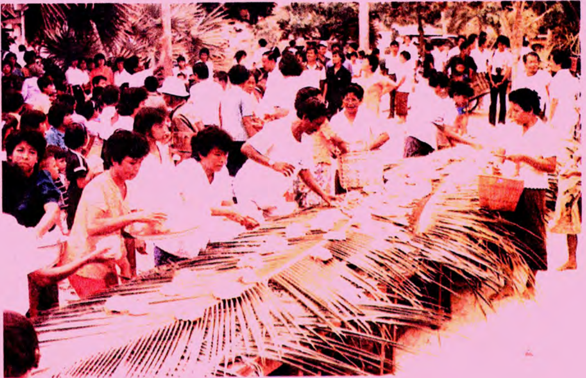
ร้านปรตที่ยกพื้นต่ำ