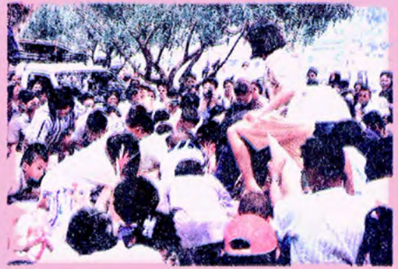
เมื่อเสร็จพิธีต่าง ๆ ทางศาสนาแล้ว ชาวบ้านทั้งเด็กและผู้ใหญ่ จะร่วมกัน "ชิงเปรต" ด้วยความสนุกสนาน