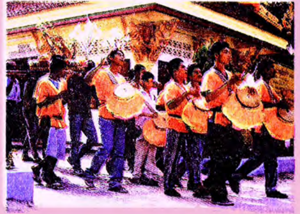
ขบวนแห่ห่มรับไปวัดของชาวบ้าน