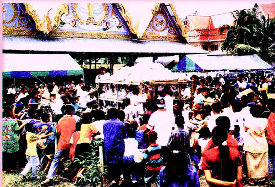
ร้านปรตและประชาชนที่มาร่วมสนุกด้วยการชิงปรต