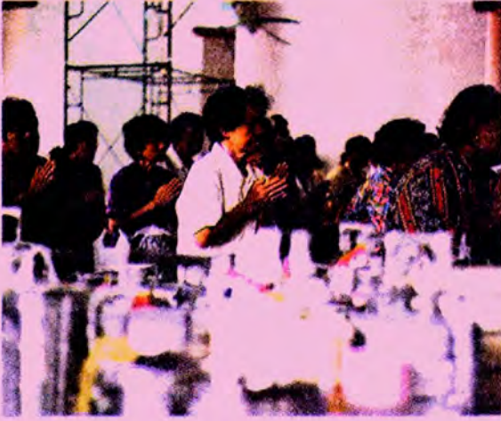
ทำบุญก่อนตั้งเปรต