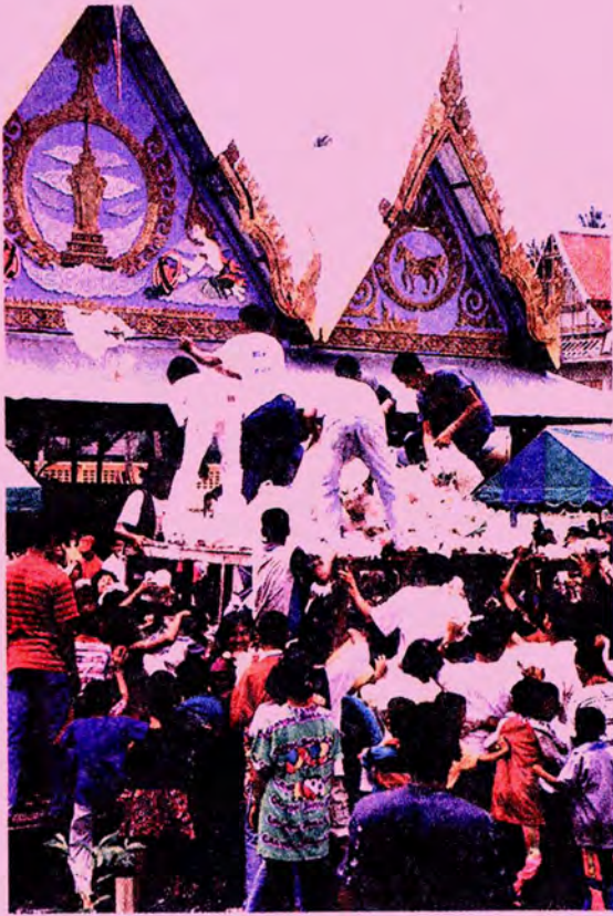
ร้านปรตยกพื้นขนาดพอท่วมหัว