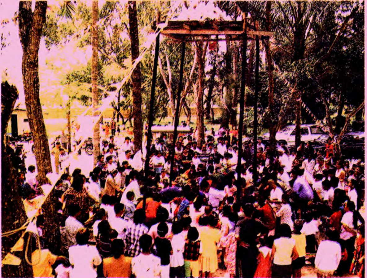
เมื่อยังไม่ได้ชักสายสัญญาณ ทุกคนไม่อาจชิงเปรตได้ (ในภาพกำลังเตรียมการตั้งเปรต)