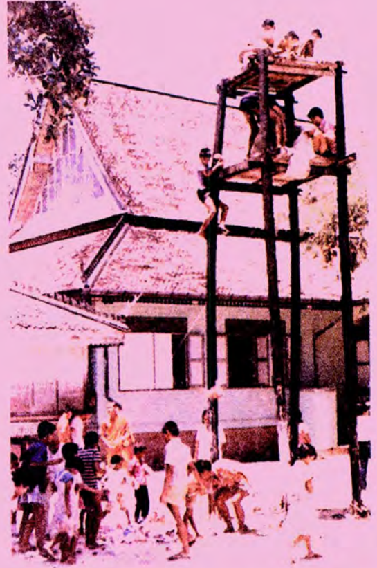
ร้านปรตที่ยกพื้นสูง ต้องปีนขึ้นชิงปรต