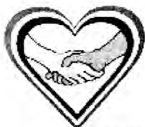
พรรครักสามัคคี

ลำดับที่ ๕๕ ชื่อพรรคการเมือง รักสามัคคี (พ.ร.ส.) ชื่อภาษาอังกฤษ PARTY OF LOVE AND UNITY (P.L.U.) จัดแจ้งในทะเบียนตาม พระราชบัญญัติประกอบรัฐธรรมนูญว่าด้วยพรรคการเมือง พ.ศ. ๒๕๔๑ ทะเบียนเลขที่ ๒๐/๒๕๔๓ วันที่จัดแจ้งในทะเบียน ๙ พฤศจิกายน ๒๕๔๓ ภาพเครื่องหมาย