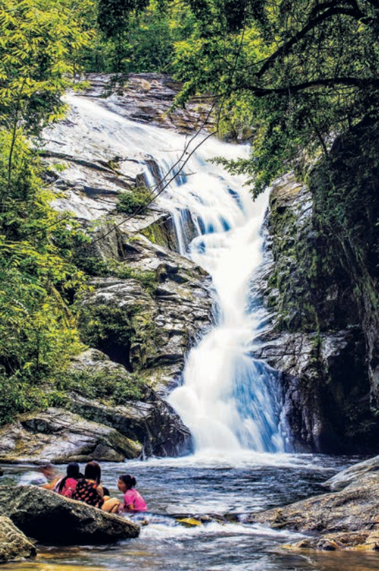
น้ำตกไซเบอร์ หรือน้ำตกหินลาด

ขาดสาย บางแห่งไหลเลาะไปตามเกาะแก่งหินลงสู่เบื้องล่าง เป็นทางยาวสูงต่ำหลายชั้นสวยงามมาก มีน้ำมากในเดือนกันยายน-ต้นเดือนพฤศจิกายน ล้ำห้วยล่อยจ้อยจะไหลไปรวมกับห้วยทับเสลา บริเวณโดยรอบเป็นป่าห้วย ต้นไม้ร่มครึ้ม และมีใบไม้เปลี่ยนสีในเดือนพฤศจิกายนด้วย