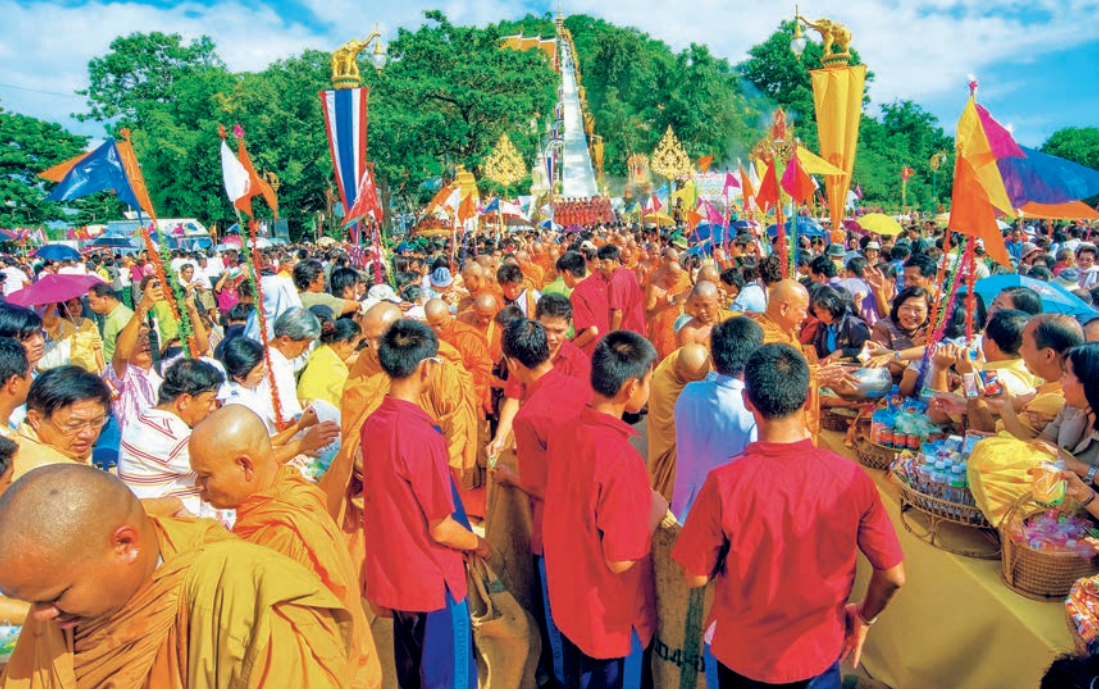
งานตักบาตรเทโว วัดสังกัสรัตนคีรี

ผู้มาเยือนสามารถพักค้างคืนที่บ้านพักในศูนย์พัฒนาสังคมหน่วยที่ ๗๓ ติดต่อ โทร. ๐ ๕๖๕๑ ๒๐๒๖ ในเวลาราชการ และจำหน่ายสินค้าหัตถกรรม ผ้าทอพื้นเมืองสิริธรรมชาติ เครื่องจักสานไม้ไผ่ และผลผลิตการเกษตรตามฤดูกาล