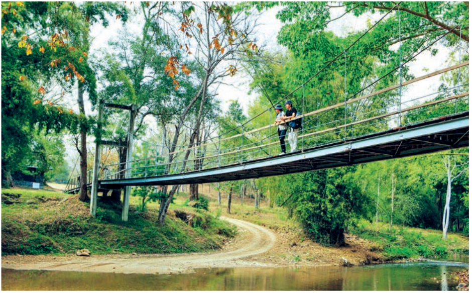
เขตรักษาพันธุ์สัตว์ป่าทุ่งใหญ่นเรศวร-ห้วยขาแข้ง

โก (UNESCO) ในการประชุมคณะกรรมการมรดกโลกของยูเนสโก ระหว่างวันที่ ๙-๑๓ ธันวาคม ๒๕๓๔ ณ เมืองคาร์เทจ ประเทศตูนิเซีย ห้วยขาแข้งมีพื้นที่ครอบคลุม ๖ อำเภอ ๓ จังหวัด คือ อำเภอบ้านไร่ อำเภอลานสัก อำเภอห้วยคต จังหวัดอุทัยธานี อำเภอสงขลาบุรี อำเภอทองผาภูมิ จังหวัดกาญจนบุรี และอำเภออุ้มผาง จังหวัดตาก มีพื้นที่ ๓,๖๐๙,๓๗๕ ไร่ หรือ ๕,๗๗๕ ตารางกิโลเมตร โดยมีการรวมพื้นที่ของเขตรักษาพันธุ์สัตว์ป่าทุ่งใหญ่นเรศวรเข้ามาด้วยทำให้เป็นผืนป่าอนุรักษ์ต่อเนื่องที่มีขนาดใหญ่ที่สุดในประเทศไทยและในภูมิภาคเอเชียตะวันออกเฉียงใต้ ลักษณะอากาศที่ห้วยขาแข้งหากเป็นฤดูร้อนจะร้อนมาก ฤดูฝนมีฝนตกหนักตลอดทั้งวัน และมีฤดูหนาวสั้นมาก