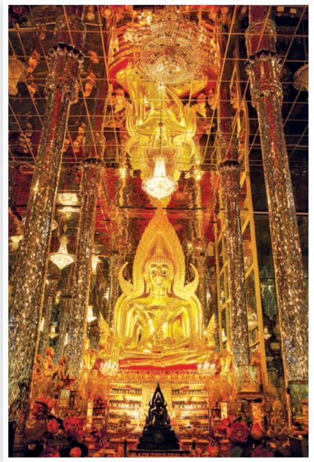
วัดท่าซุง

วัดจันทาราม หรือ วัดท่าซุง ตั้งอยู่หมู่ ๒ ตำบลน้ำซึม เดิมเป็นวัดที่สร้างในสมัยอยุธยา มีโบสถ์ขนาดเล็ก ภายในมีจิตรกรรมฝาผนังภาพพุทธประวัติฝีมือช่าง พื้นบ้านเข้าใจว่าเขียนในสมัยหลัง บางภาพต่อเติม จนผิดส่วน สมบัติอีกชิ้นหนึ่งของวัด คือ ธรรมาสน์ที่ หลวงพ่อใหญ่สร้าง ที่วิหารมีพระปูนปั้น มีลวดลาย ไม้จำหลักขอบหน้าบันเหลืออยู่ ๒-๓ แห่ง ด้านตรงข้ามกับวัดเป็นปูชนียสถานแห่งใหม่ มีบริเวณ กว้างขวางมาก พระราชพรหมยาน (หลวงพ่อกุญแจ ลิงดำ) พระเถระผู้มีชื่อเสียงได้สร้างอาคารต่าง ๆ มากมาย เช่น พระอุโบสถใหม่ ภายในประดับและ ตกแต่งอย่างวิจิตร บานหน้าต่างและประตูด้านใน เขียนภาพเทวดาโดยจิตรกรฝีมือดี พระบาท สมเด็จพระปรมินทรมหาภูมิพล อดุลยเดช เสด็จ พระราชดำเนินมาตัดลูกนิมิตพระอุโบสถแห่งนี้ บริเวณโดยรอบสร้างกำแพงแก้วและมีรูปหล่อหลวง พ่อปาน และหลวงพ่อกุญแจขนาด ๓ เท่า อยู่มุมกำแพง ด้านหน้า มณฑป และ วิหารแก้ว ๑๐๐ เมตร ที่