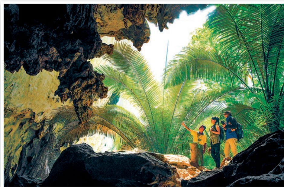
หุบป่าตาด

อุทยานนี้ใช้ทางหลวงหมายเลข ๓๓๓ ผ่านอำเภอหนองฉาง จากนั้นใช้ทางหลวงหมายเลข ๓๔๓๘ สายหนองฉาง-ลานสัก และก่อนถึงอำเภอลานสัก ๒ กิโลเมตร มีทางแยกซ้ายมือเข้าโรงเรียนลานสักวิทยาระยะทาง ๕๐๐ เมตร จะถึงเขาฆ้องชัย ห่างจากตัวเมือง ๕๒.๔ กิโลเมตร