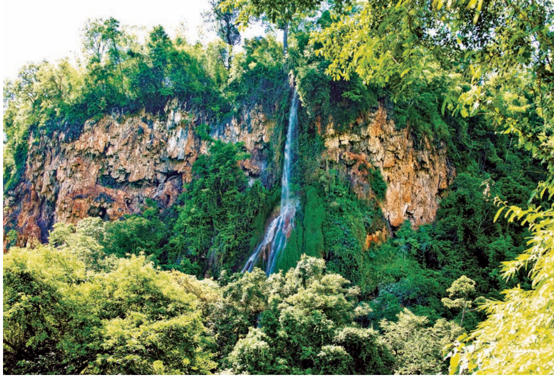
น้ำตกผารมเย็น

มานั้นเป็นสายบาง ๆ ตกลงมาตรง ๆ คล้ายสายฝน ผ่านหน้าผาดินที่มีมอสสีเขียวเกาะอยู่ ประกอบกับพื้นที่เป็นป่าร่มครึ้ม ทำให้รู้สึกชุ่มชื้นเย็นสบาย การเดินเข้าสู่ น้ำตกผารมเย็นใช้เวลาประมาณ ๒๐ นาที สามารถเดินเข้าชมเองได้ แต่หากต้องการคนนำทาง ติดต่อได้ที่ องค์การบริหารส่วนตำบลเจ้าวัด โทร. ๐ ๕๖๙๘ ๔๐๖๙ หรือติดต่อผ่านห้วยป่าปก รีสอร์ท โทร. ๐ ๕๖๕๙ ๖๑๕๐-๔