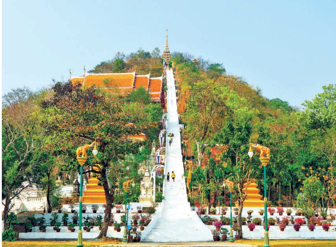
วัดสังกัสรัตนคีรี

ใช้ถนนท่าช้างจนสุดทาง ด้านซ้ายมือเป็นพระวิหารประดิษฐานพระพุทธมงคลศักดิ์สิทธิ์ พระพุทธรูปประจำจังหวัดอุทัยธานี ด้านขวามือเป็นบันไดขึ้นเขาสะแกกรัง