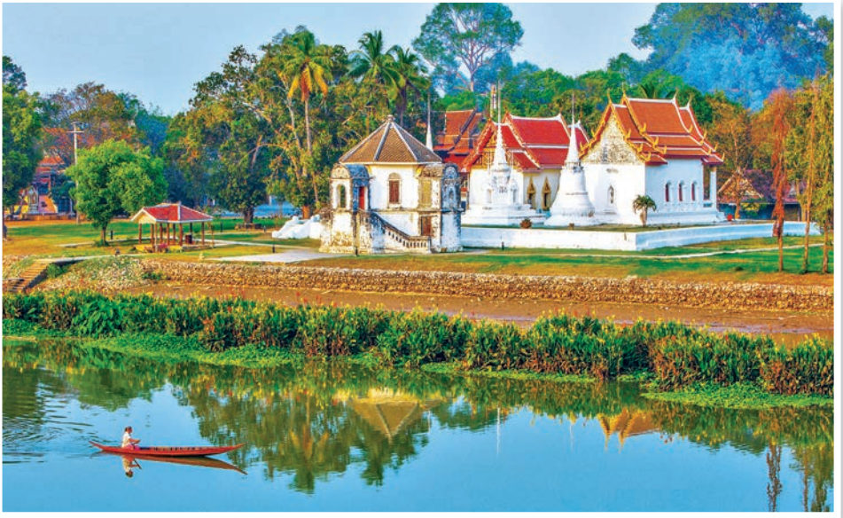
วัดอุโปสถาราม

แผนที่เกาะเทโพ และตัวเมืองอุทัยธานี สามารถติดต่อได้ที่ คุณประสงค์ ศรีเมือง ชมรมจักรยานเพื่อสุขภาพจังหวัดอุทัยธานี (ร้านเจริญจักรยาน) เลขที่ ๑๐๐-๑๐๒ ถนนท่าช้าง อำเภอเมืองอุทัยธานี โทร. ๐ ๕๖๕๑ ๑๙๙๑ ได้ทุกวัน