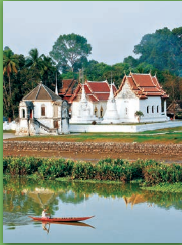
วัดอุโปสถาราม