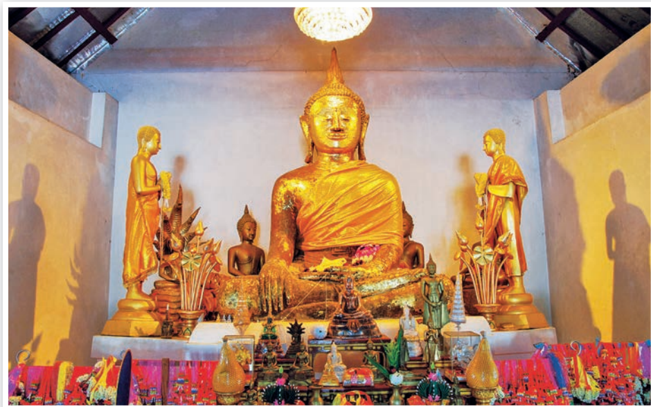
วัดหนองพลวง

หนังสือเก่า ไปจนถึงของจิปาณะทั่วไป รวมถึงข้าวของเครื่องใช้ ของเก่าเก็บ ของโบราณ และของสะสมก็นำมาวางขายให้ได้จับจ่ายใช้สอย ทั้งยังมีบ้านเก่าที่เจ้าของบ้านยินดีเปิดให้นักท่องเที่ยวได้มีโอกาสชมภาพเก่าเล่าประวัติศาสตร์ของตรอกโรงยาและเมืองอุทัยธานีอีกด้วย โดยถนนคนเดินตรอกโรงยานี้จะเปิดทุกวันเสาร์ เวลา ๑๖.๐๐-๒๐.๐๐ น.