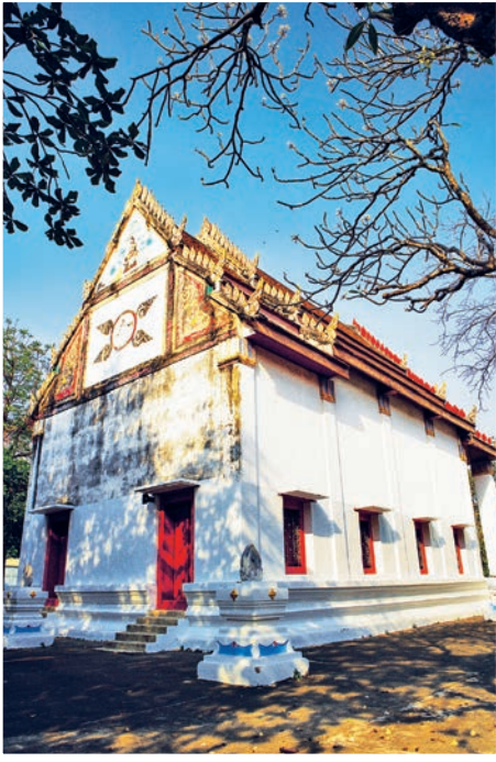
วัดมณีสถิตย์กปิฏฐาราม

จักรีทั้งฝักวางบนพระเพลาซ้าย และทรงวางพระหัตถ์ขวาบนพระเพลาขวา ด้านขวามือมีพานวางพระมาลาเส้าสูง ไม่มียี่ง่า (ขนนก) สวมรองพระบาทที่ไม่หุ้มสันพระบาท มีพิธีถวายสักการะพระราชาอนุสาวรีย์แห่งนี้ ในวันที่ ๖ เมษายน ของทุกปี ซึ่งตรงกับช่วงที่ดอกสุพรรณิการ์ หรือฝ้ายคำ ดอกไม้ประจำจังหวัดอุทัยธานีบานสะพรั่งทั่วเขาสะแกกรัง ถัดจากพระราชาอนุสาวรีย์ไปทางป่าหลังเขา ประมาณ ๒๐๐ เมตร จะพบ หมดแผนที่โลก ซึ่งใช้ในการสำรวจแผนที่ สร้างขึ้นตั้งแต่ พ.ศ. ๒๔๗๕