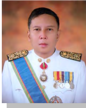
นายคำนูน สิทธิสมาน สมาชิกวุฒิสภา กรรมการ