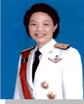
นางสาวเกศลิณี แคว้นนะ สมาชิกวุฒิสภา กรรมการ