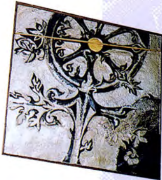
ภาพวงล้อธรรมจักรและสัญลักษณ์ ของศาสนาอื่น แสดงด้วยรูปกางเขน และเรือเตา ทั้งหมดนี้ หมายถึง ธรรม ประจำใจของประชาชนในชาติ