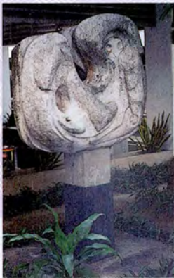
รูปไฟ อยู่ทางซ้ายด้านหลัง ของอาคารรัฐสภา 1 หมายถึง พลังอุตสาหกรรม