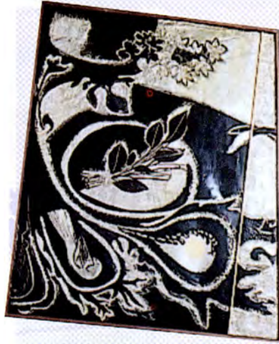
ภาพใบไม้อกจากกิ่ง หมายถึง การเริ่มต้นใหม่ของความเจริญของประเทศ