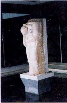
รูปผู้หญิงยืนแบกหม้อน้ำอยู่ทางขวาด้านหน้า ของอาคารรัฐสภา 1 หมายถึง น้ำ