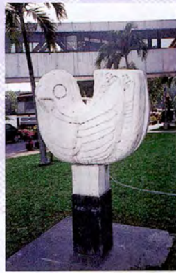
รูปนก อยู่ทางขวาด้านหลัง ของอาคารรัฐสภา 1 หมายถึง ลม ความเย็น ความสงบ และสันติสุข