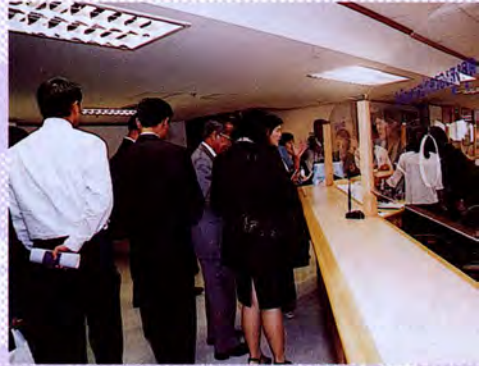
คณะกรรมการตุลาการศาลปกครอง

ศาลปกครองประกอบด้วยศาลปกครองสูงสุด และศาลปกครองชั้นต้น และอาจจะมีศาลปกครองชั้นอุทธรณ์ด้วยก็ได้ ในศาลปกครองมีคณะกรรมการตุลาการศาลปกครอง ซึ่งประกอบด้วย ประธานศาลปกครองสูงสุดเป็น ประธานกรรมการ กรรมการผู้ทรงคุณวุฒิ 9 คน ซึ่งเป็นตุลาการในศาลปกครอง กรรมการผู้ทรงคุณวุฒิ ซึ่งได้รับเลือกจากวุฒิสภา 2 คน และ กรรมการผู้ทรงคุณวุฒิ ซึ่งได้รับเลือกจากคณะรัฐมนตรีอีก 1 คน