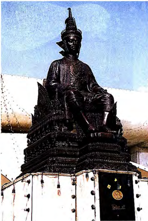
พระบรมราชานุสาวรีย์ พระบาทสมเด็จพระปกเกล้าเจ้าอยู่หัว

พระบรมราชานุสาวรีย์ พระบาทสมเด็จพระปกเกล้าเจ้าอยู่หัว ประดิษฐานอยู่ ณ บริเวณหน้าอาคารรัฐสภา 1 พระองค์ทรงเป็นผู้มีพระมหากรุณาธิคุณเป็นล้นพ้นในการทรงสละพระราชอำนาจให้แก่ปวงชนชาวไทยนำประเทศชาติเข้าสู่การปกครองในระบอบประชาธิปไตย