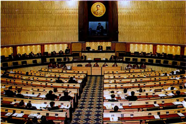
ห้องประชุมรัฐสภา ซึ่งใช้เป็นห้องประชุมของสภาผู้แทนราษฎร และวุฒิสภา

รัฐสภา ประกอบด้วยสมาชิกสภาผู้แทนราษฎรและสมาชิกวุฒิสภา รวมกันมีจำนวน 700 คน การดำเนินงานของรัฐสภาต้องเป็นไปตามที่รัฐธรรมนูญกำหนดไว้