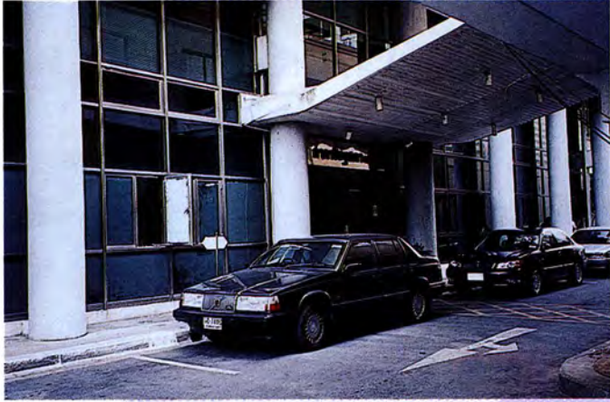
ด้านหน้าของอาคารรัฐสภา 3

อาคารรัฐสภา 3 เป็นอาคาร 7 ชั้น ภายในอาคารประกอบด้วย หอสมุดรัฐสภา ห้องประชุมงบประมาณ ห้องทำงานประธานคณะกรรมการธิการ และห้องประชุมกรรมการธิการ