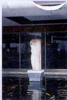
รูปผู้หญิงยืนแบกหม้อน้ำอยู่ทางซ้ายด้านหน้า ของอาคารรัฐสภา 1 หมายถึง ดิน