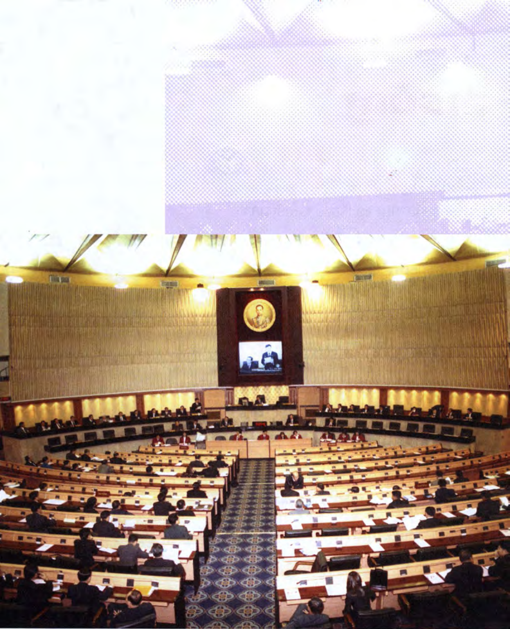
ห้องประชุมรัฐสภา