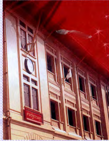
ศาลรัฐธรรมนูญ

ประธานศาลรัฐธรรมนูญและตุลาการศาลรัฐธรรมนูญมีวาระการดำรงตำแหน่ง 9 ปี นับตั้งแต่วันที่พระมหากษัตริย์ทรงแต่งตั้งและให้ดำรงตำแหน่งได้เพียงวาระเดียว