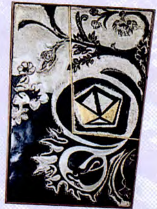
ภาพสัญลักษณ์ของการค้าและ เศรษฐกิจ ทั้งหมดอยู่ในความเสมอภาค และความเป็นธรรม แสดงออกด้วยรูปซึ่ง วางไว้บนแกนสมดุลแบบตาชั่งดุลการ