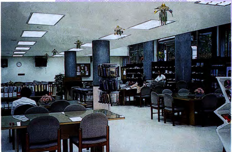
ห้องสมุดรัฐสภาภายในอาคารรัฐสภา 3

อาคารรัฐสภา 3 เป็นอาคาร 7 ชั้น ภายในอาคารประกอบด้วย หอสมุดรัฐสภา ห้องประชุมงบประมาณ ห้องทำงานประธานคณะกรรมการธิการ และห้องประชุมกรรมการธิการ