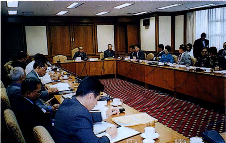
การประชุมของคณะกรรมการ

วาระที่ 2 เป็นการพิจารณาในรายละเอียดของร่างพระราชบัญญัติหรือร่างพระราชบัญญัติประกอบรัฐธรรมนูญโดยคณะกรรมการที่สภาตั้งหรือคณะกรรมการเต็มสภา ซึ่งการพิจารณาโดยกรรมการเต็มสภาจะกระทำต่อเมื่อคณะรัฐมนตรีร้องขอ หรือสมาชิกเสนอญัตติ โดยมีสมาชิกรับรองไม่น้อยกว่า 20 คน และที่ประชุมอนุมัติ