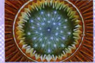
เพดานของ ห้องประชุม

ห้องประชุมรัฐสภา เป็นเสมือนหัวใจหลักที่มีความสำคัญมาก เพราะเป็นสถานที่ที่ใช้ในการตรากฎหมาย ควบคุมการบริหารราชการแผ่นดิน และให้ความเห็นชอบในเรื่องสำคัญต่าง ๆ สำหรับห้องประชุมรัฐสภาเป็นห้องประชุมทรงกลมขนาดใหญ่ภายใต้หลังคารูปโดม ภายในห้องประชุมสวยงามด้วยสถาปัตยกรรมสมัยใหม่ ที่มุ่งเน้นความสำคัญของการใช้ประโยชน์จากพื้นที่มีสิ่งอำนวยความสะดวก ระบบแสง ระบบเสียง ตลอดจนระบบการถ่ายเทอากาศที่สมบูรณ์ ที่นั่งทุกที่ได้ติดตั้งปุ่มเปิด-ปิด ไมโครโฟนและเครื่องลงคะแนนอิเล็กทรอนิกส์ ควบคุมด้วยระบบคอมพิวเตอร์