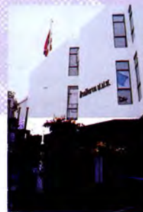
คณะกรรมการป้องกันและปราบปรามการทุจริตแห่งชาติ

คณะกรรมการป้องกันและปราบปรามการทุจริตแห่งชาติ ประกอบด้วย ประธานกรรมการ 1 คน และกรรมการผู้ทรงคุณวุฒิอื่นอีก 8 คน ซึ่งพระมหากษัตริย์ทรงแต่งตั้งจากคำแนะนำของวุฒิสภาจากผู้ซึ่งมีความซื่อสัตย์สุจริตเป็นที่ประจักษ์ โดยมีวาระการดำรงตำแหน่ง 9 ปี นับแต่วันที่พระมหากษัตริย์ทรงแต่งตั้งและให้ดำรงตำแหน่งได้เพียงวาระเดียว