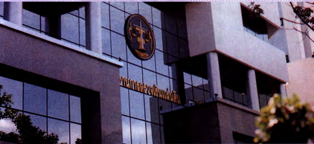
คณะกรรมการตรวจเงินแผ่นดิน

คณะกรรมการตรวจเงินแผ่นดิน ประกอบด้วย ประธานกรรมการ 1 คน และกรรมการอื่นอีก 9 คนซึ่งพระมหากษัตริย์ทรงแต่งตั้งตามคำแนะนำของวุฒิสภาจากผู้มีความชำนาญ และประสบการณ์ด้านการตรวจเงินแผ่นดิน การบัญชี การตรวจสอบภายใน การเงิน การคลัง และด้านอื่น ๆ โดยมีวาระการดำรงตำแหน่งคราวละ 6 ปี นับแต่วันที่พระมหากษัตริย์ทรงแต่งตั้งและให้ดำรงตำแหน่งได้เพียงวาระเดียว