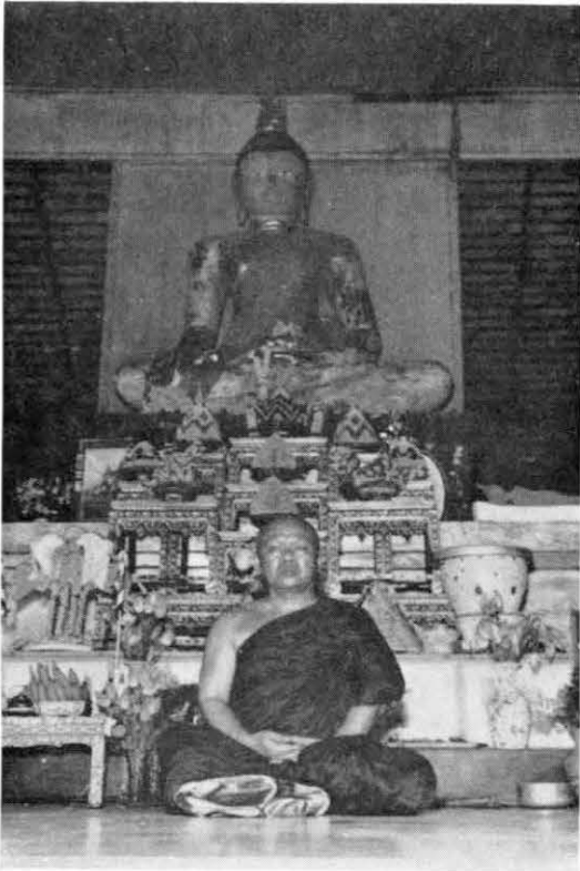
อุปสมบท ณ วัดใหญ่ชัยมงคล พระนครศรีอยุธยา