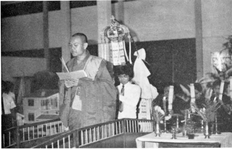
พิธีก่เต็กในการบำเพ็ญกุศลสวดวาร