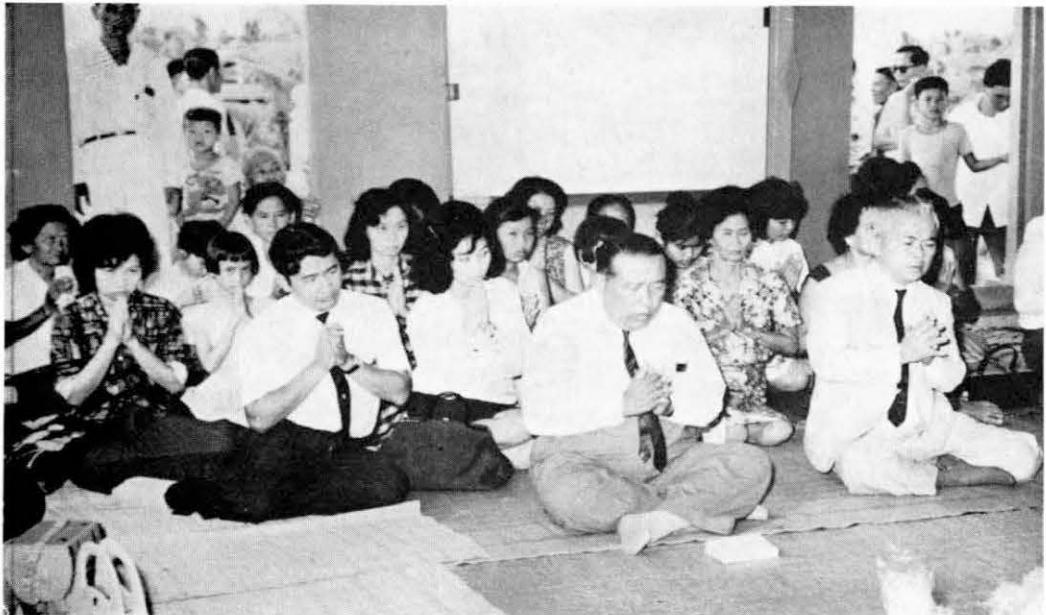
ทำบุญฉลองศาลาการเปรียญ วงษ์สกุล— อิศรกุล วัดราษฎร์ศรัทธาธรรม อ. บางปะกง จ. ฉะเชิงเทรา