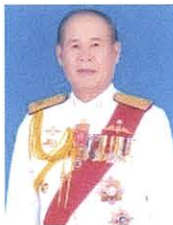
พลตรี จารึก อารีราชารณย์ กรรมการและที่ปรึกษา