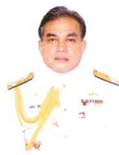
พลเรือเอก สุรศักดิ์ หุ่นเรืองรมย์ กรรมการและที่ปรึกษา