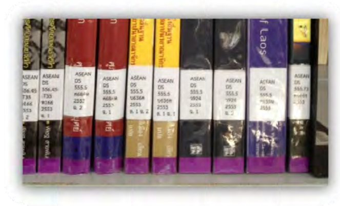
สัญลักษณ์ของหนังสือมมาอาเซียน