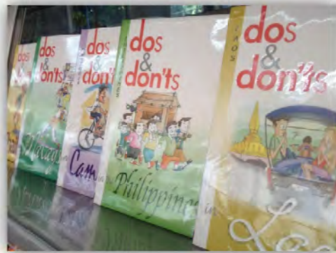
หนังสือเกี่ยวกับประเทศสมาชิกอาเซียนภาษาไทย และภาษาต่างประเทศ