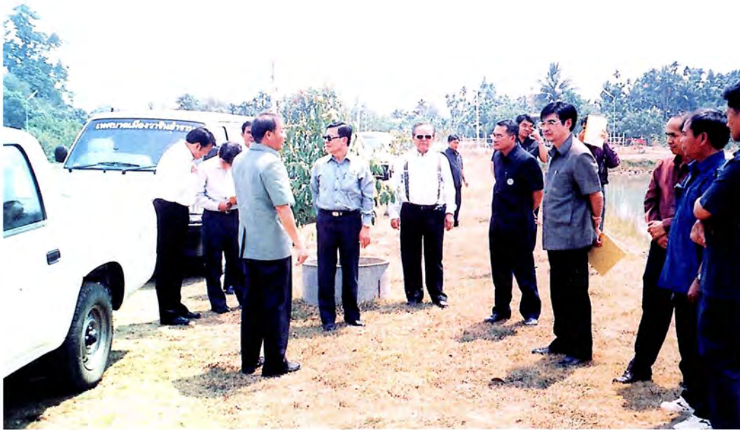
คณะกรรมการเดินทางไปศึกษาดูงาน เรื่อง การใช้จ่ายงบประมาณกระตุ้นเศรษฐกิจตามแผนงานโครงการ การพัฒนาการท่องเที่ยว จังหวัดอุบลราชธานี เมื่อวันที่ 14-15 มีนาคม 2545