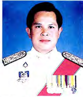
นายพีระพันธุ์ สาลีรัฐวิภาค ประธานคณะกรรมการ สมาชิกสภาผู้แทนราษฎร กรุงเทพมหานคร