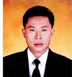
นายศักดิ์สยาม ชิดชอบ โฆษกคณะกรรมการ สมาชิกสภาผู้แทนราษฎร จังหวัดบุรีรัมย์