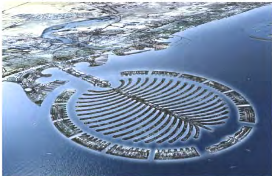
รูปภาพโครงการปาล์มจูไมราห์

การก่อสร้างโครงการดังกล่าวใช้ระยะเวลา ๗ ปี โดยอาศัยแรงงานก่อสร้างจากผู้ใช้แรงงานในประเทศต่างๆในภูมิภาคเอเชียใต้ เช่นอินเดีย ปากีสถาน และบังคลาเทศ เพราะผู้ใช้แรงงานเหล่านี้เป็นแรงงานราคาถูกที่สุด โดยทำงานผลัดกัน ๒-๓ ช่วงต่อวัน ช่วงละ ๘ ชั่วโมง แล้วแต่อุณหภูมิในฤดูต่างๆ ซึ่งการผลิตกันทำงานดังกล่าวช่วยให้การก่อสร้างรุดหน้าได้อย่างรวดเร็วและเสร็จสมบูรณ์ตามแผนที่กำหนด