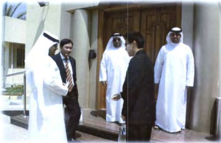
ผู้บริหาร The National Emergency, Crisis and Disasters Management Authority ส่งคณะกรรมการธิการเดินทางกลับ