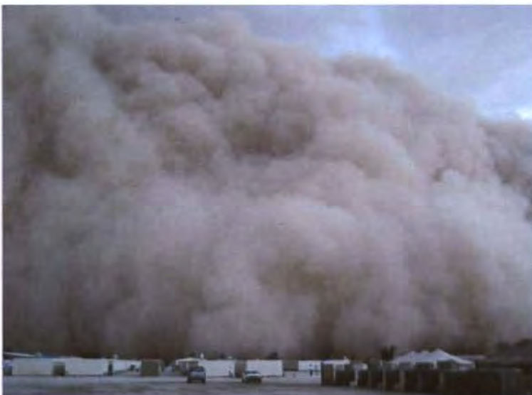
ภาพขณะเกิดพายุทราย