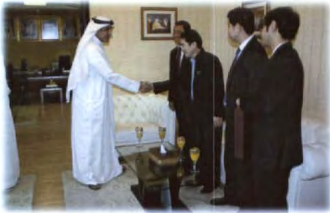
ภายหลังการแลกเปลี่ยนความคิดเห็น ระหว่างผู้บริหารของ The National Emergency, Crisis and Disasters Management Authority กับผู้แทนคณะกรรมการฯ