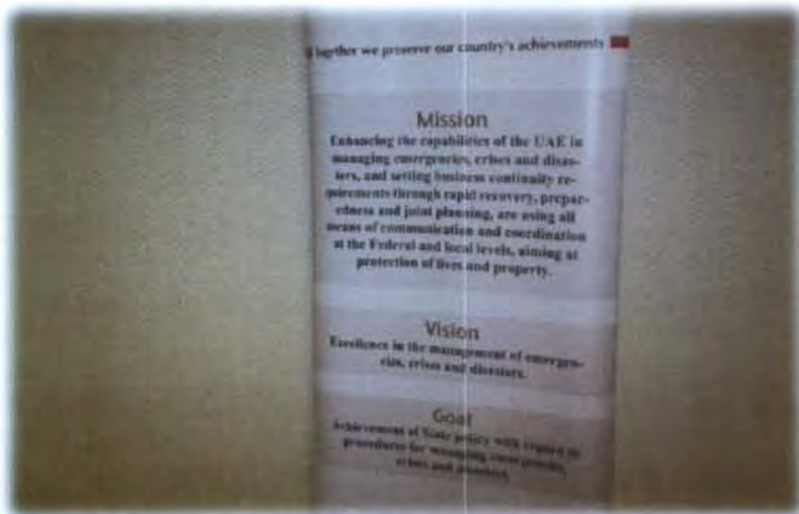
คณะกรรมการรับฟังบรรยายสรุป เกี่ยวกับการบริหารจัดการภัยพิบัติที่เกิดขึ้น ในสหรัฐอาหรับเอมิเรตส์