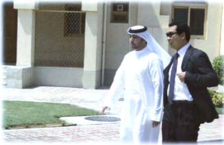
เยี่ยมชมศูนย์สั่งการกรณีเกิดภัยพิบัติภายใน สำนักงาน The National Emergency, Crisis and Disasters Management Authority