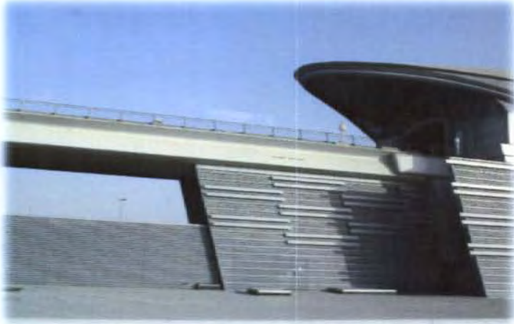
การขนส่งระบบราง Monorail และสถานีรถไฟฟ้าของเมืองคูไบ