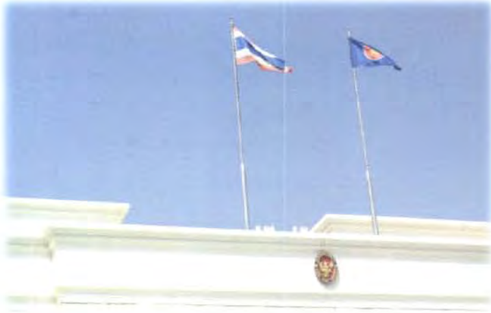
สถานเอกอัครราชทูตไทย ณ กรุงอาบูดาบี