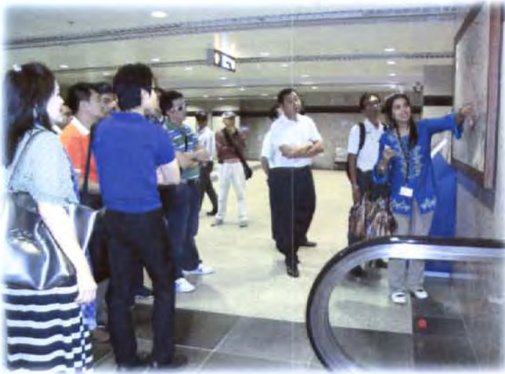
คณะกรรมการเยี่ยมชมและรับฟังบรรยาย สรุปเกี่ยวกับโครงการ Palm Jumirah