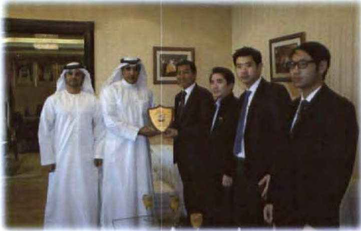
ผู้บริหารของ The National Emergency, Crisis and Disasters Management Authority แลกเปลี่ยนของที่ระลึกกับผู้แทน คณะกรรมการธิการ