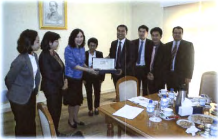
คณะกรรมการมอบของที่ระลึก ให้กับอุปทูต เลขานุการเอก และเจ้าหน้าที่ ของสถานเอกอัครราชทูตไทย ณ กรุงอาบูดาบี