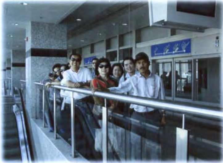
เยี่ยมชมการขนส่งระบบราง Monorail ของเมืองดูไบ ที่มีความปลอดภัยสูง