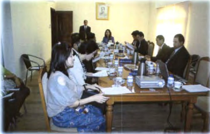
คณะกรรมการรับฟังบรรยายสรุป เกี่ยวกับการอพยพคนไทยกรณีเกิดภัยพิบัติ ของสถานเอกอัครราชทูตไทย ณ กรุงอาบูดาบี