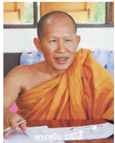
พระสุบิน ปณิโต