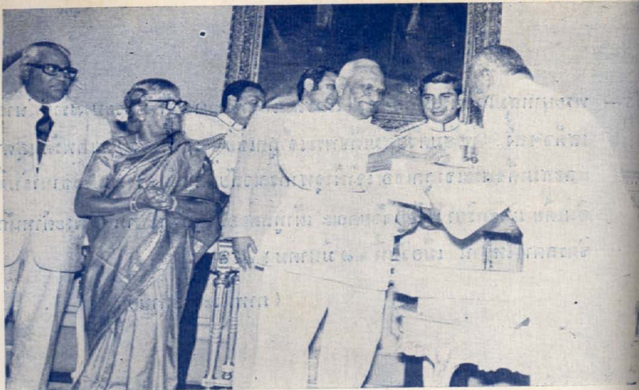
จอมพลถนอม กิตติขจร หัวหน้าคณะปฏิวัติ และท่านผู้หญิงจกกล กิตติขจร มอบของขวัญแก่ประธานาธิบดี ฯ ณ พระที่นั่งบรมพิมาน