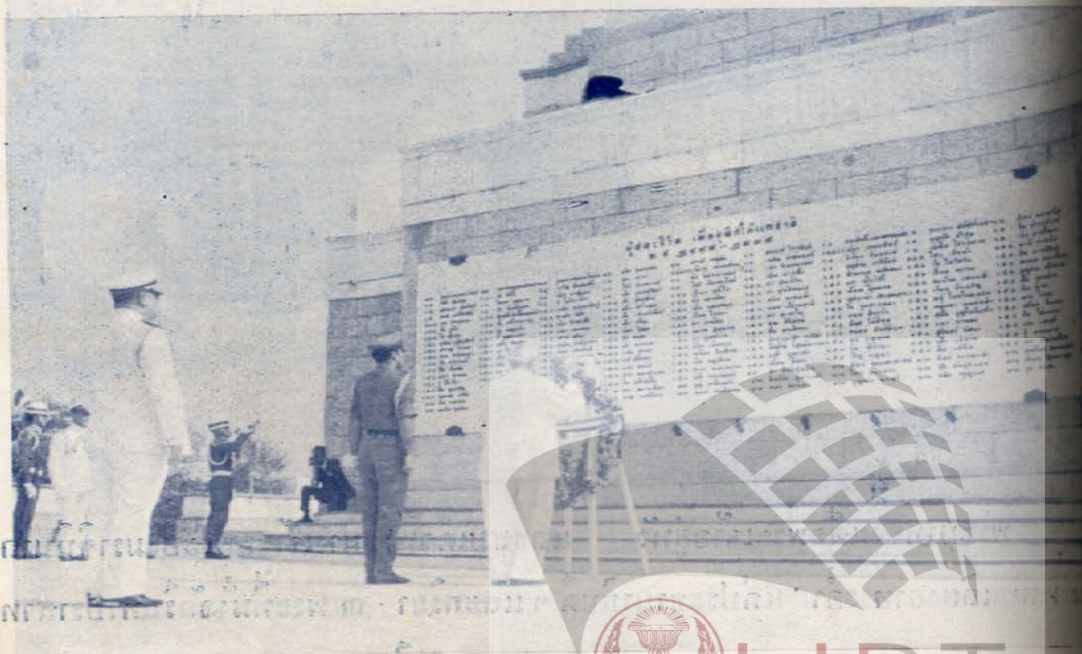
ประธานาธิบดีคอนเดย์ วางพวงมาลา ณ นางสาวรัชชยสมรภูมิ