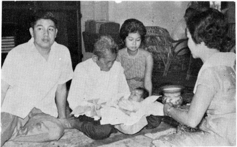
แม่อุ้มเหลนคนที่ ๑๒ ในวันโกนผมไฟ พ.ศ. ๒๕๐๔