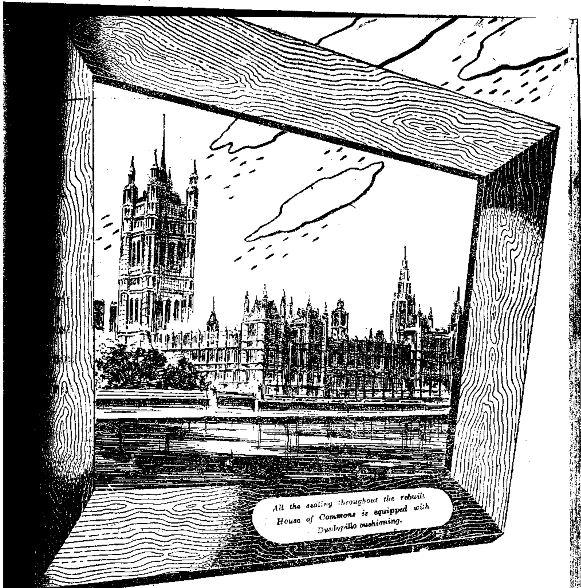
All the seating throughout the rebuilt House of Commons is equipped with Dunlopillo cushioning.