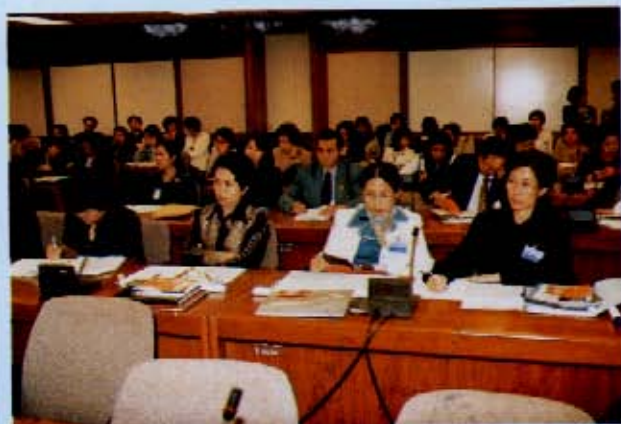
วันพุธที่ 4 สิงหาคม 2542 คณะกรรมาธิการกิจการสตรี เยาวชนและผู้สูงอายุ วุฒิสภา ร่วมกับสมาคม ผู้หญิงกฎหมาย และการพัฒนาแห่งเอเชียและแปซิฟิก สถาบันผู้หญิงกับการเมือง ฯลฯ จัดเสวนาเรื่อง "การมีส่วน ร่วมของผู้หญิงในการตัดสินใจ : ประชาพิจารณ์นอกรอบ" ณ ห้องรับรอง 1-2 ชั้น 3 อาคารรัฐสภา 2