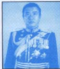
พลเอก มงคล อัมพรพิสิฏฐ์