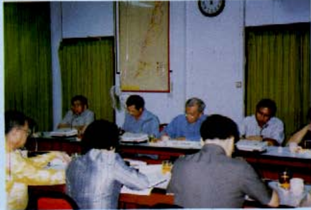
วันที่ 4-5 สิงหาคม 2542 คณะกรรมาธิการการต่างประเทศ วุฒิสภา เดินทางไปศึกษาดูงานด้าน สถานการณ์ชายแดนไทย-พม่า ณ จังหวัดระนอง