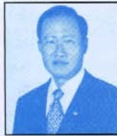
คุณประยุทธ์ มหากิจศิริ