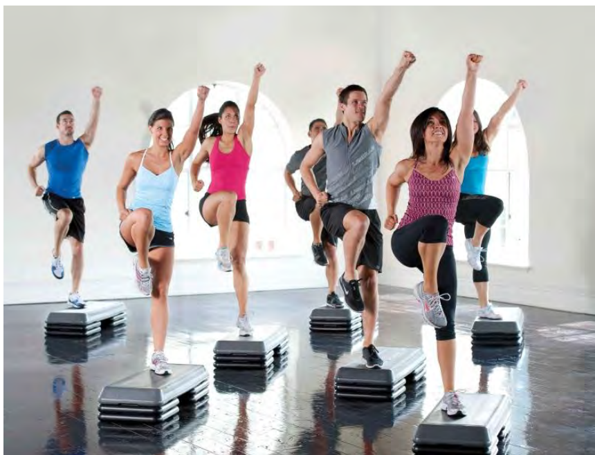
ออกกำลังกาย