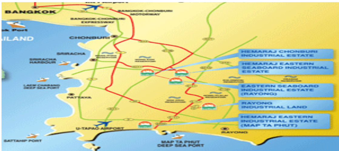
พื้นที่พัฒนาชายฝั่งทะเลด้านตะวันออกของไทย

ประการที่ 3 ด้านภูมิศาสตร์ทางเศรษฐกิจ เนื่องจากจุดยุทธศาสตร์สำคัญทางเศรษฐกิจได้รวมศูนย์อยู่ที่พื้นที่ชายฝั่งทะเลภาคตะวันออกของไทยทั้งในส่วนของนิคมอุตสาหกรรม โรงงานอุตสาหกรรมขนาดใหญ่ โรงงานปิโตรเคมี โรงกลั่นน้ำมัน สนามบิน ฯลฯ จึงมีความจำเป็นต่อการสร้างความมั่นใจทางเศรษฐกิจและด้านการลงทุน