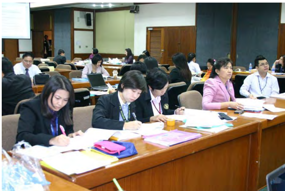
โครงการสัมมนาเชิงปฏิบัติการ PMQA

สำนักงานเลขาธิการสภาผู้แทนราษฎร ได้ประกาศใช้แผนยุทธศาสตร์สำนักงานเลขาธิการสภาผู้แทนราษฎร พ.ศ. 2557–2560 หรือแผนยุทธศาสตร์ฉบับรองรับสภาพปฏิรูปแห่งชาติและคณะกรรมการยกร่างรัฐธรรมนูญ และได้มีการทบทวนและปรับปรุงแผนยุทธศาสตร์ดังกล่าว โดยการรับฟังความคิดเห็นและความต้องการของผู้รับบริการและผู้มีส่วนได้ส่วนเสีย ซึ่งได้แก่ สมาชิกสภานิติบัญญัติแห่งชาติ สมาชิกสภาปฏิรูปแห่งชาติ กรรมการ กรรมการข้าราชการรัฐสภา ผู้แทนองค์กรอิสระ ส่วนราชการ หน่วยงานภาครัฐ เอกชน ประชาชน สื่อมวลชน วิทยากรและคณะผู้บริหารสำนักงาน จำนวนทั้งสิ้น 148 คน ทั้งนี้ เพื่อกำหนดกรอบทิศทางการดำเนินการและพัฒนาองค์กร ภายใต้ยุทธศาสตร์ 6 ด้านคือ 1) สนับสนุนกระบวนการนิติบัญญัติ สภาปฏิรูปแห่งชาติ และคณะกรรมการยกร่างรัฐธรรมนูญอย่างมืออาชีพ 2) สนับสนุนงานรัฐสภา สภานิติบัญญัติแห่งชาติ และสภาปฏิรูปแห่งชาติ เพื่อสร้างความเชื่อมั่นและมีบทบาทนำในเวทีประชาคมอาเซียนและรัฐสภาระหว่างประเทศ 3) ส่งเสริมและสนับสนุนให้ประชาชนมีความปรองดองสมานฉันท์ สร้างการมีส่วนร่วมในการปฏิรูปประเทศไทย เพื่อพัฒนาประชาธิปไตยให้เข้มแข็ง 4) พัฒนาองค์กรมุ่งการเป็น Smart Parliament 5) พัฒนาองค์กรและบุคลากรให้มีขีดสมรรถนะสูง 6) สนับสนุนการก่อสร้างรัฐสภาแห่งใหม่ให้ทันสมัย และพัฒนาอาคารสถานที่ ระบบการรักษาความปลอดภัยตามมาตรฐานสากล